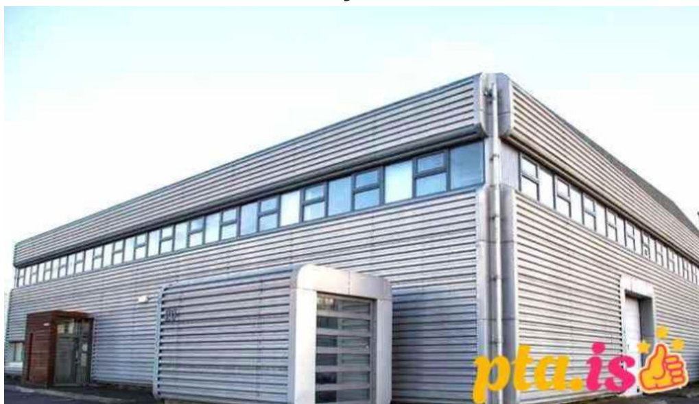
lðan fræðslusetur reykjavik