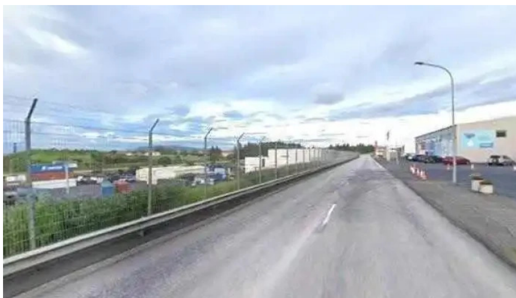
lðan fraedslusetur street view 360deg