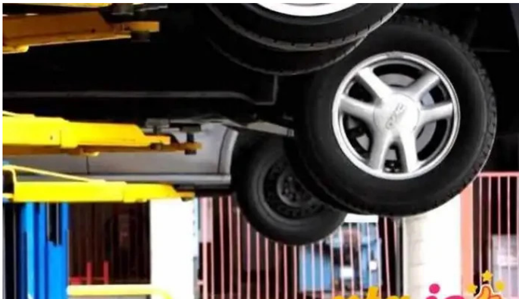
Ídan fraedslusetur fra eiganda