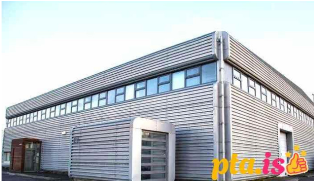
Ídan fraedslusetur fræðslumiðstoð