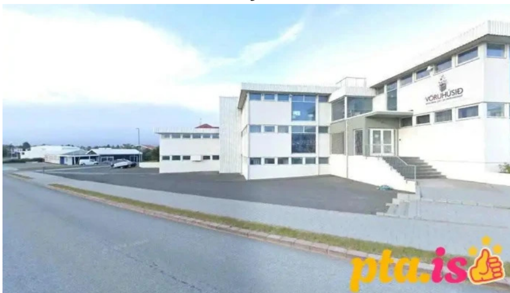
Vöruhúsið hofn í hornafirði