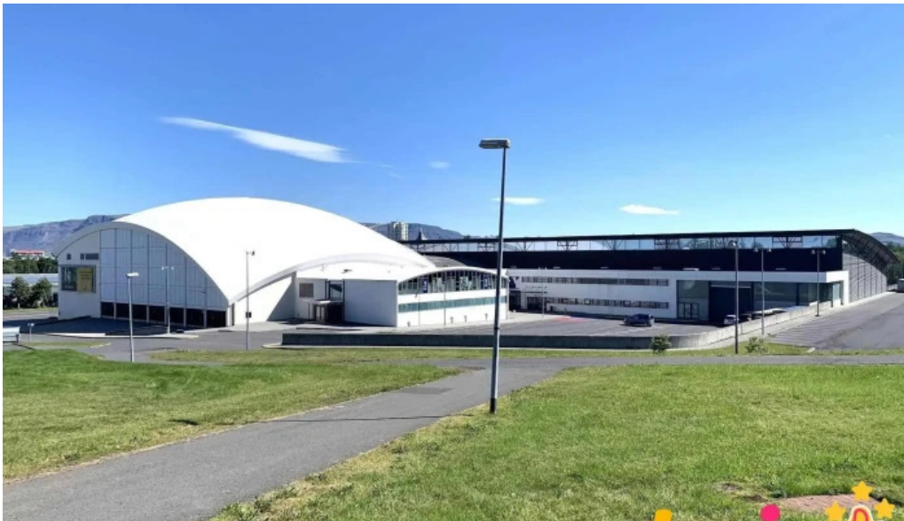
Ithrotta og olympusamband islands isi frjals felagasamtok