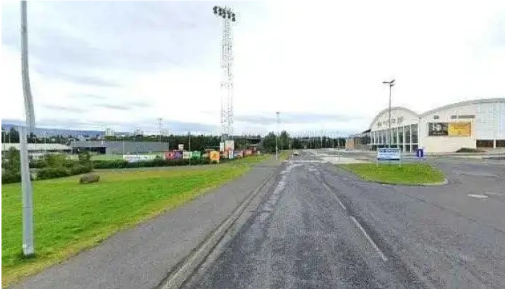
Ithrotta og olympusamband islands isi street view 360deg