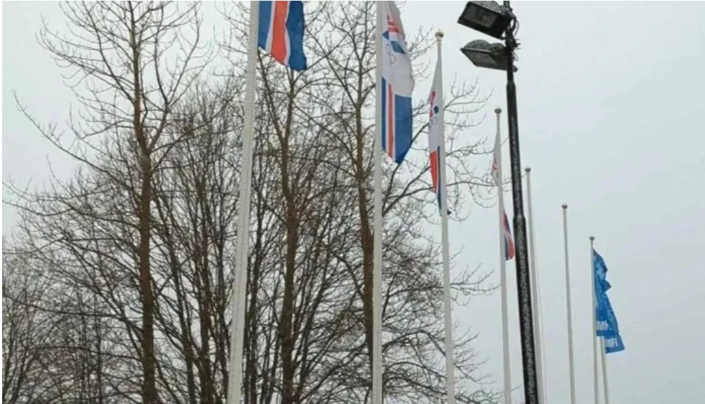
Ithrotta og olympusamband islands isi myndskaid