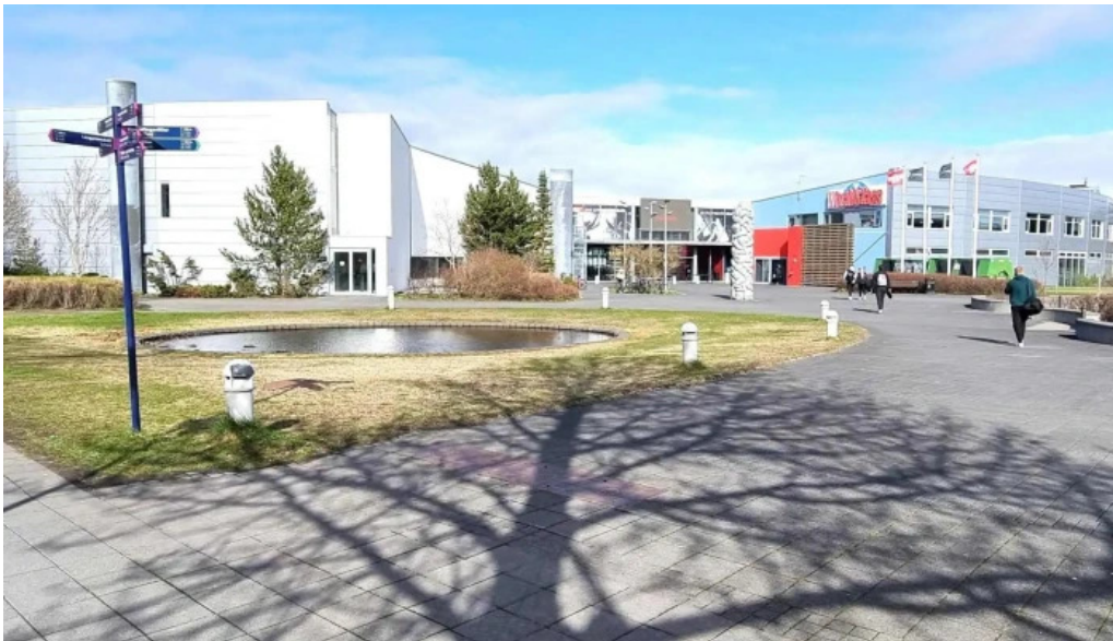
Ithrotta og olympusamband islands isi reykjavik