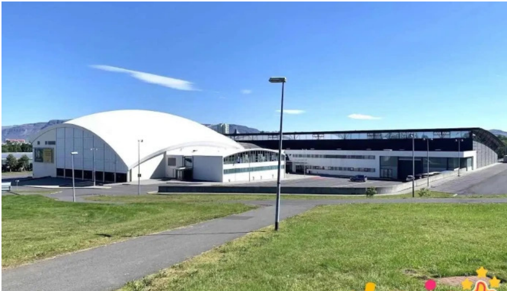
Íþrotta og olympíusamband íslands ísÍ reykjavík