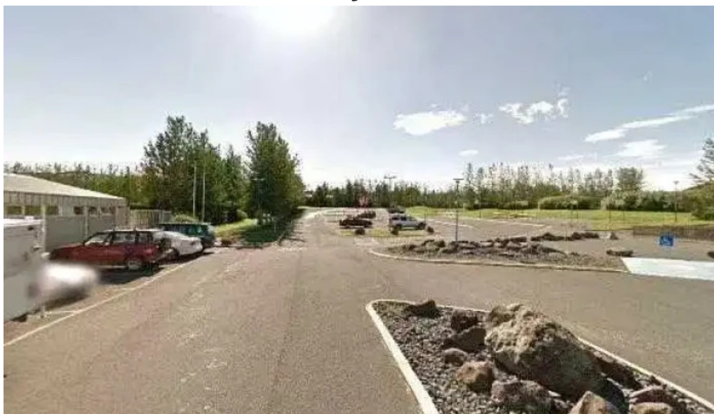
Afturelding ungmennafélag street view 360deg