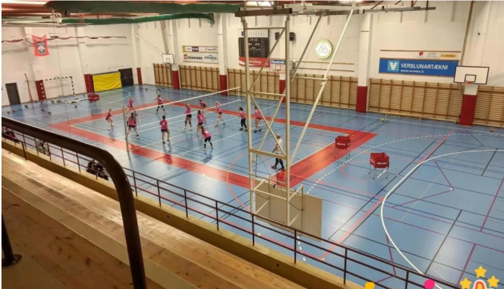
Afturelding ungmennafelag frjals felagasamtok