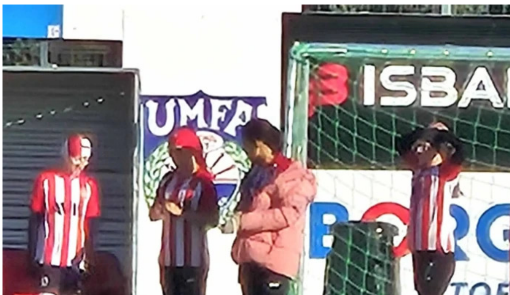
Afturelding ungmennafélag mosfellsbær