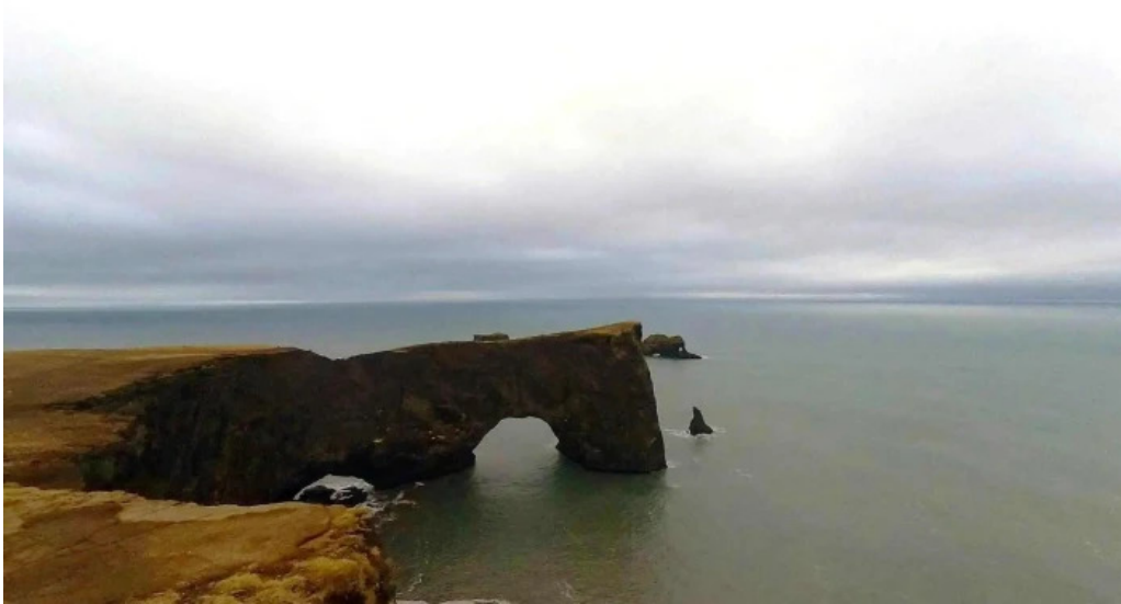
Dyrholaey street view 360deg