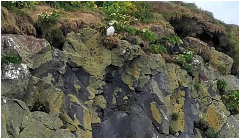
Dyrhólaey reynisfjara viewpoint