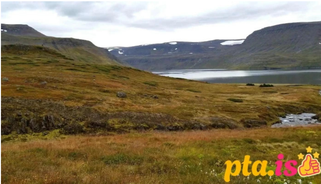
Hornstrandir fridland myndскеid