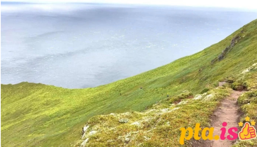
Hornstrandir fridland fjall