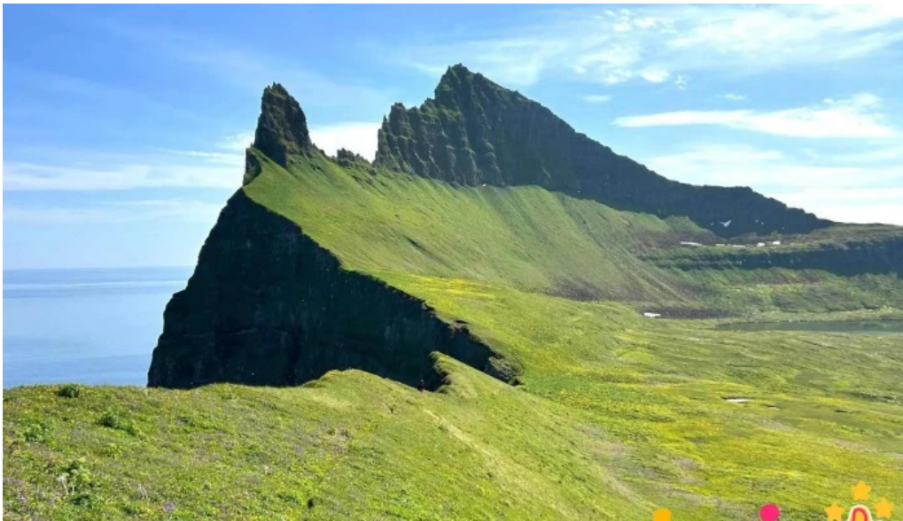
Hornstrandir fridland hornbjarg