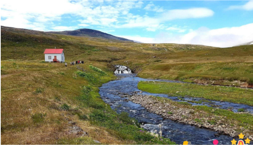
Hornstrandir fridland læknihusid