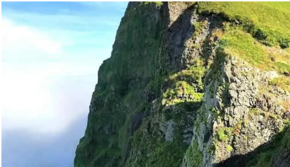
Hornstrandir friðland isafjorður