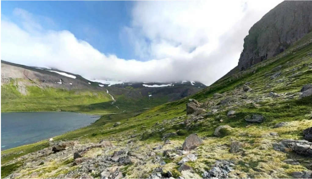
Hornstrandir fridland street view 360