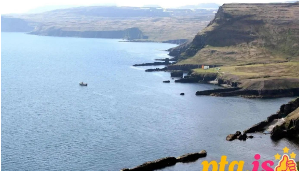
Hornstrandir fridland hornbjarsviti tjaldsvæði