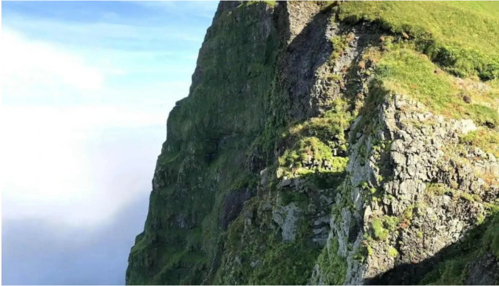
Hornstrandir fridland friðland