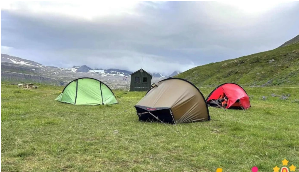
Hornstrandir fridland hornvik tjaldsvaedi