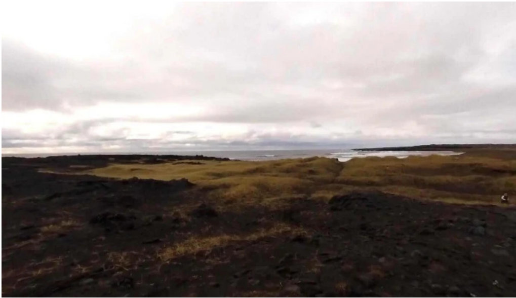
Sandvik street view 360deg