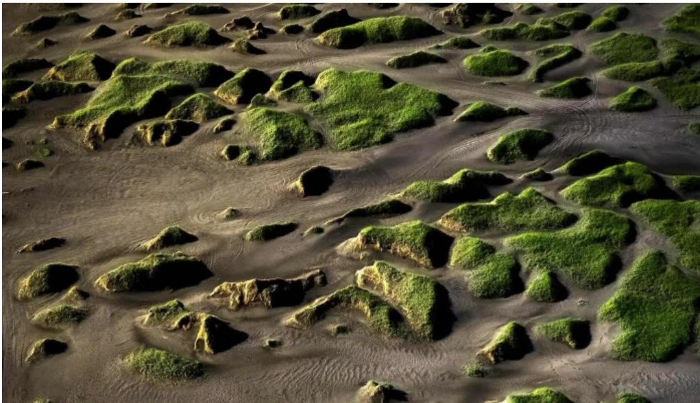
Sandvik nálægt mer