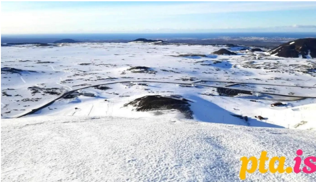
Reykjanesfolkvangur blafjoll skidasvaedi