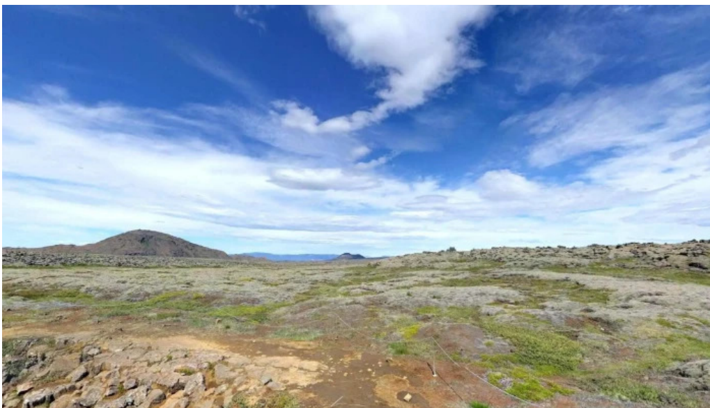
Reykjanesfjall street view 360