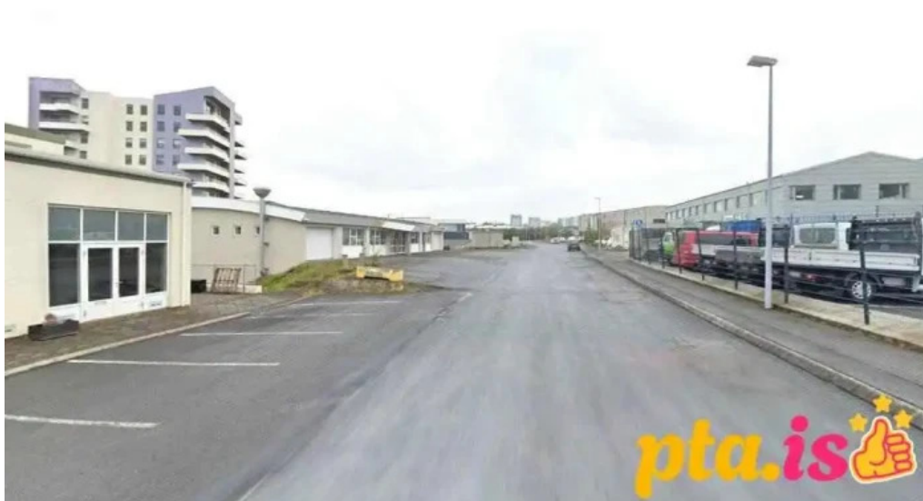
þjónustumiðstoð kópavogsbæjar kópavogur