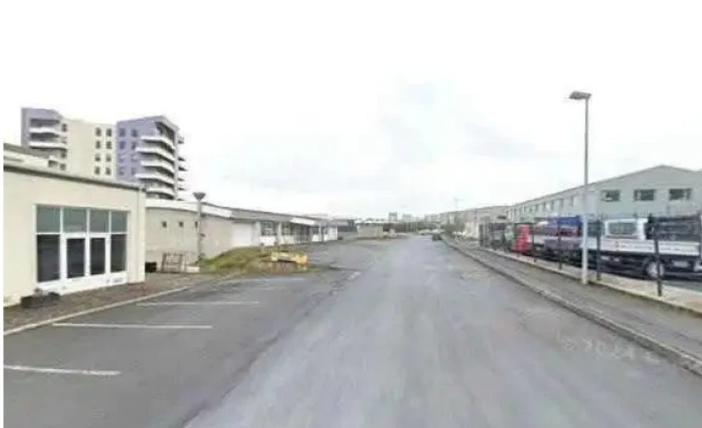
Thjónustumidstod kópavogsbæjar framkvæmdasvið