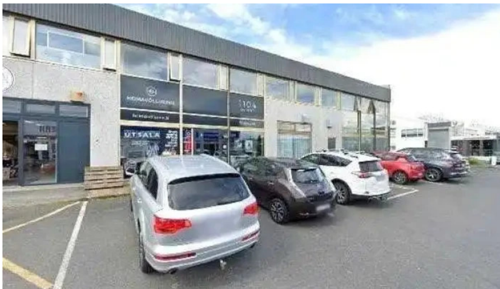
Heimavollurinn street view 360