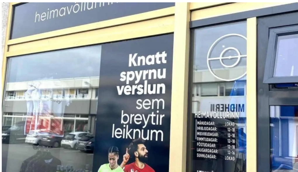
Heimavollurinn fra eiganda