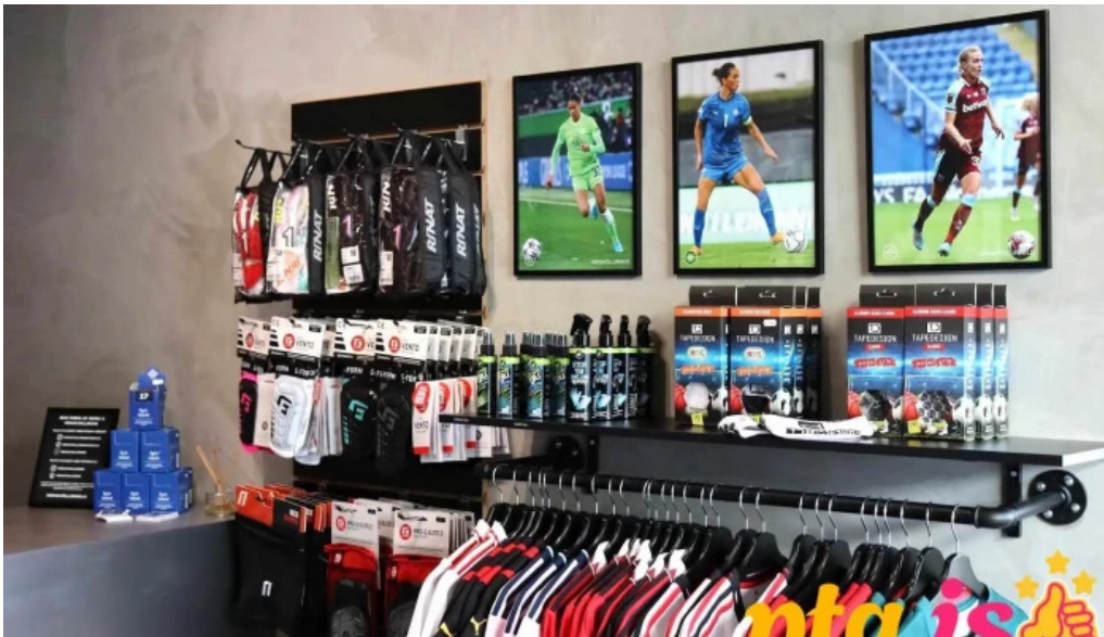
Heimavollurinn ad innan