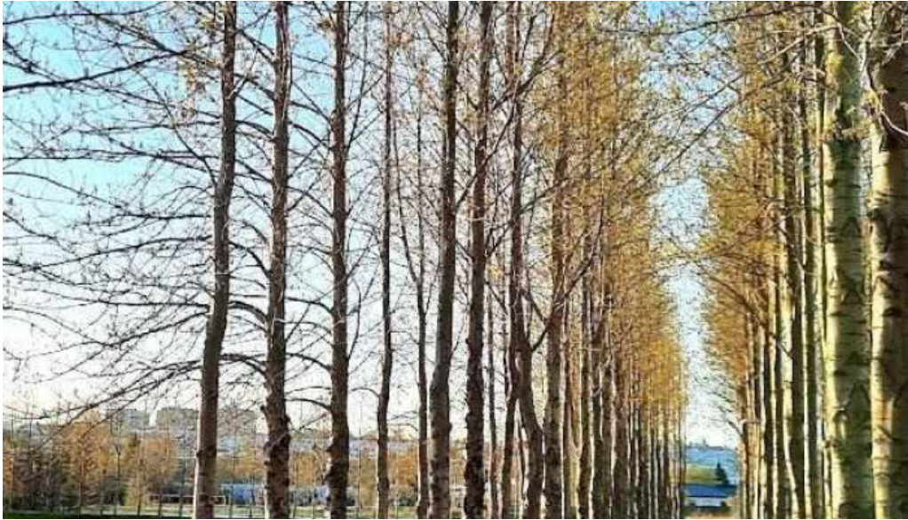
Fagrilundur grasæfingarsvæði breiðabliks kopavogur