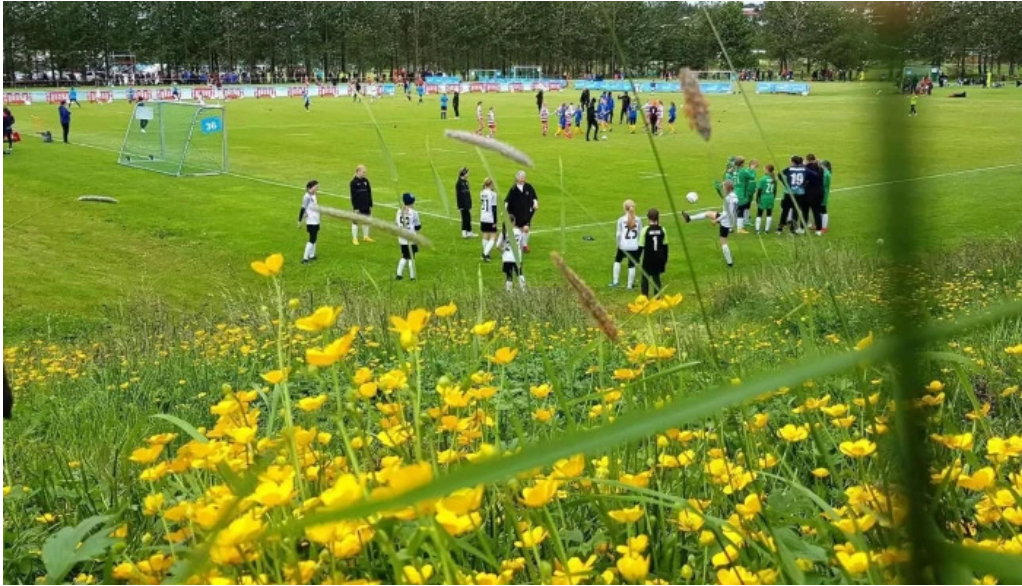
Fagrilundur grasaefingarsvaedi breidabliks numer