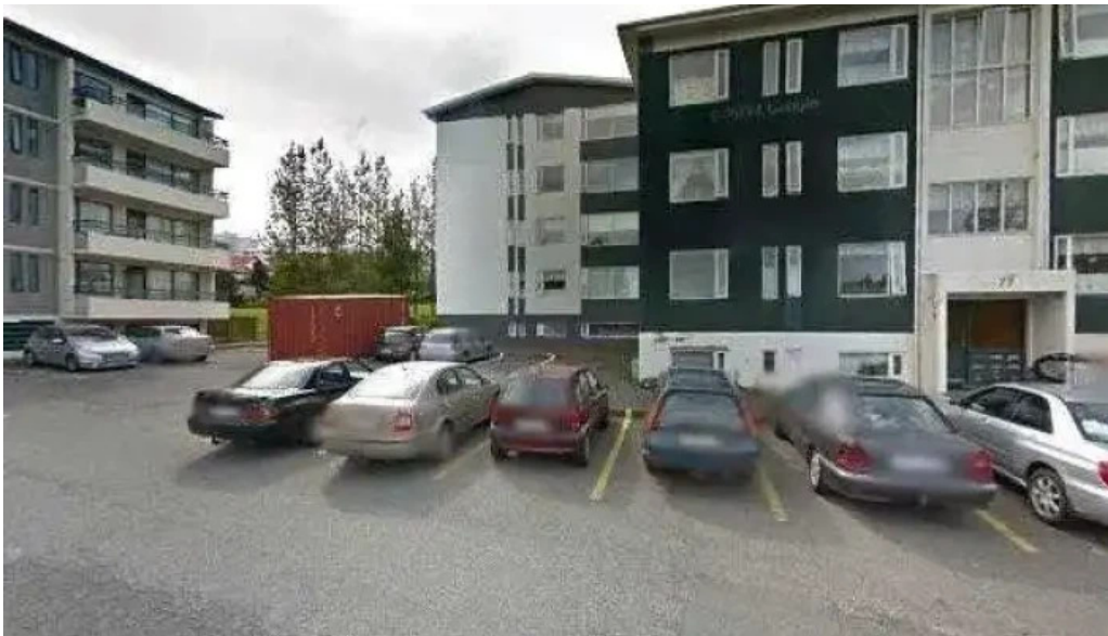
Fagrilundur grasæfingarsvæði breiðabliks street view 360deg