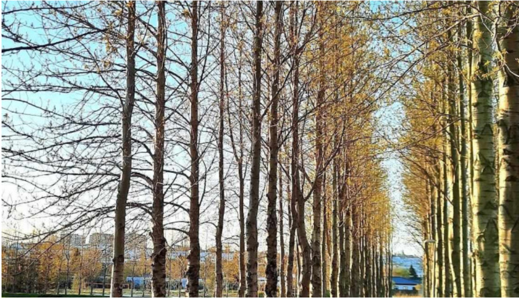
Fagrilundur grasaefingarsvaedi breidabliks fotboltavollur