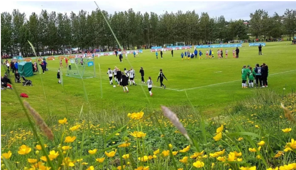
Fagrilundur grasaefingarsvaedi breidabliks kopavogur