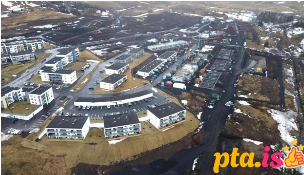
Liljugata 4 fjolbýlishus