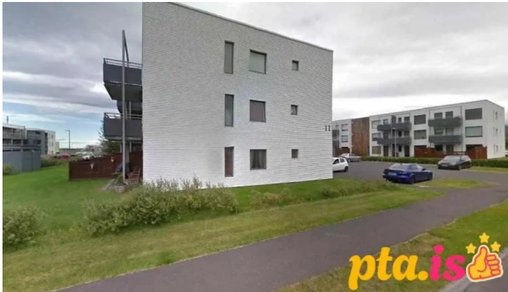
Klapparhlíð 11 mosfellsbær