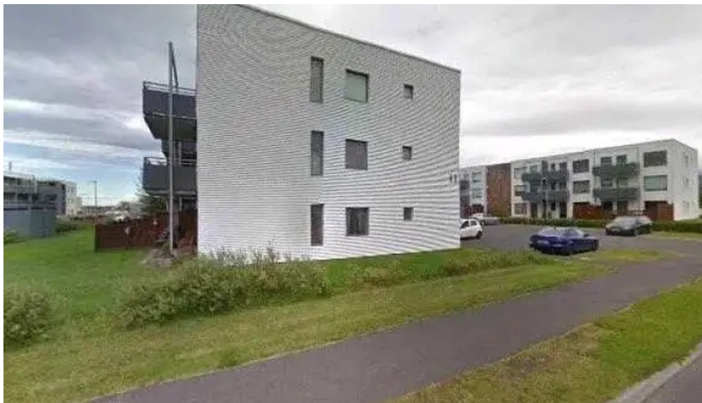
Klapparhlíð 11 fjolbýlishus