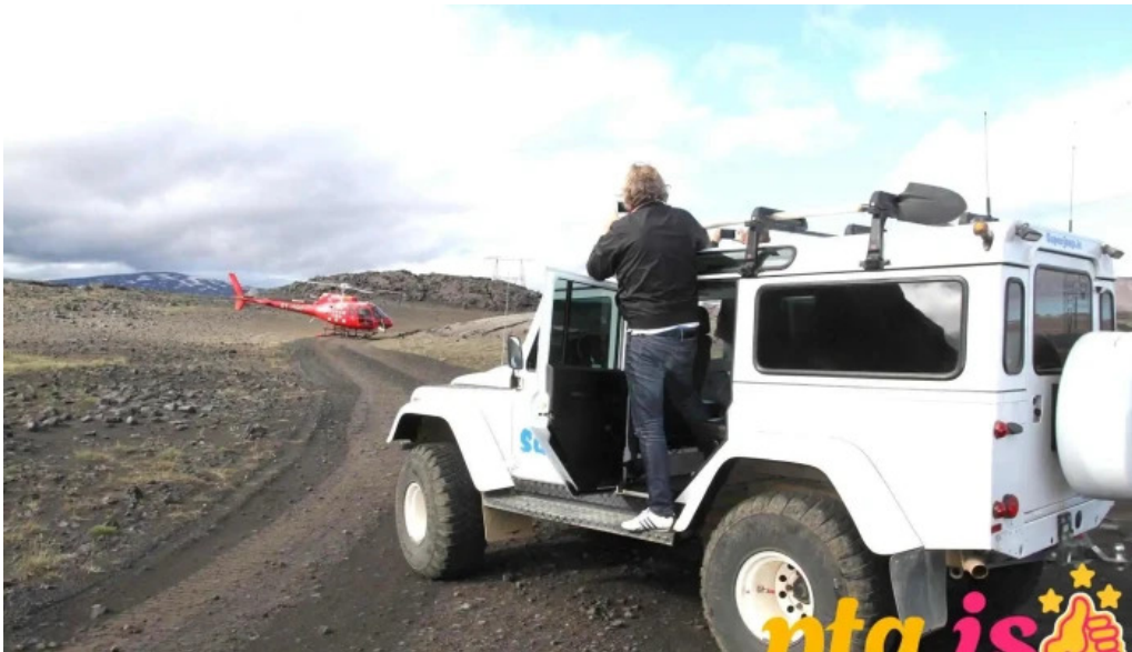
Superjeepis fra eiganda