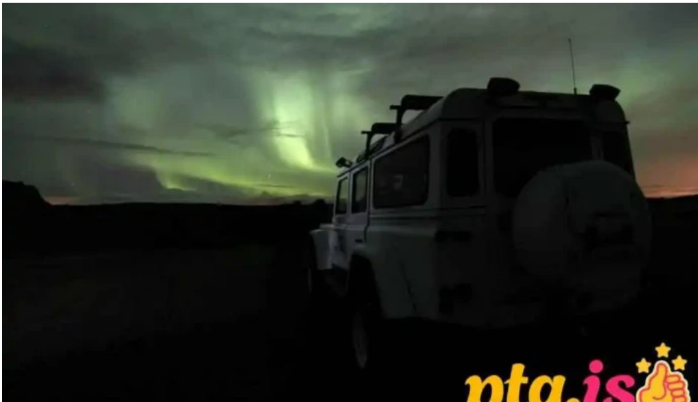
Superjeep is mosfellsbær