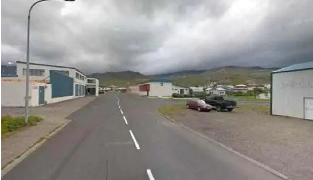
Snæfellsnes excursions street view 360deg