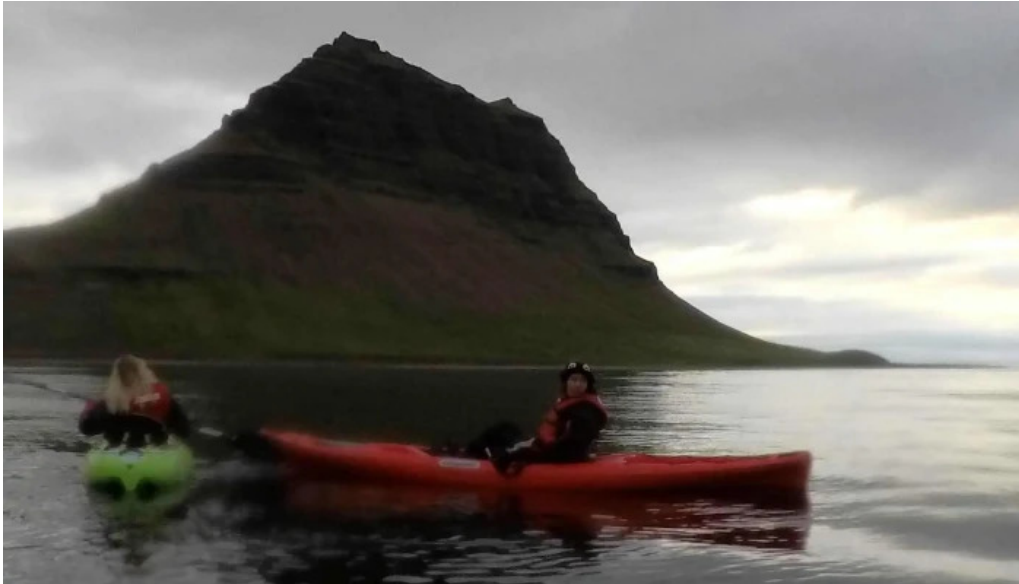
Snaefellsnes excursions verð