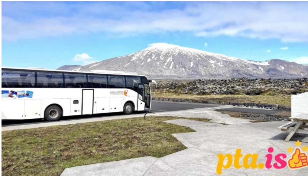
Snaefellsnes excursions ferðapjonustufyrirtæki