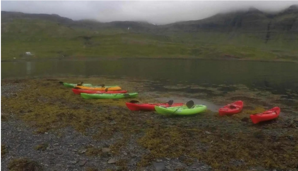
Snaefellsnes excursions myndbond