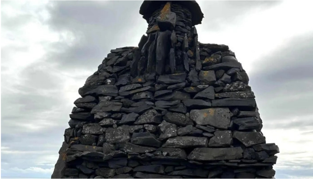
Snæfellsnes excursions numer