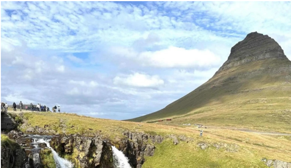
Snæfellsnes excursions opið nuna