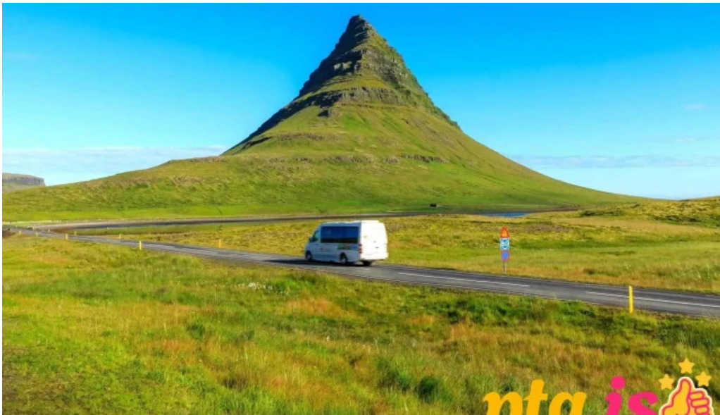
Snaefellsnes excursions fra eiganda