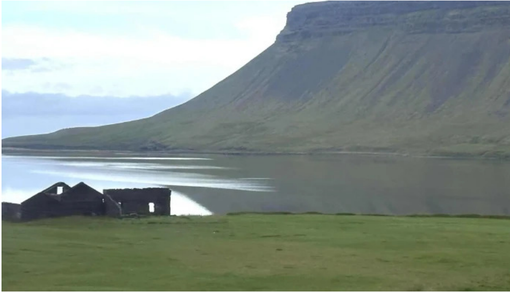
Snaefellsnes excursions grundarfjörður