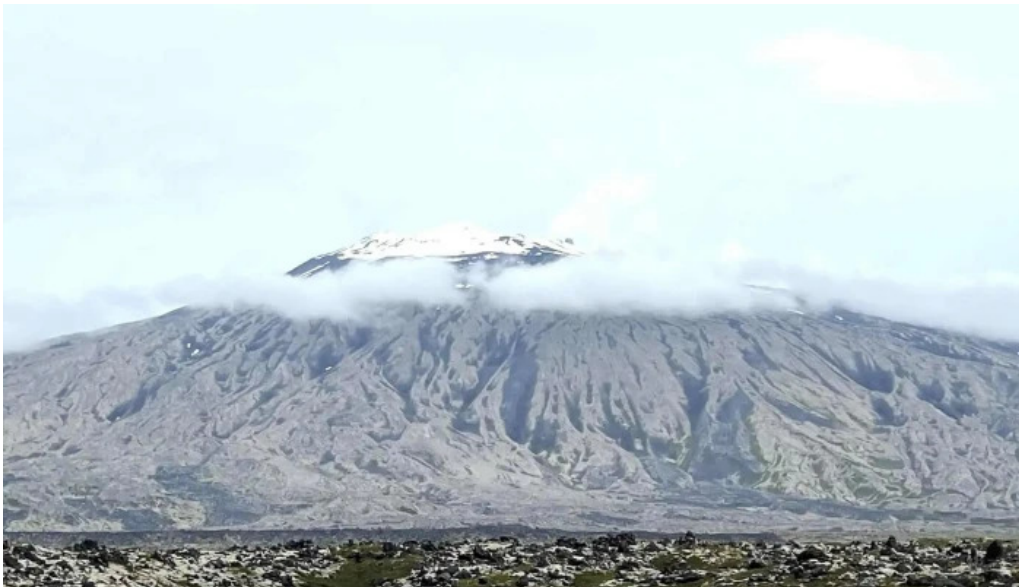
Snaefellsnes excursions kynning