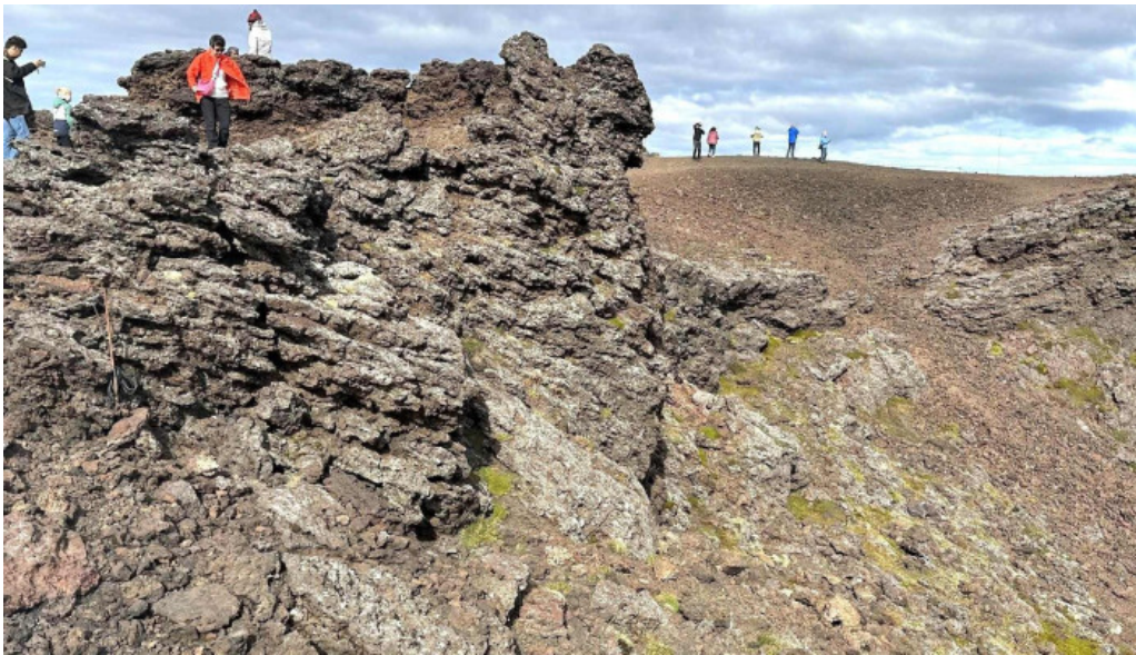
Snæfellsnes excursions nálægt mer