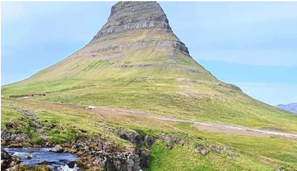
Snaefellsnes excursions umsagnir