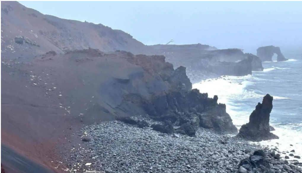
Volcano atv vestmannaeyjabær