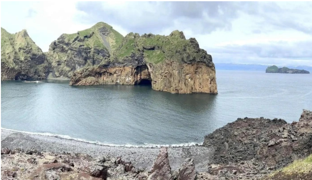
Volcano atv svæði