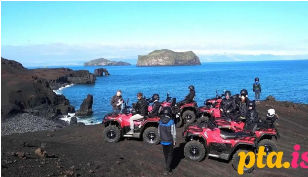
Volcano atv ferðaskrifstofa