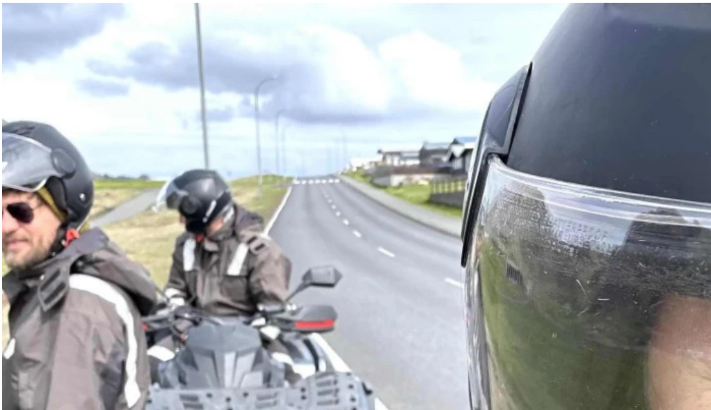
Volcano atv kynning