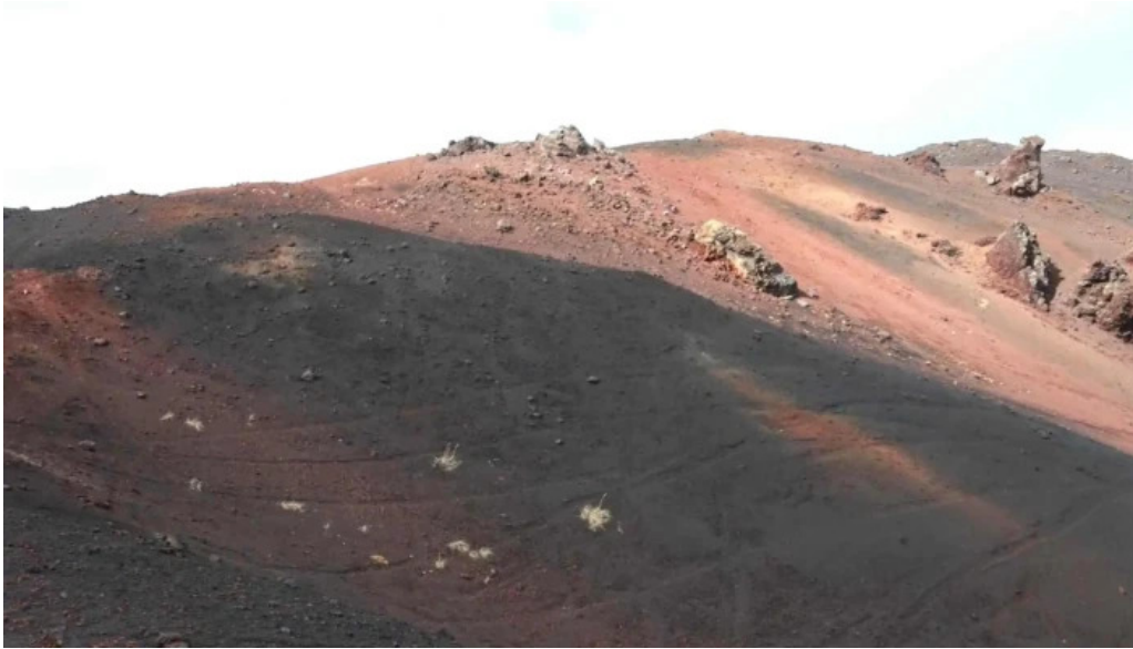
Volcano atv umsagnir