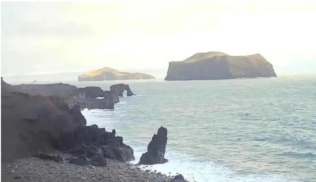
Volcano atv myndskaid