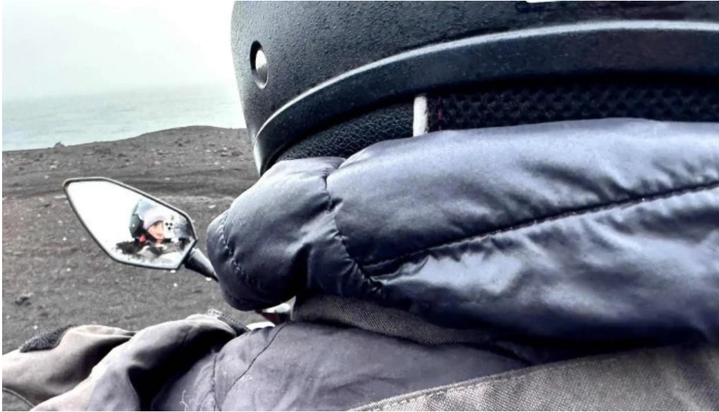
Volcano atv myndir