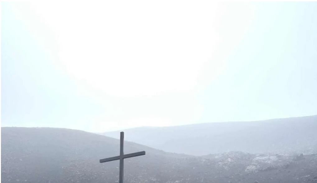
Volcano atv hvar