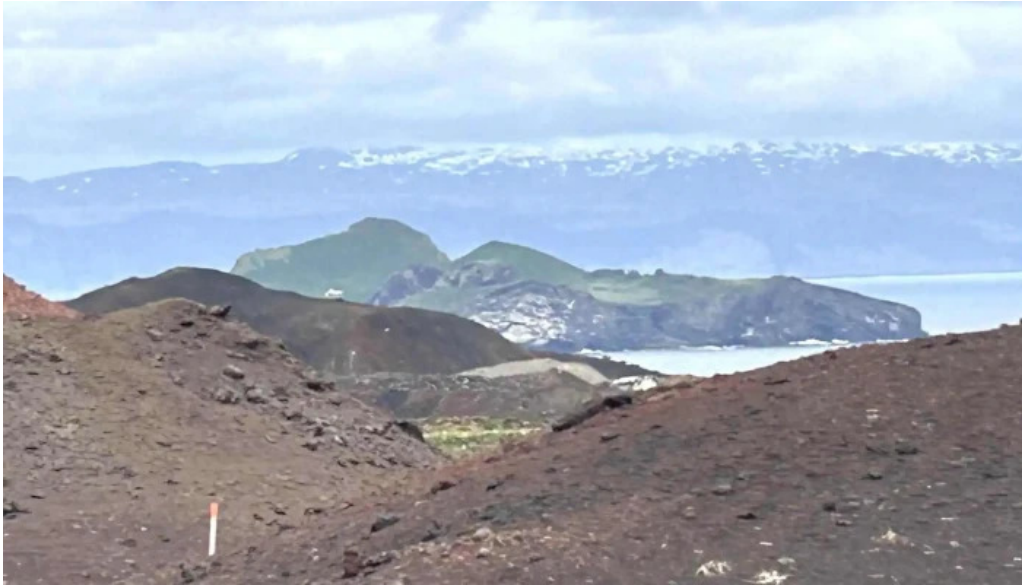
Volcano atv safn