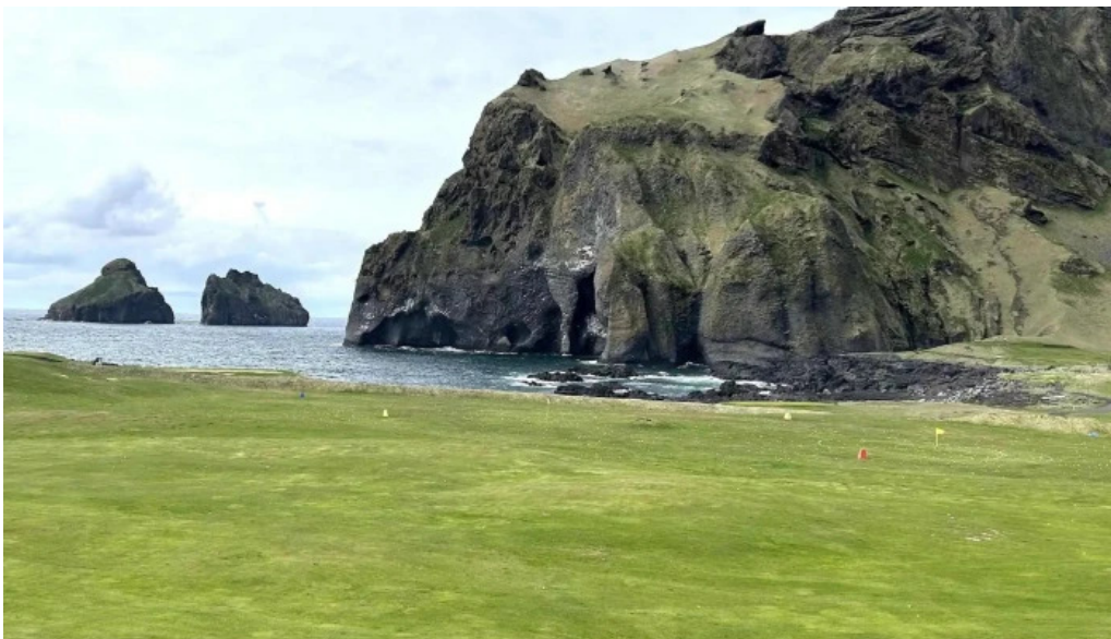
Volcano atv staðsetning