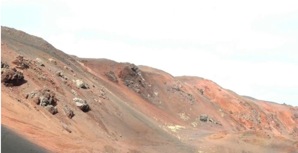
Volcano atv hvernig a að komast þangað