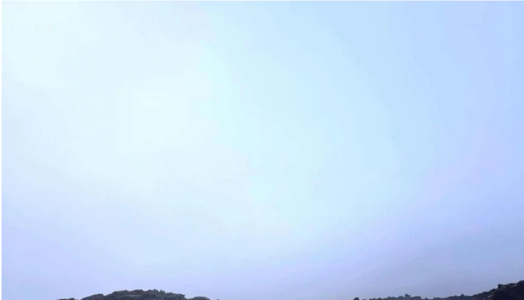
Volcano atv einkunn