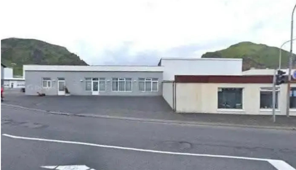
Volcano atv street view 360deg