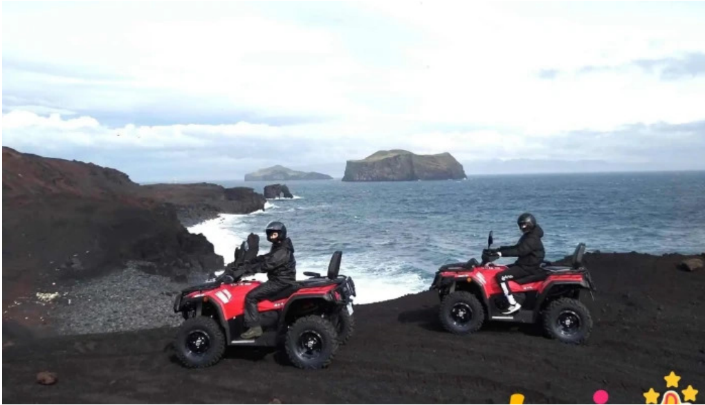
Volcano atv fra eiganda