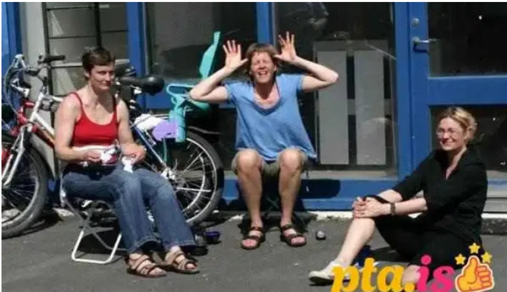
Islenskir fjallaleidsogumenn ferðaskrifstofa