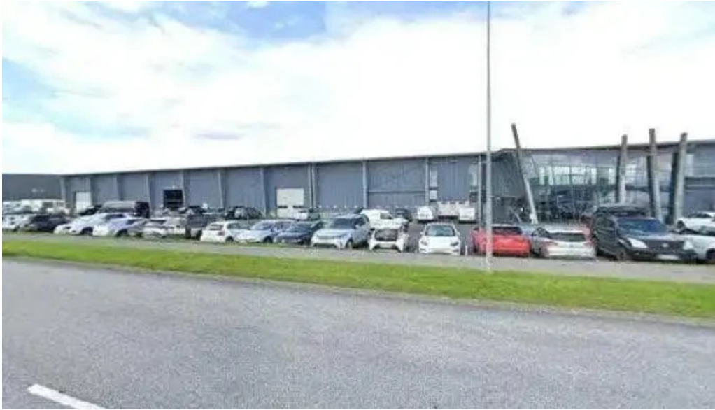
Islenskir fjallaleidsogumenn street view 360deg