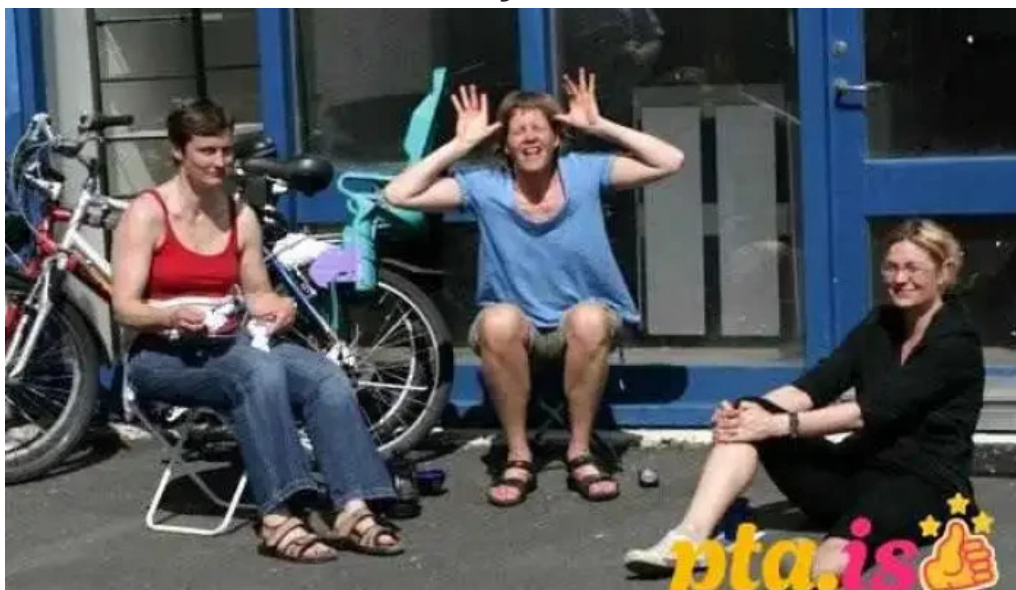
Íslenskir fjallaleiðsögumenn reykjavík