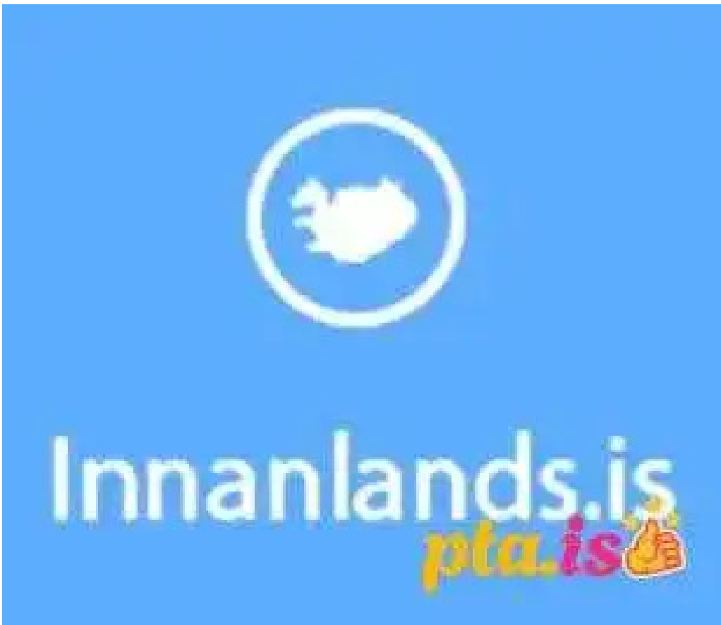
Innanlands fra eiganda