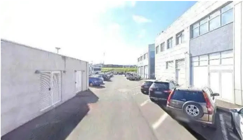
Innanlands street view 360deg