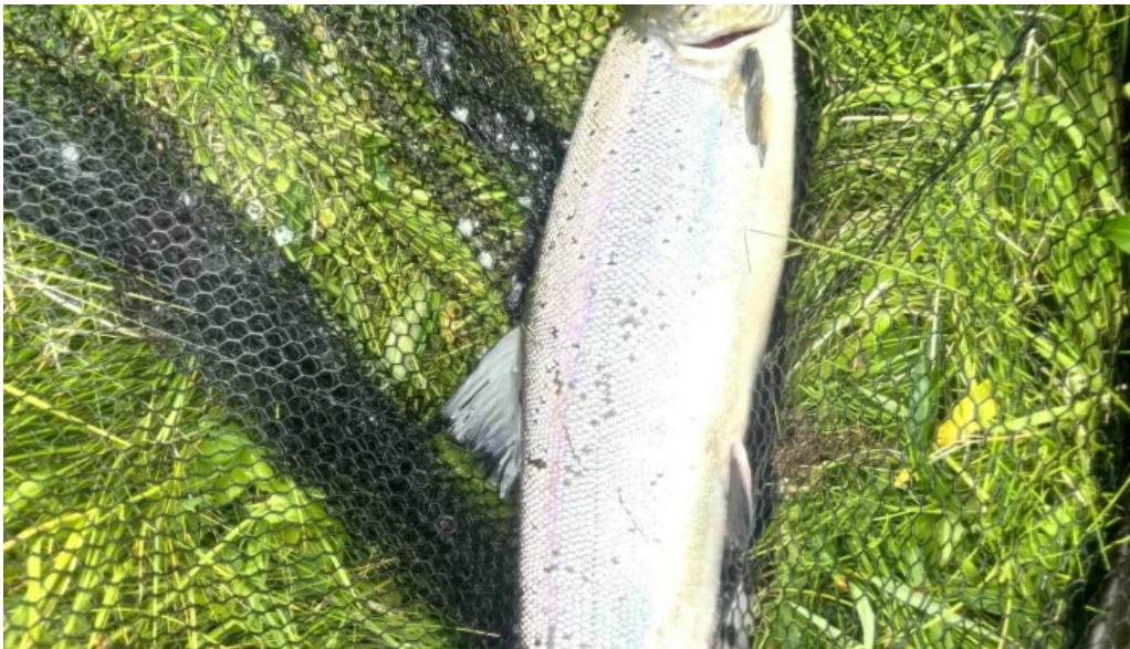
Iceland outfitters simi