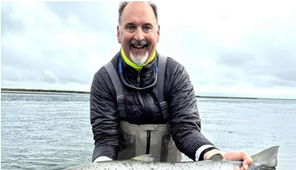
Iceland outfitters vefsiða