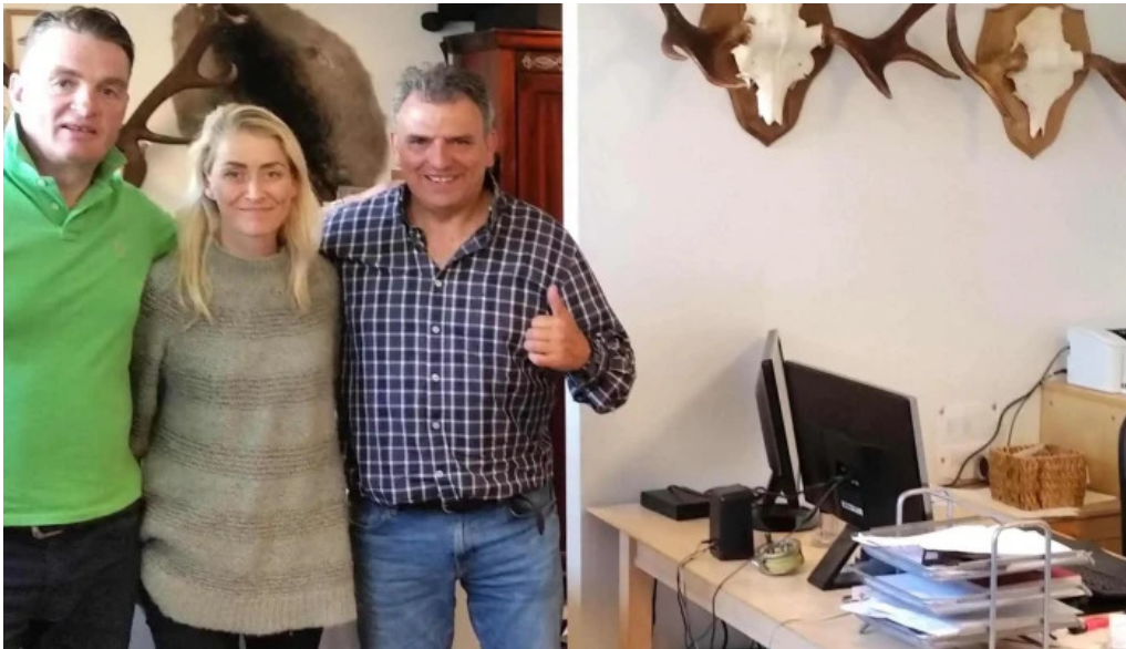
Iceland outfitters verð