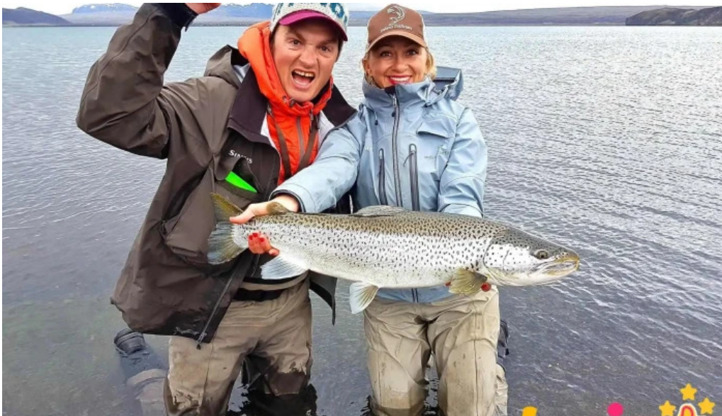
Iceland outfitters fra eiganda