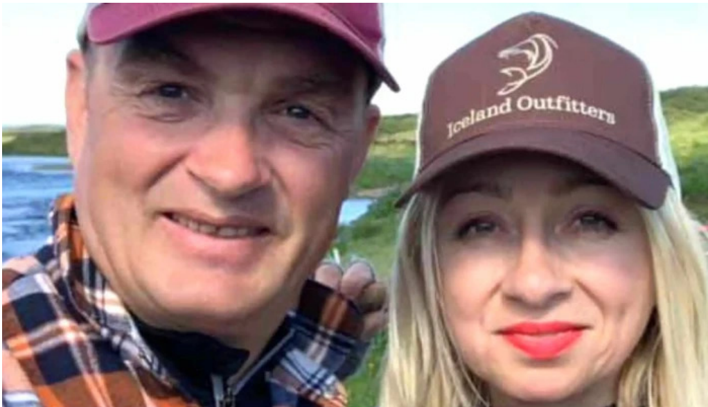
Iceland outfitters myndir