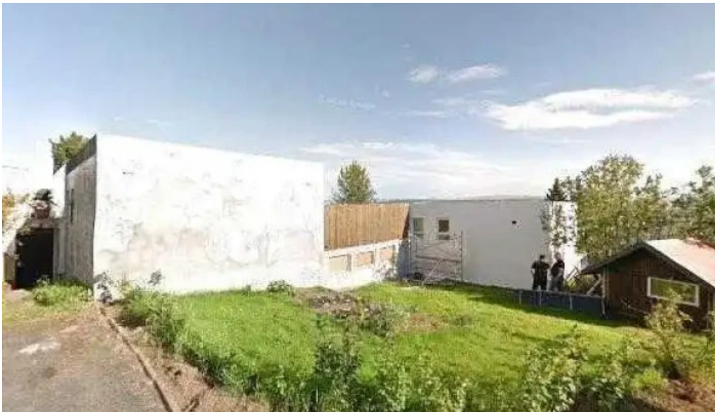
Iceland outfitters street view 360deg