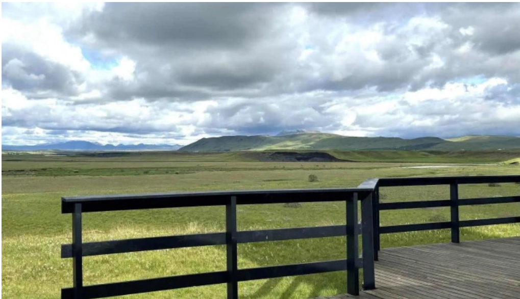
Iceland outfitters heimilisfang