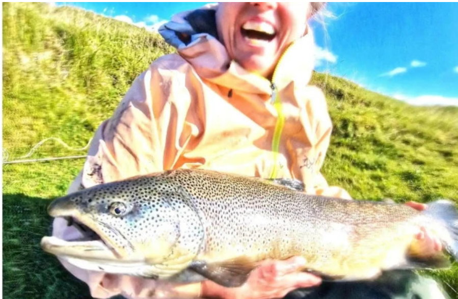
Iceland outfitters hvar