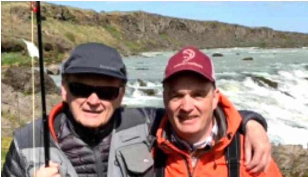
Iceland outfitters athugasemdir