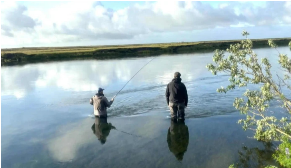
Iceland outfitters kopavogur