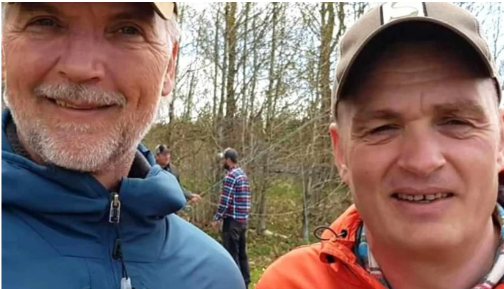
Iceland outfitters staðsetning