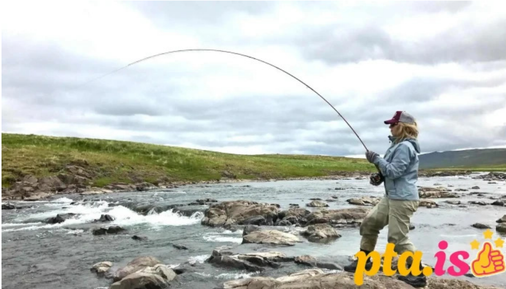
Iceland outfitters ferðaskrifstofa