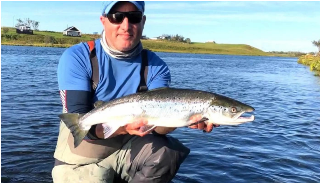
Iceland outfitters numer