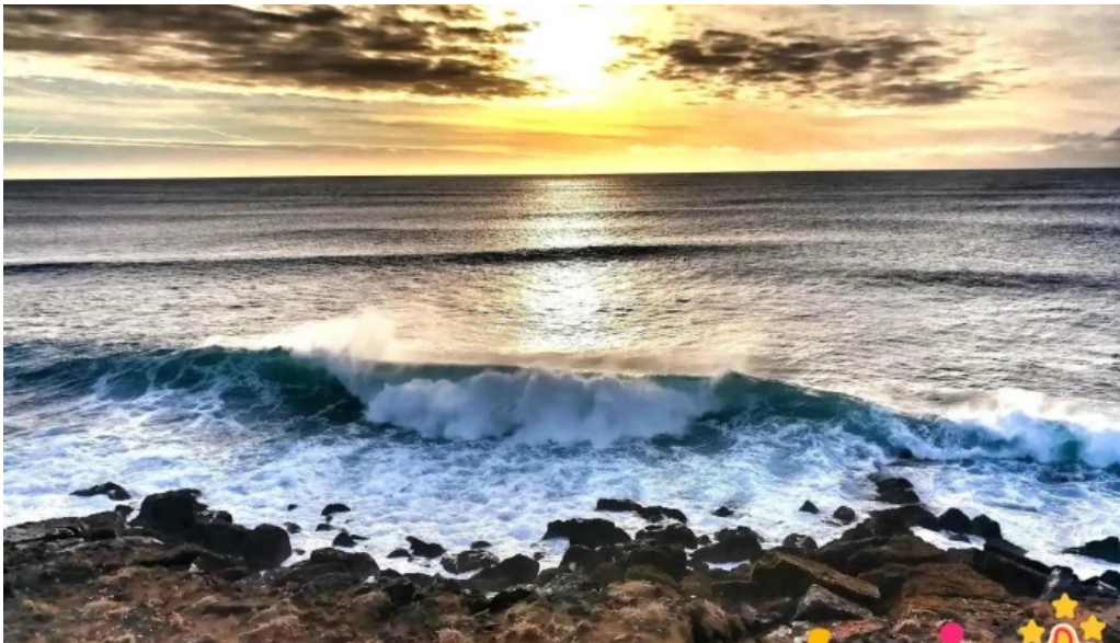
Always iceland ferðaskrifstofa