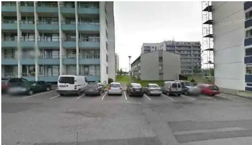
Always iceland street view 360