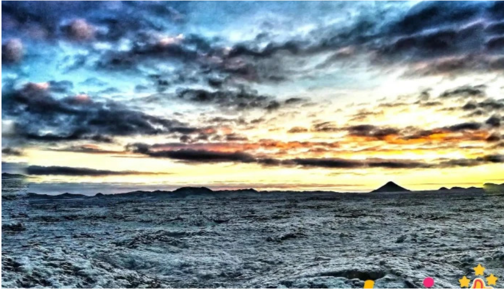
Always iceland fra eiganda