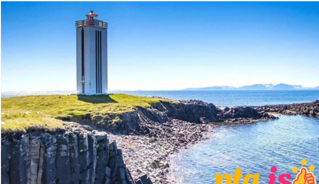
Upplifdu nordurland ferðaskrifstofa