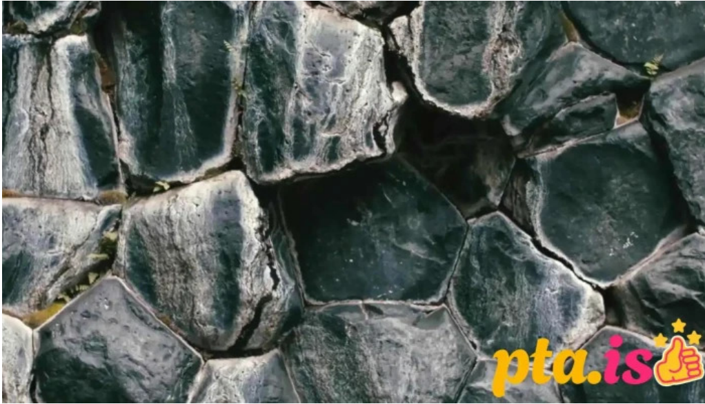
Upplifdu nordurland fra eiganda