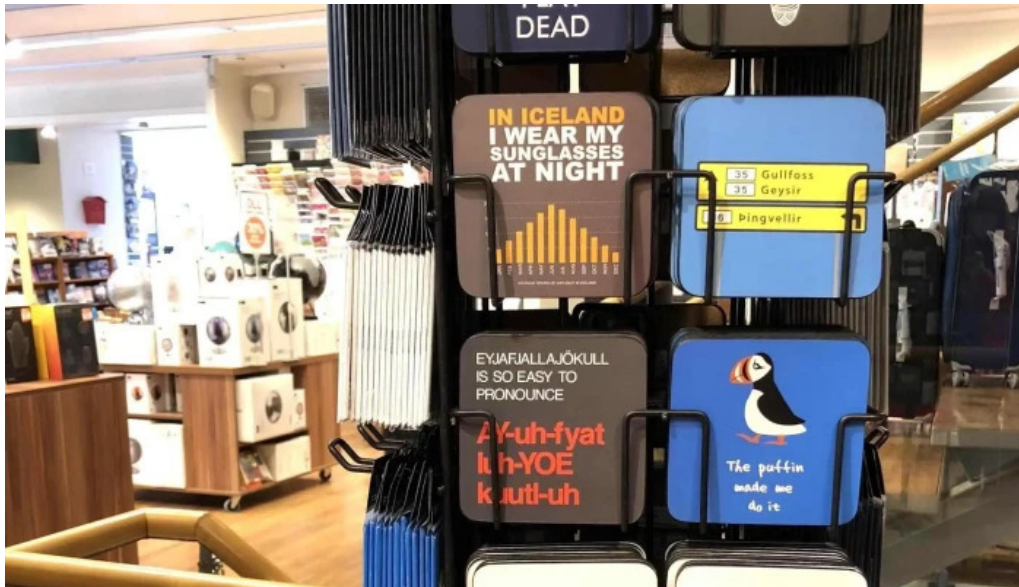
Upplifdu nordurland simi