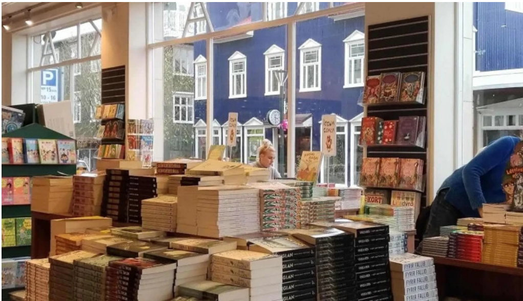
Upplifdu nordurland heimilisfang