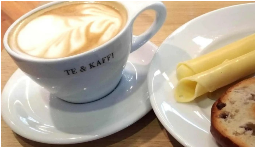
Upplifdu nordurland numer