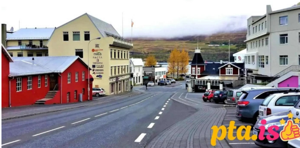
Upplifdu nordurland naerumhverfi