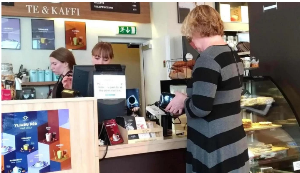
Upplifdu nordurland opið nuna