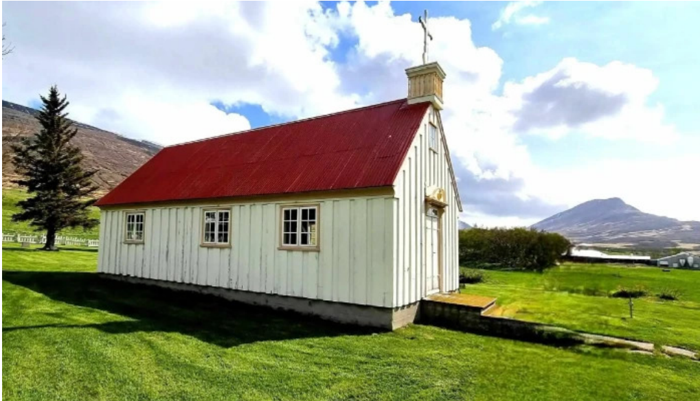
Upplifdu nordurland akureyri