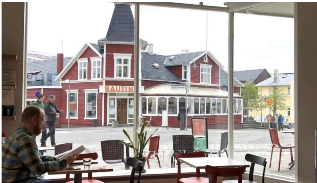
Upplifdu nordurland nalægt mer