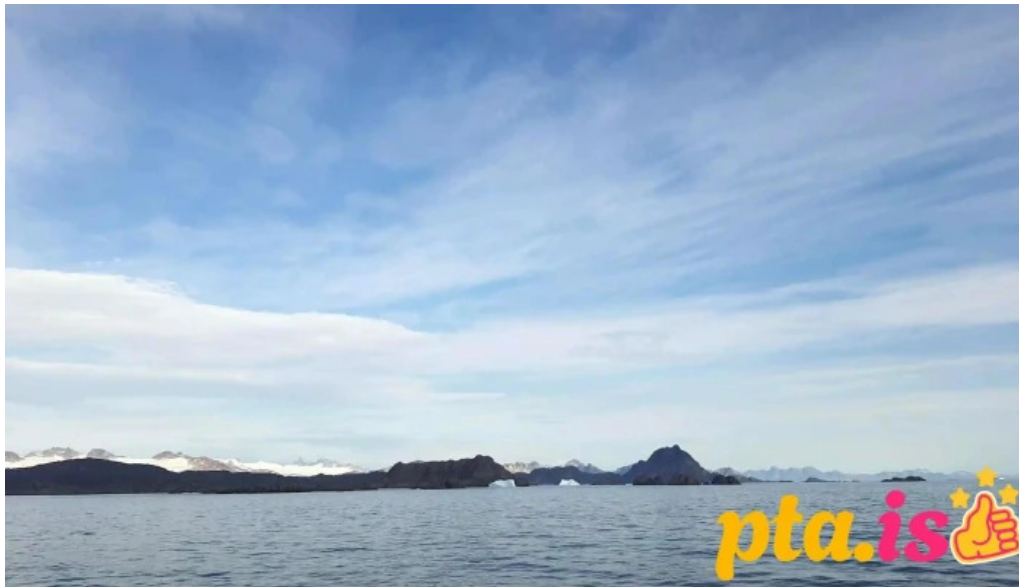
Upplifdu nordurland myndskaid