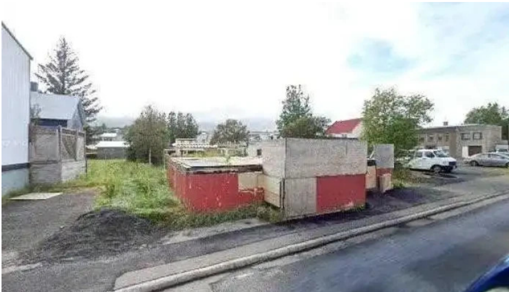
Upplifdu nordurland street view 360deg