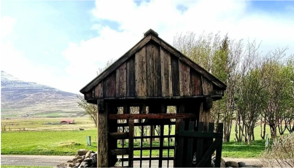
Upplifdu nordurland myndbond