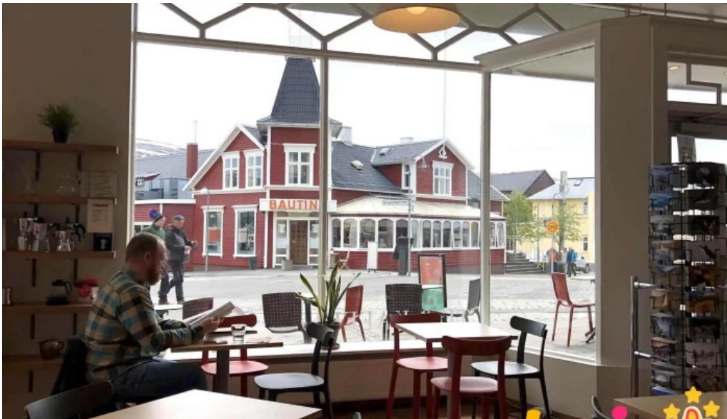
Upplifdu nordurland ad innan