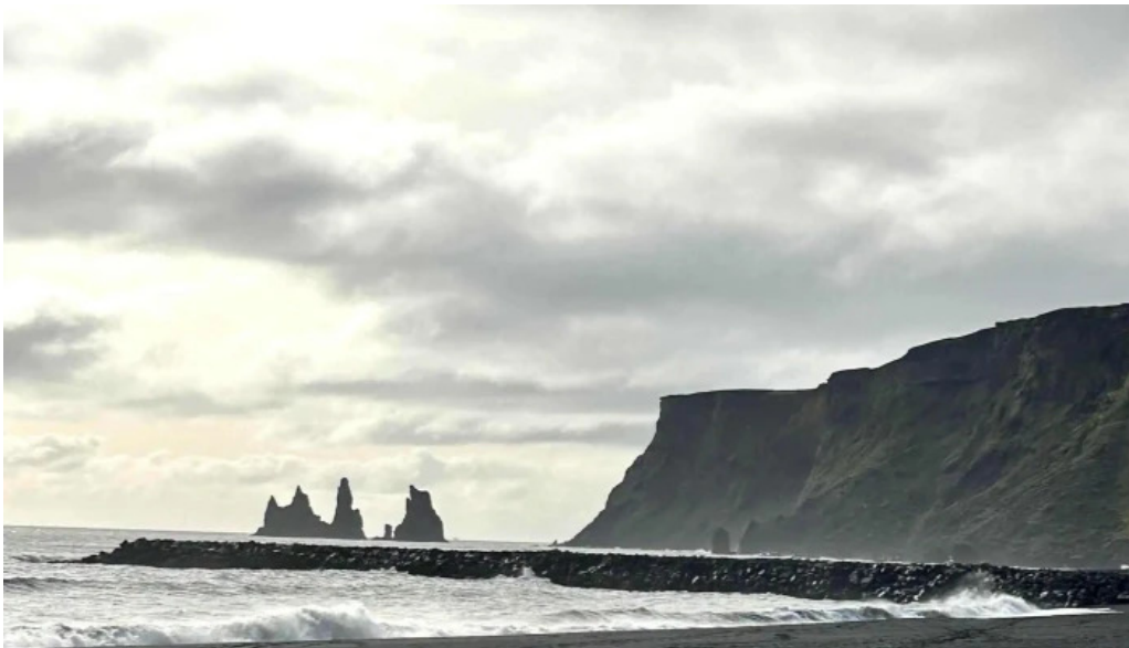
Reykjavik excursions by icelandia aetlun