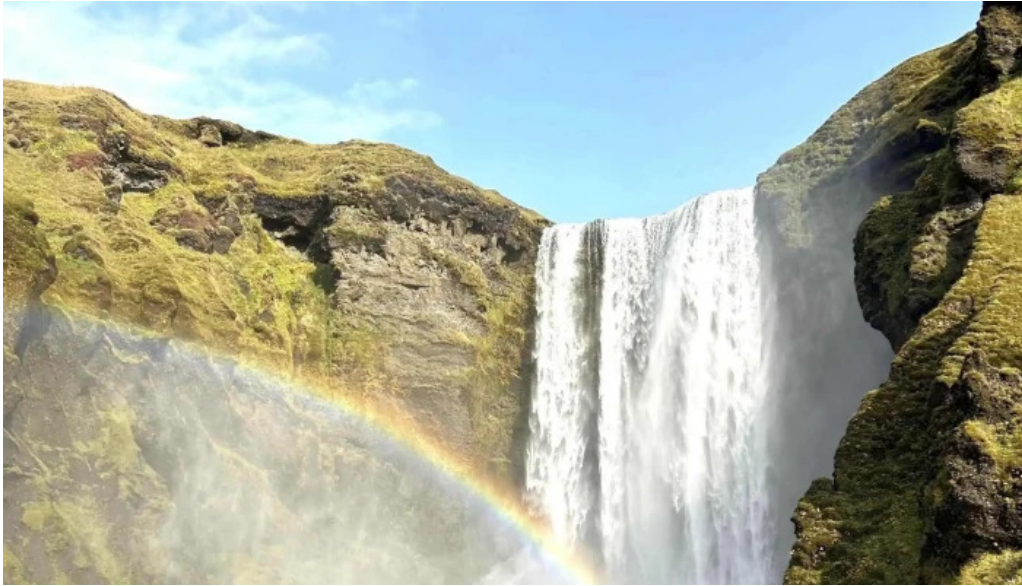
Reykjavik excursions by icelandia reykjavik