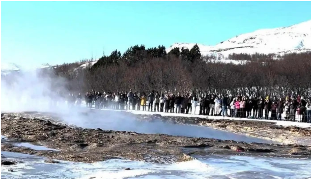
Reykjavik excursions by icelandia myndskeld