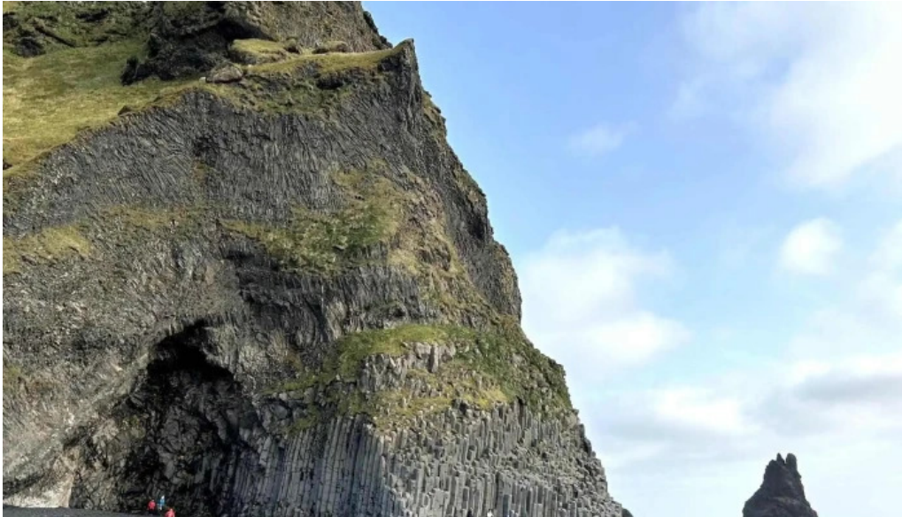
Reykjavik excursions by icelandia vefsiða