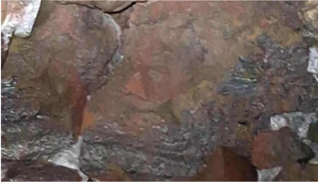
Reykjavik excursions by icelandia einkunn