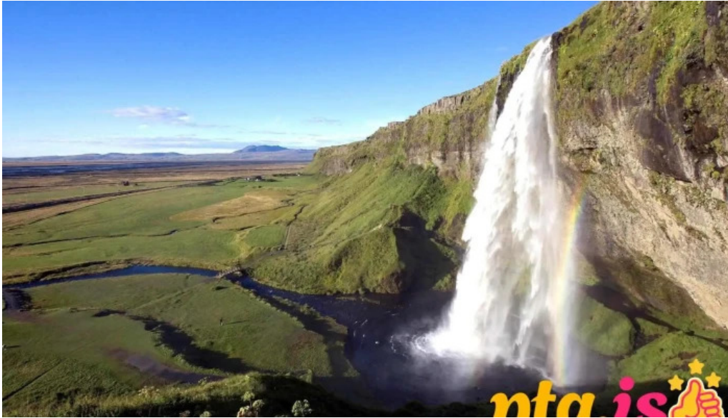
Reykjavik excursions by icelandia fra eiganda