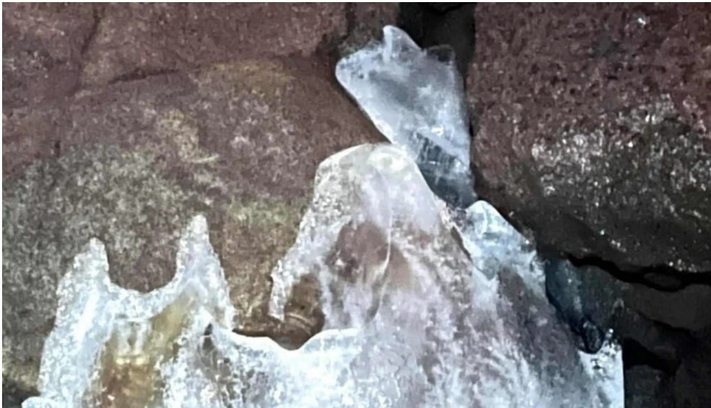
Reykjavik excursions by icelandia verð