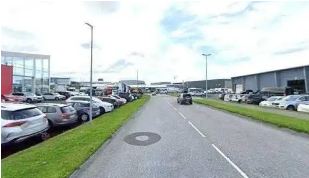
Reykjavik excursions by icelandia street view 360deg