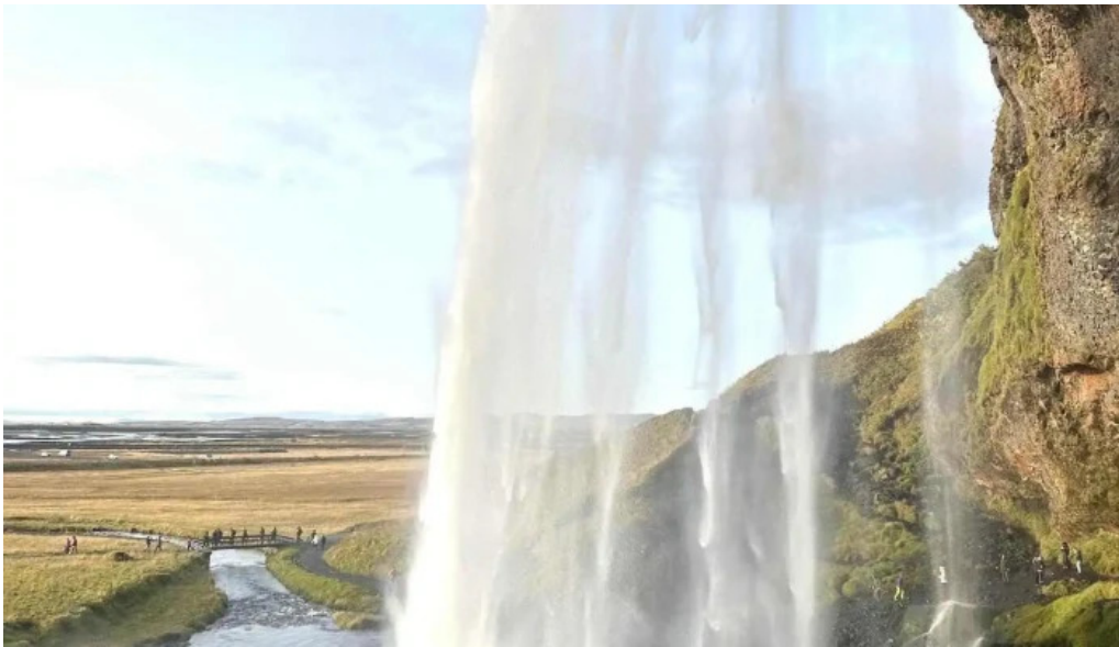
Reykjavik excursions by icelandia ferðaskrifstofa með skoðunarferðir