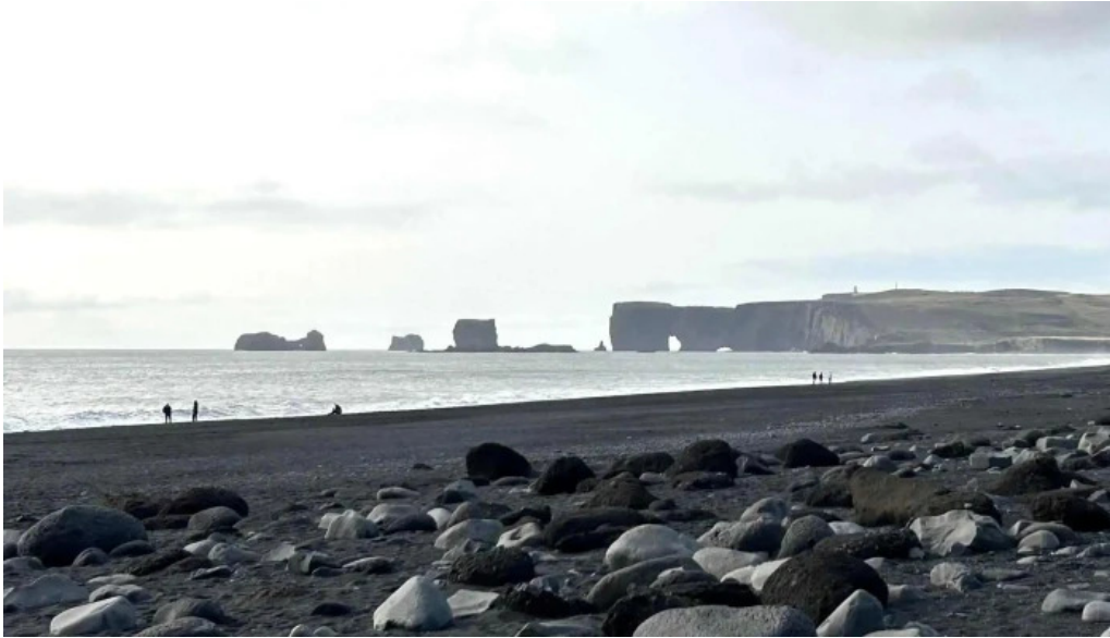
Reykjavik excursions by icelandia myndir