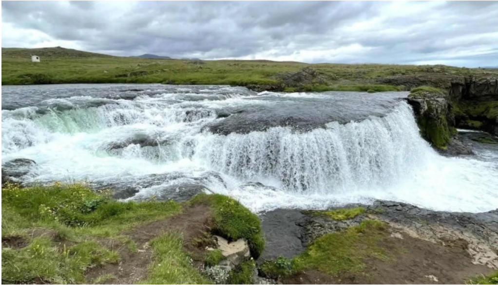
Fosslaug nálægt mer