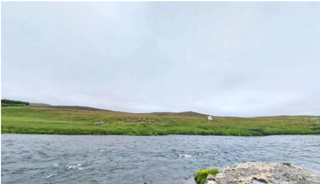
Fosslaug street view 360deg