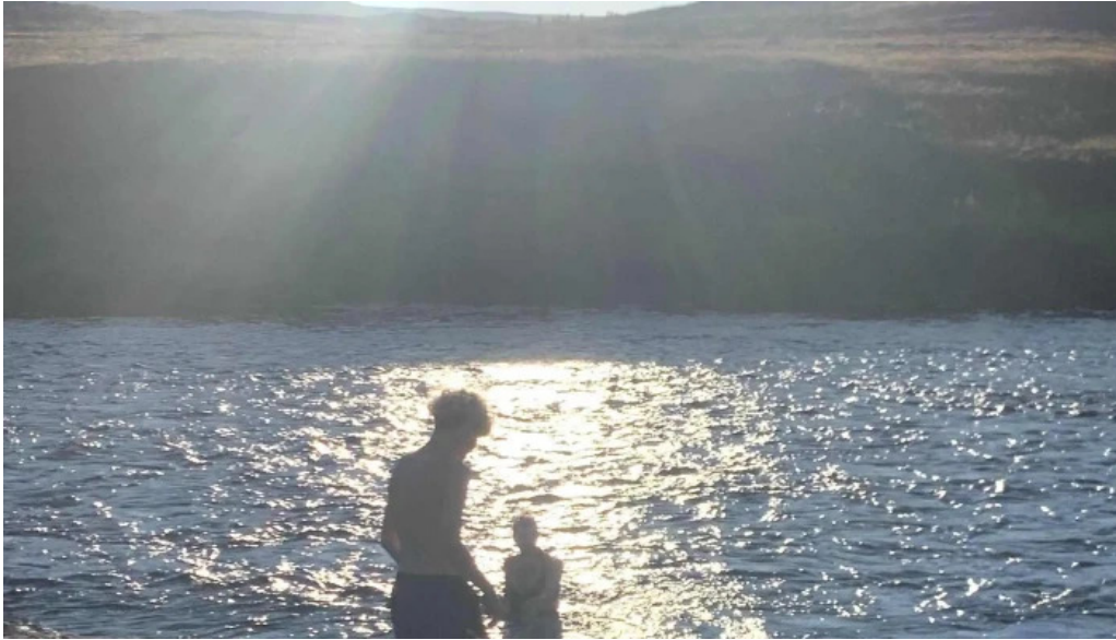
Fosslaug opið nuna