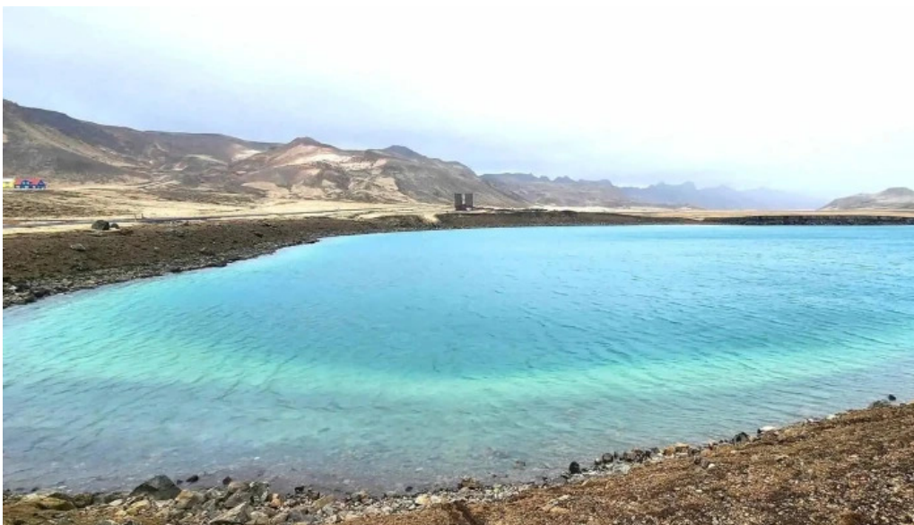
Gigvatnsvatn green lakegraenesvatn vacio