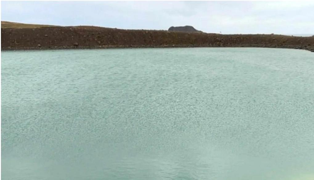
Gigvatnsvatn green lakegraenesvatn numer