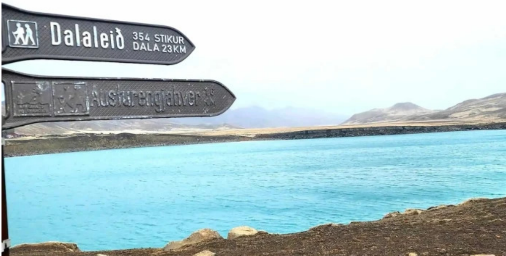
Gigvatnsvatn green lakegraenesvatn hvar