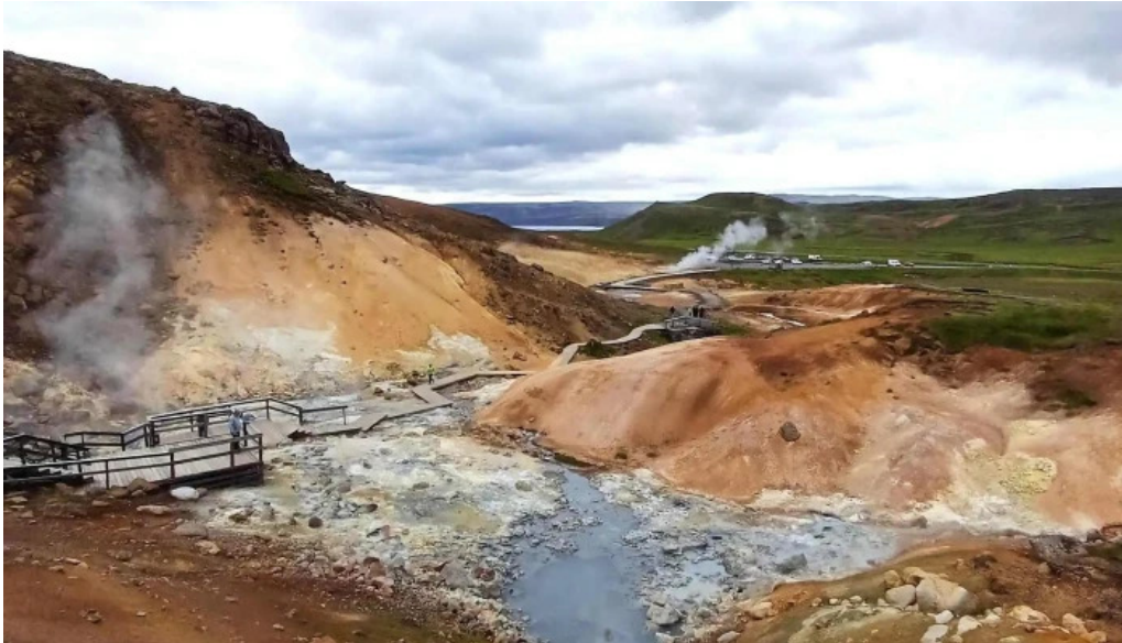
Gigvatnsvatn green lakegraenesvatn krysvik