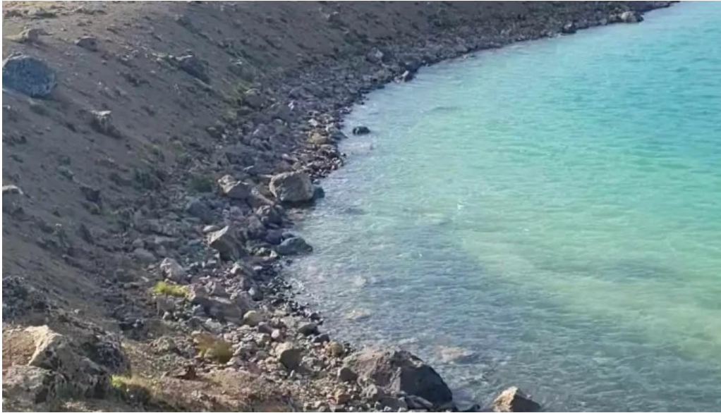
Gigvatnsvatn green lakegraenesvatn fjall