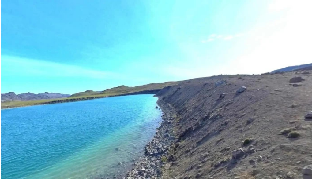
Gigvatnsvatn green lakegraenesvatn street view 360deg