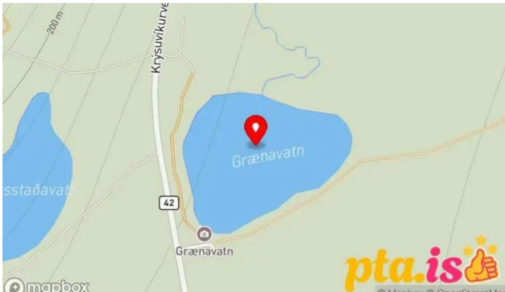
Gigvatnsvatn green lakegrænesvatn Kort