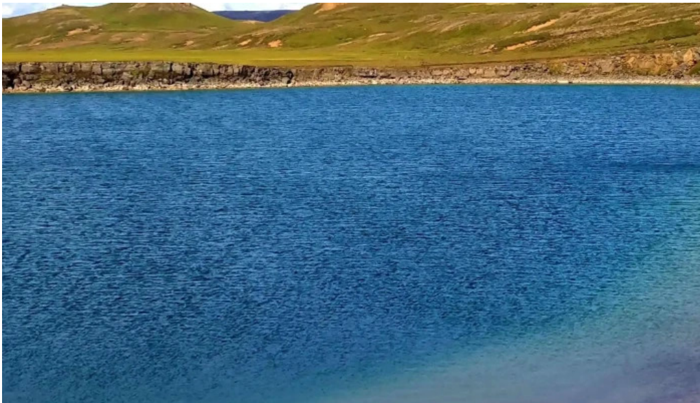
Gigvatnsvatn green lakegrænesvatn athugasemdir