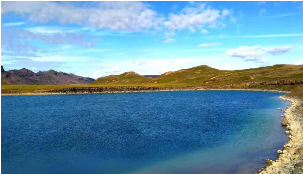
Gigvatnsvatn green lakegraenesvatn myndbond