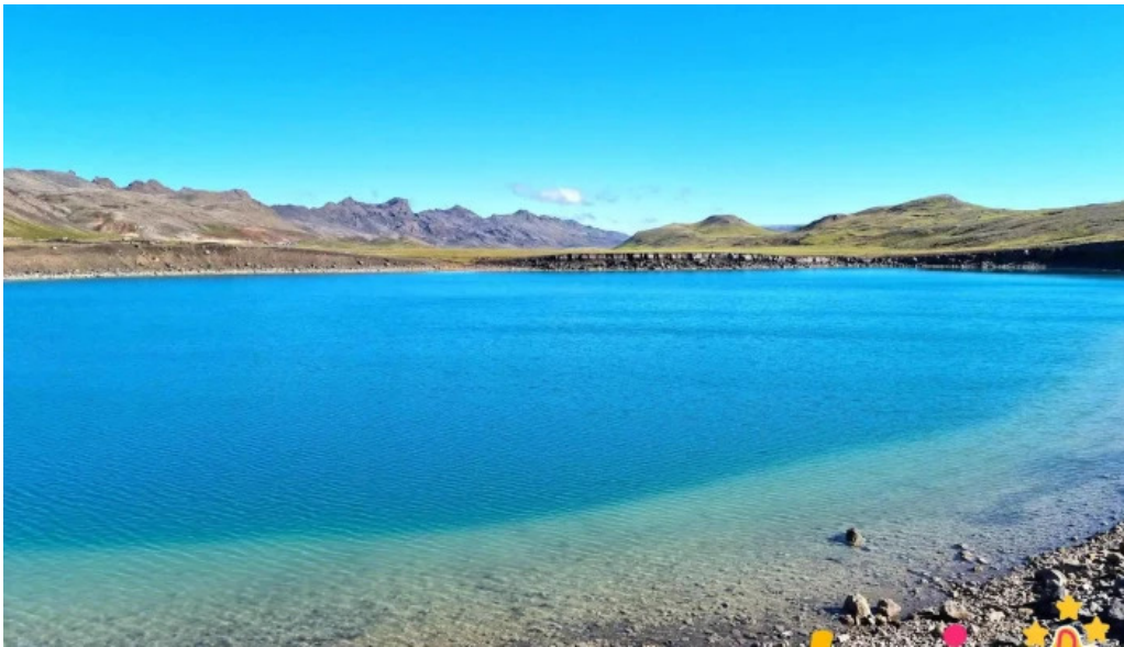
Gigvatnsvatn green lakegraenesvatn ferðamannastaður