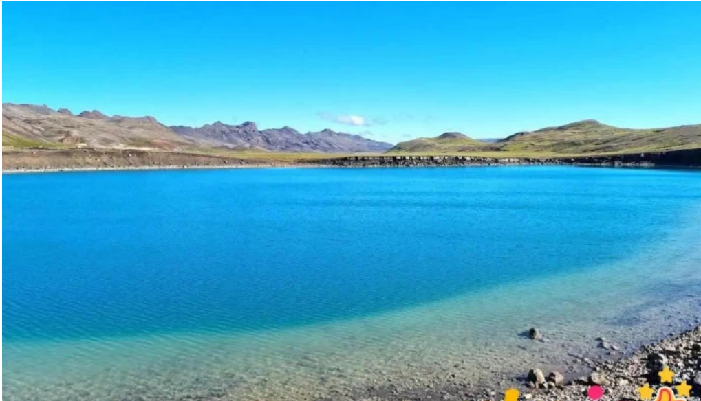
Gigvatnsvatn green lake graenesvatn vacio