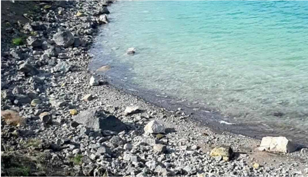
Gigvatnsvatn green lakegraenesvatn myndskleid