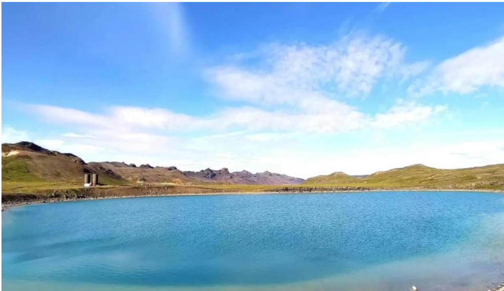
Gigvatnsvatn green lakegraenesvatn vefsíða