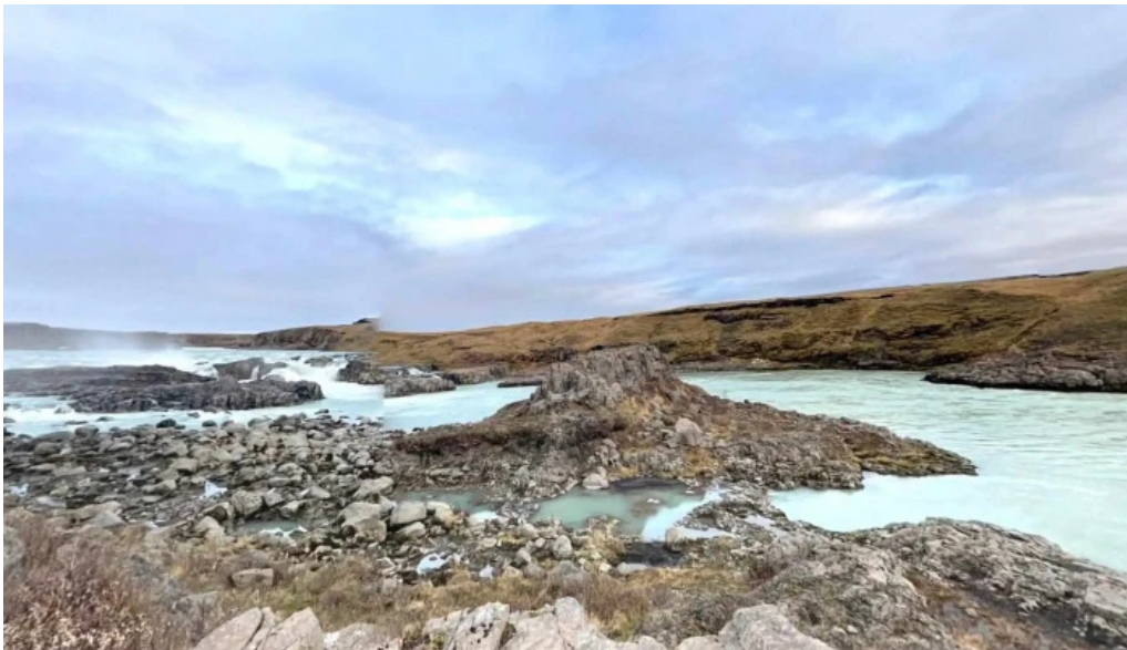
Urridafoss street view 360deg