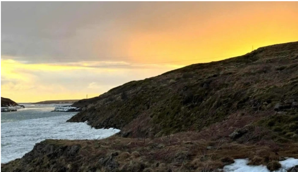
Urridafoss nálægt mer