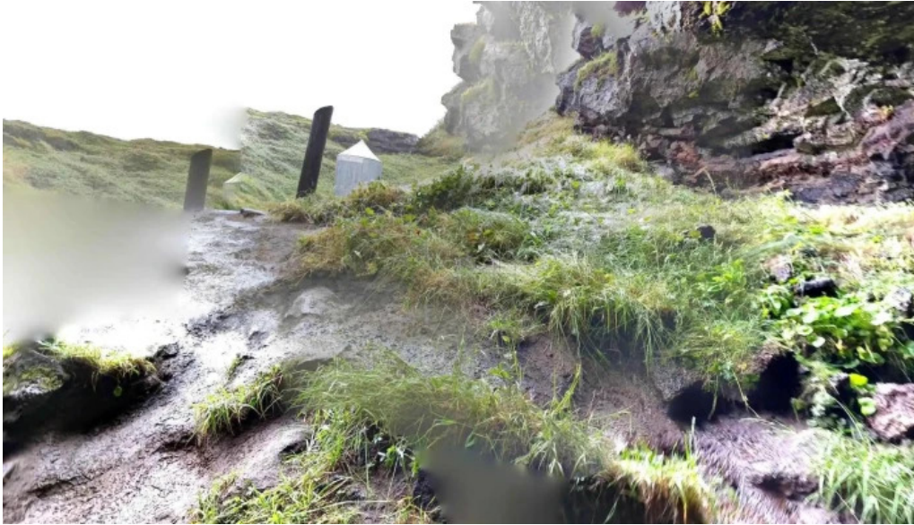
Vatnshellir street view 360deg