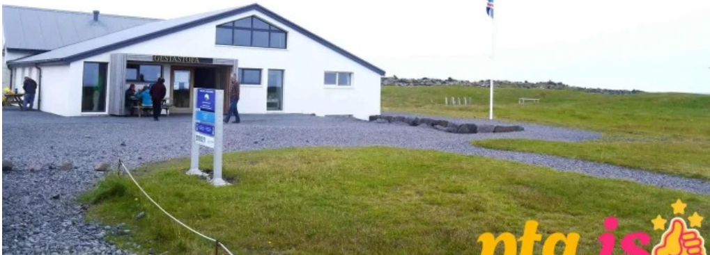
Vatnshellir gestastofan a malarrifi