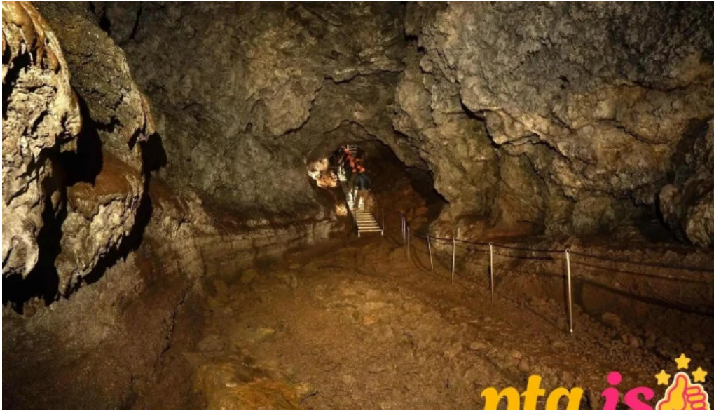
Vatnshellir fra eiganda