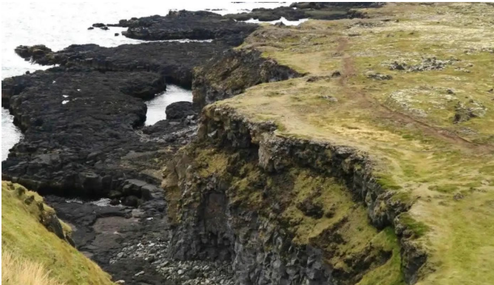
Vatnshellir londrangar utsynisstadur