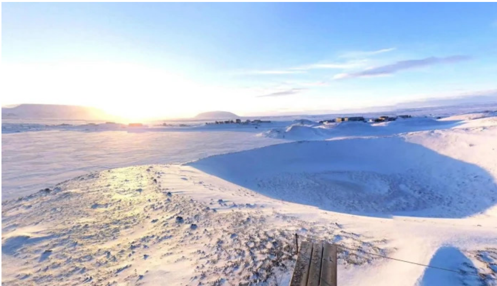
Skutustadagigar street view 360deg