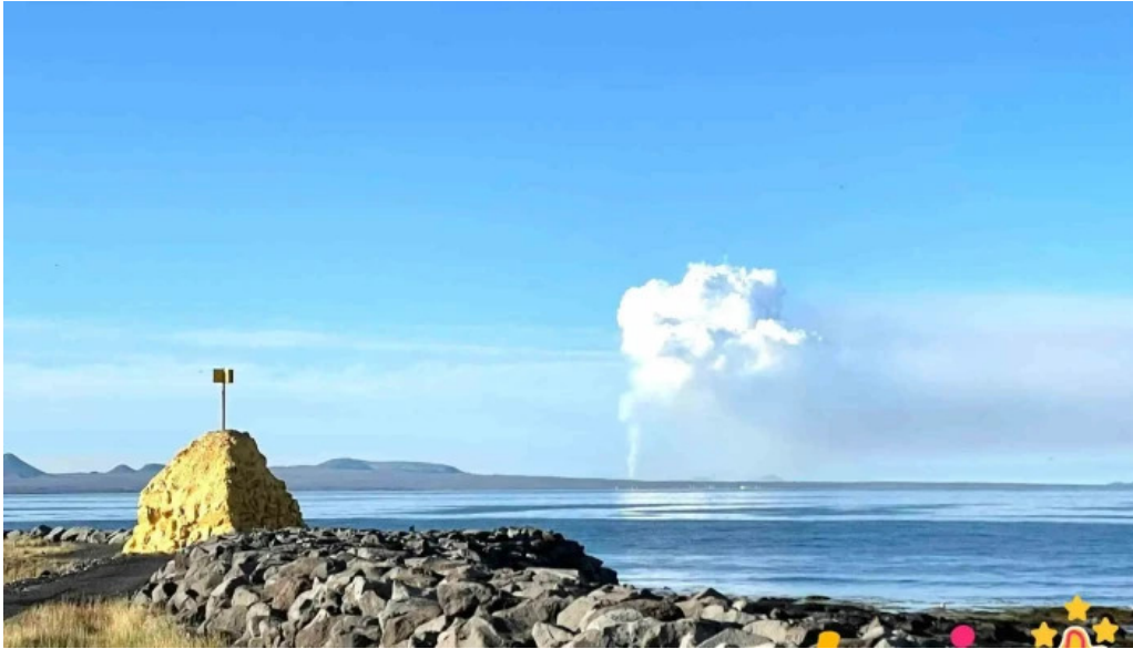
Sudurnesvarda fra eiganda