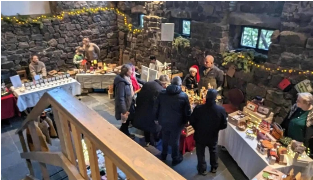
Ellidavatnsbaer nálægt mer