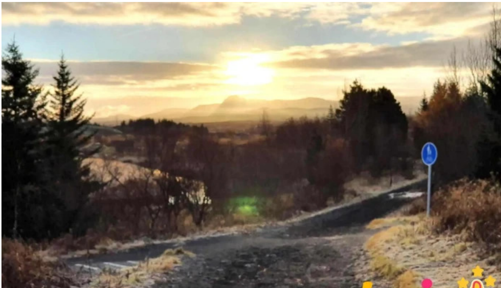
Ellidavatnsbaer fra eiganda