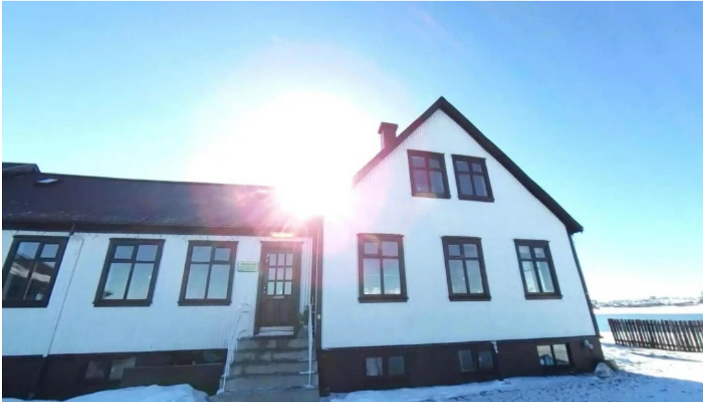
Ellidavatnsbaer street view 360deg