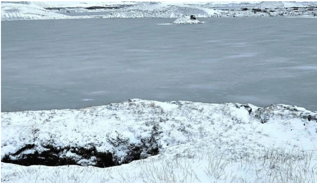
Skutustadagrig pseudo craters safn