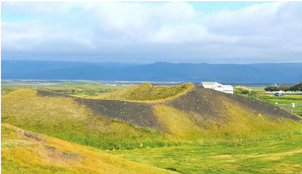
Skutustadagrig pseudo craters hvernig a að komast þangað