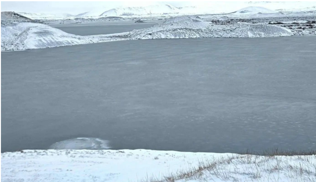
Skutustadagrig pseudo craters nálægt mer