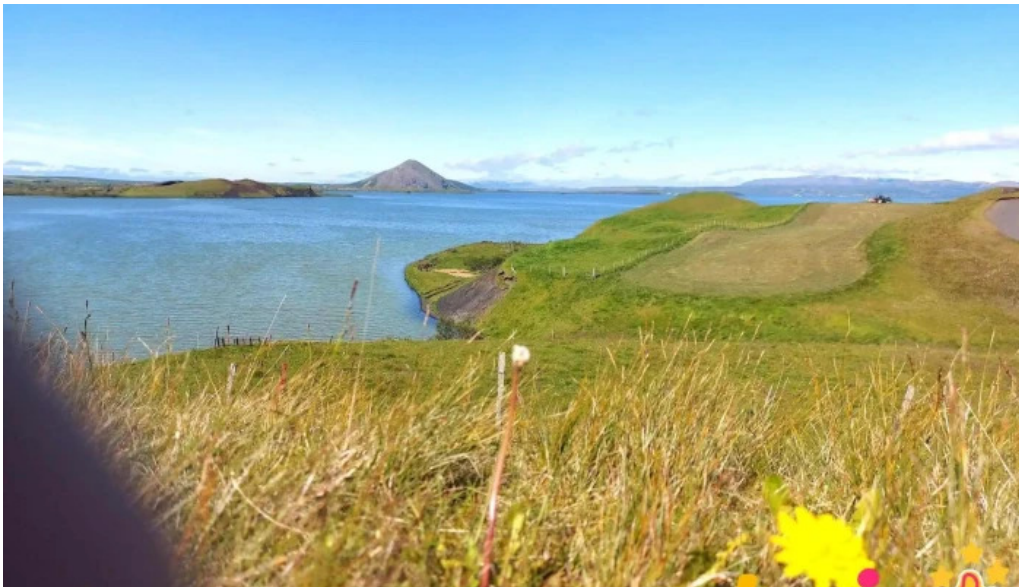
Skutustadagrig pseudo craters ferðamannastaður