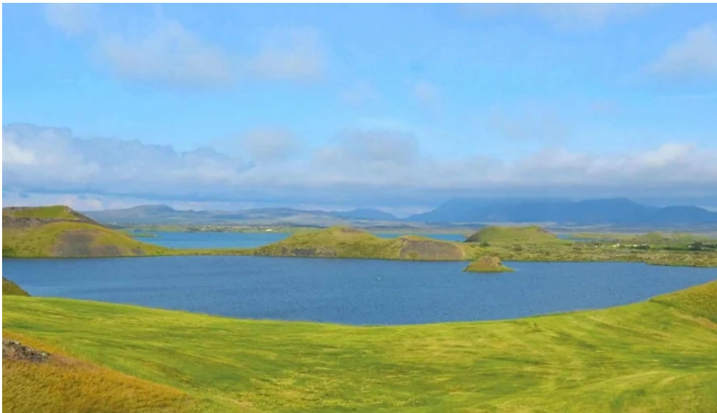
Skutustadagrig pseudo craters myndir