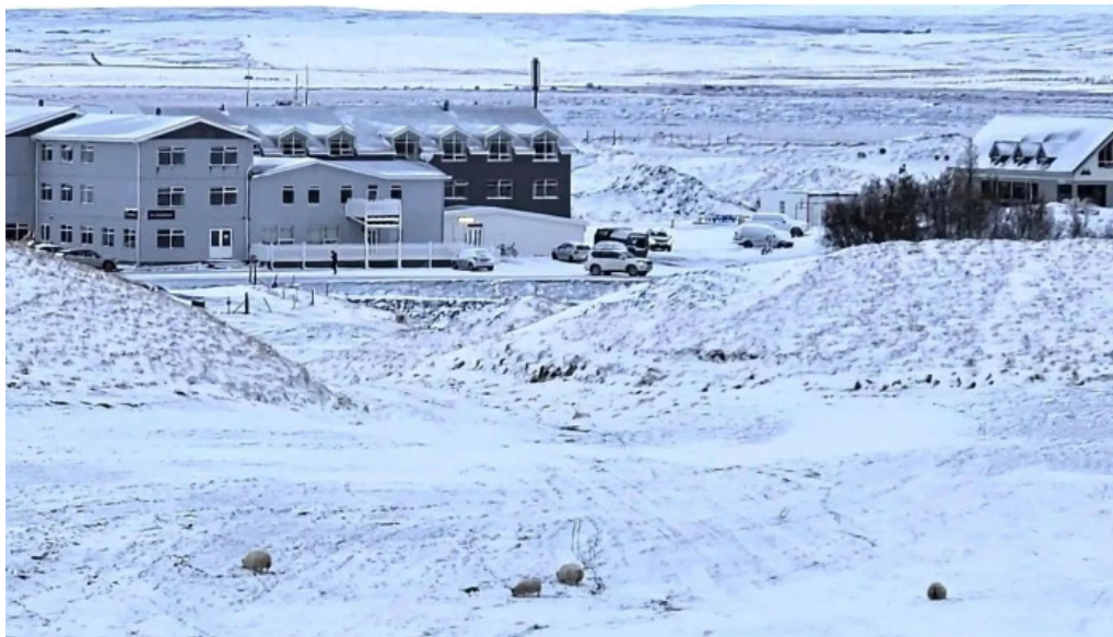
Skutustadagrig pseudo craters vefsíða