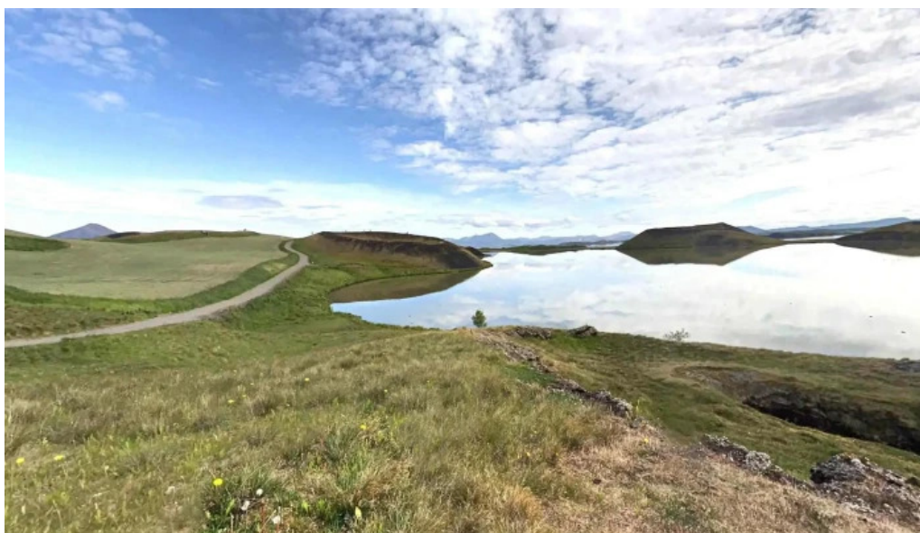
Skutustadagrig pseudo craters street view 360deg