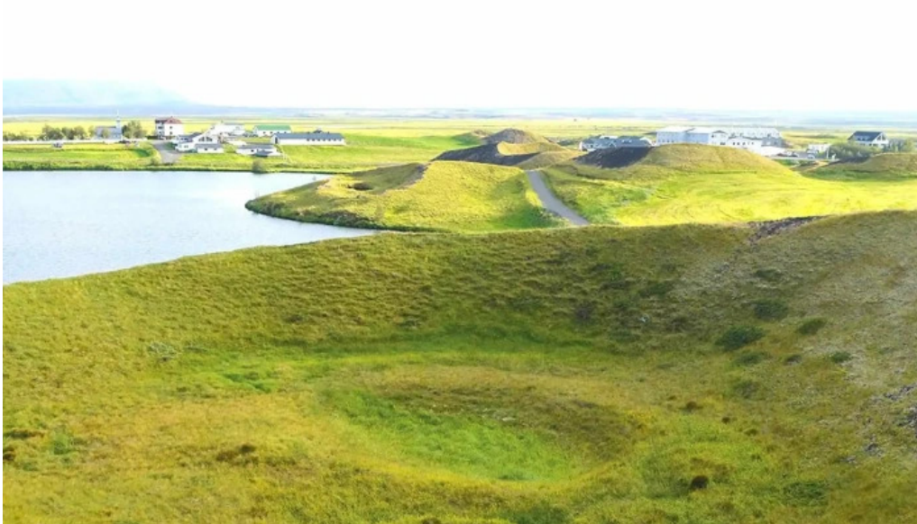
Skutustadagrig pseudo craters reykjahlið