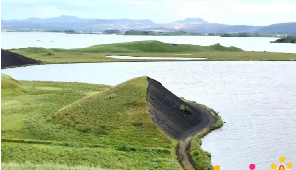
Skutustadagrig pseudo craters fjall