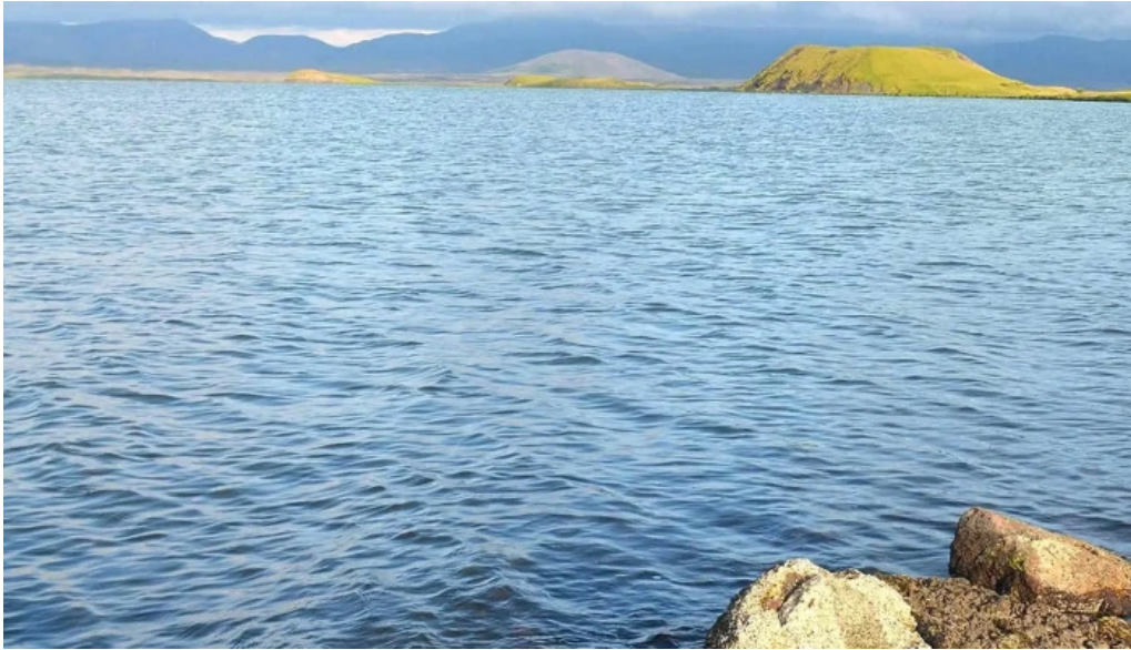
Skutustadagrig pseudo craters myndbond