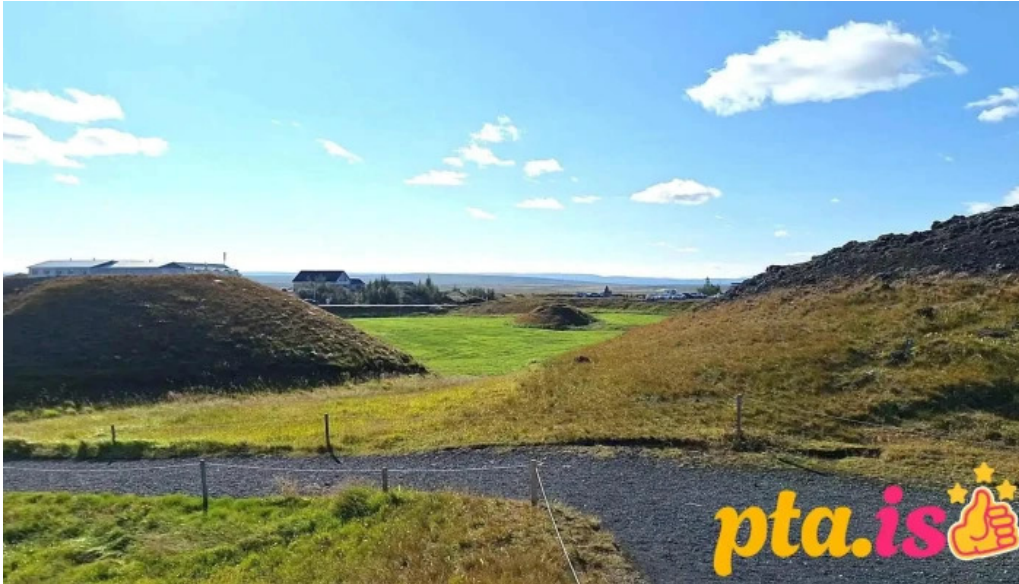
Skutustadagrig pseudo craters myndskaid