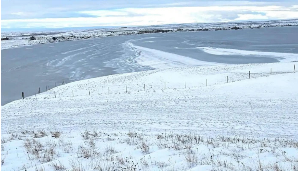
Skutustadagrig pseudo craters staðsetning