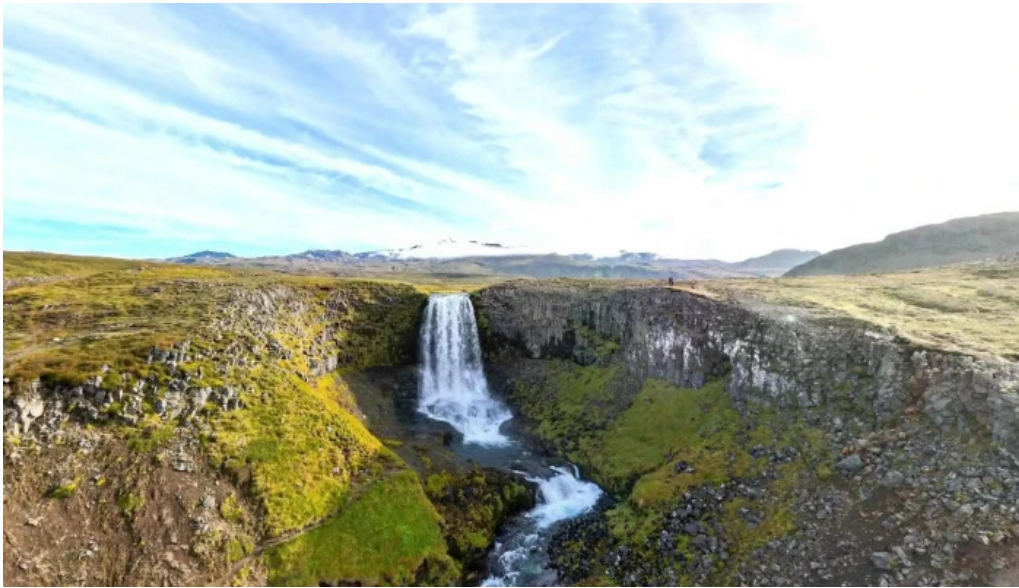
Svodufoss street view 360deg