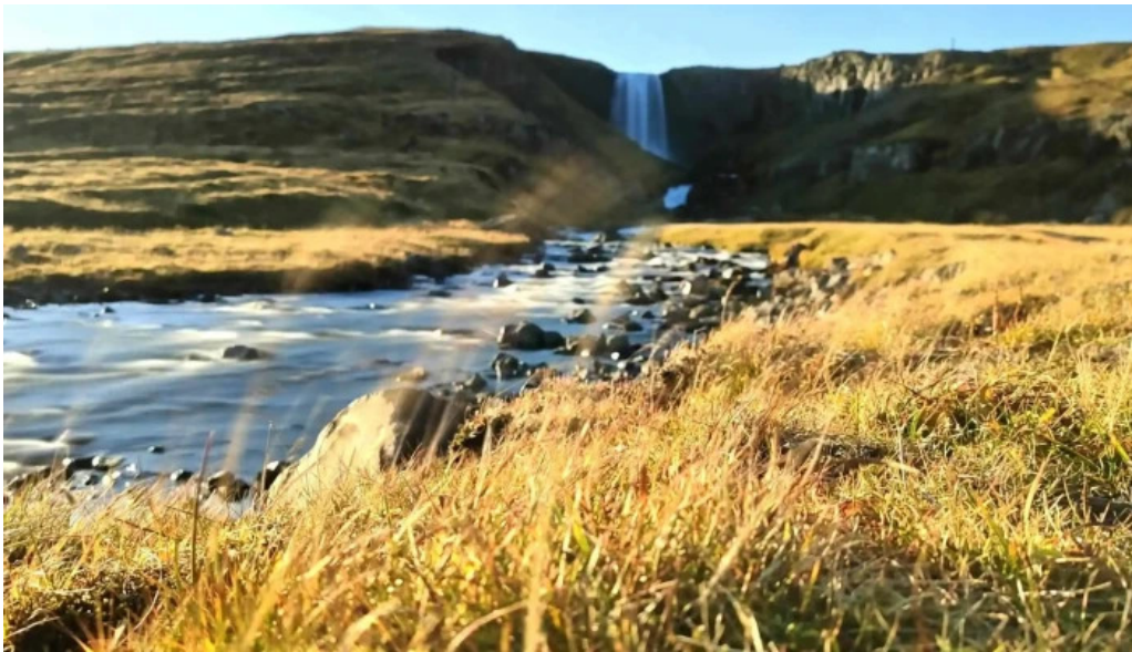
Svodefoss opið nuna