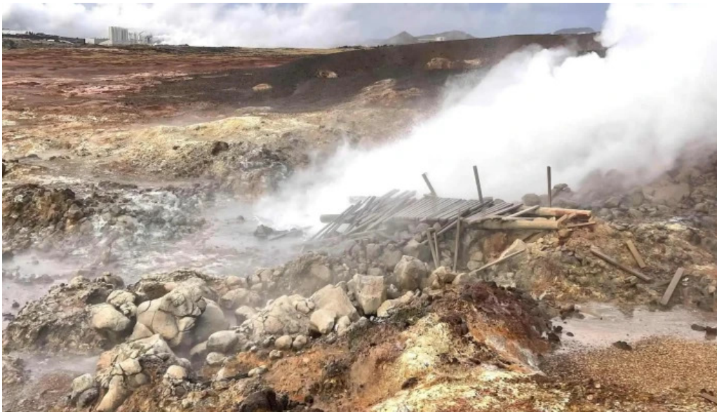
Gunnhver nálægt mer