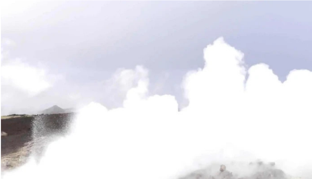
Gunnhver moðruvellir moðruvallavegur 4