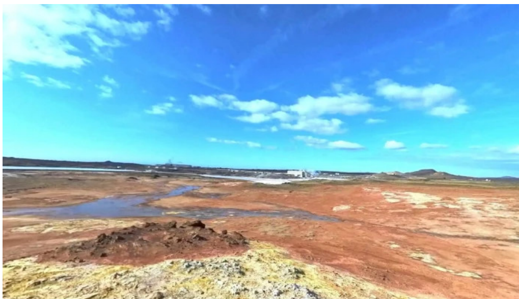
Gunnhver street view 360deg