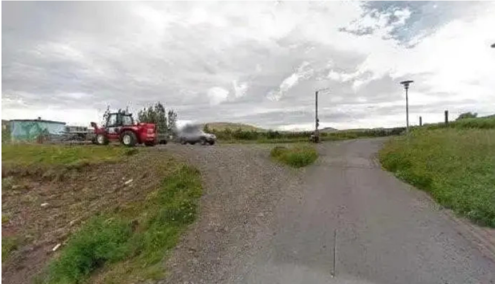
Alafoss street view 360