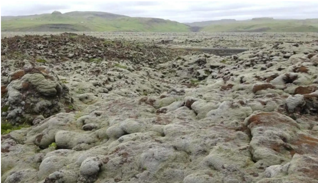
Skaftareldahraun nalægt mer