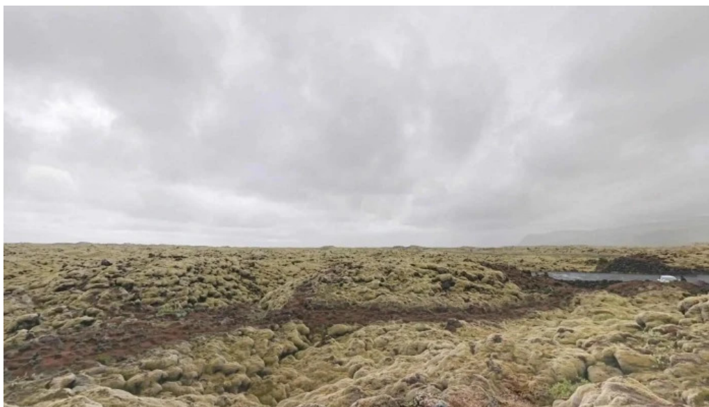
Skaftareldahraun street view 360deg