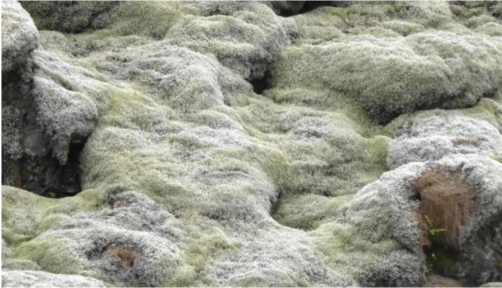
Skaftareldahraun hvernig a að komast þangað