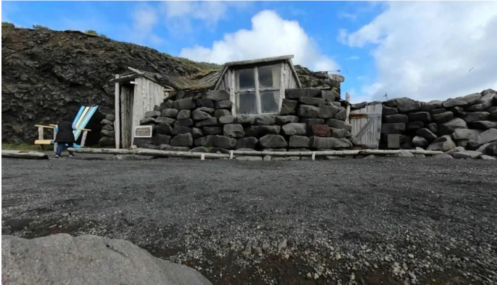
Skessuhellir street view 360deg