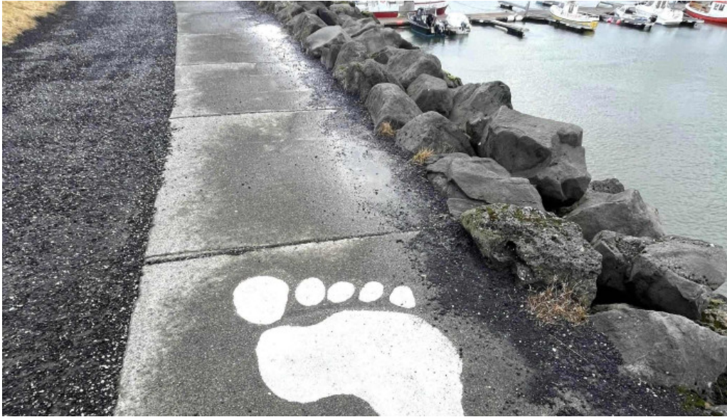
Skessuhellir nálægt mer