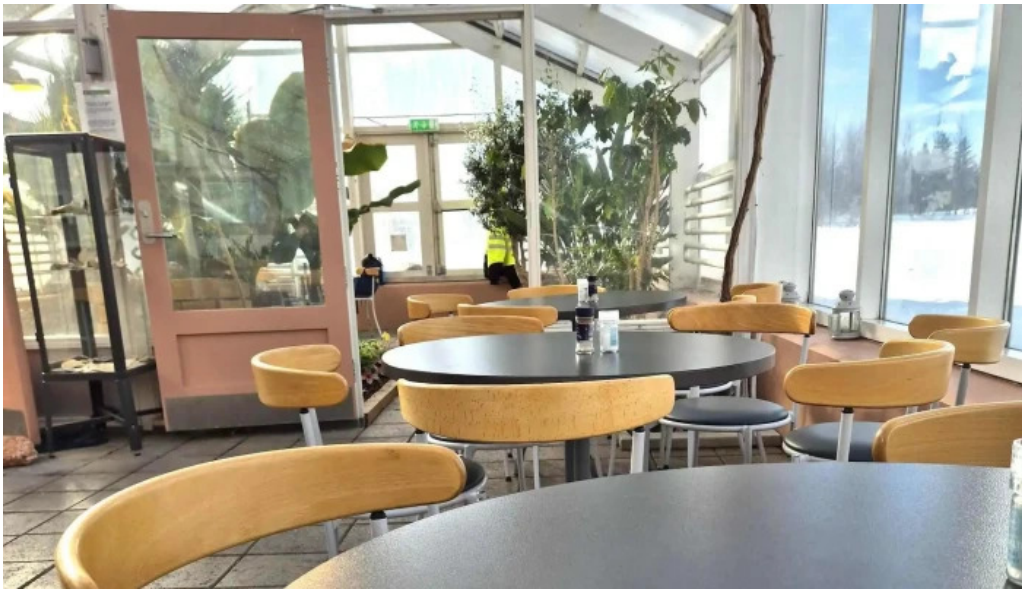
Hveragardurinn i hveragerdi safn