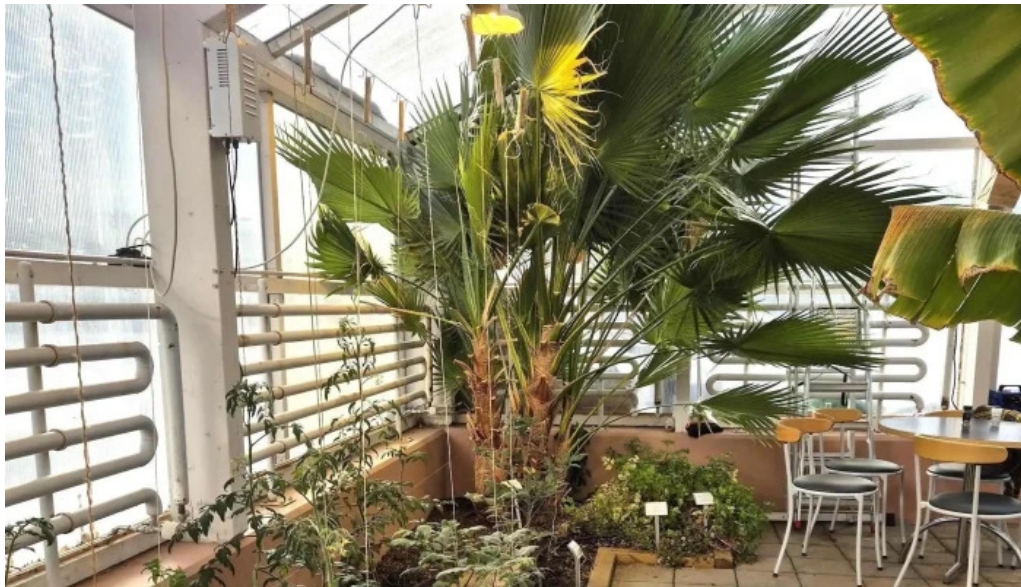
Hveragardurinn i hveragerdi hveragerði