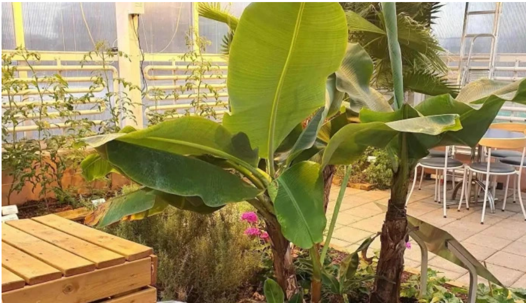
Hveragardurinn i hveragerdi nyjast