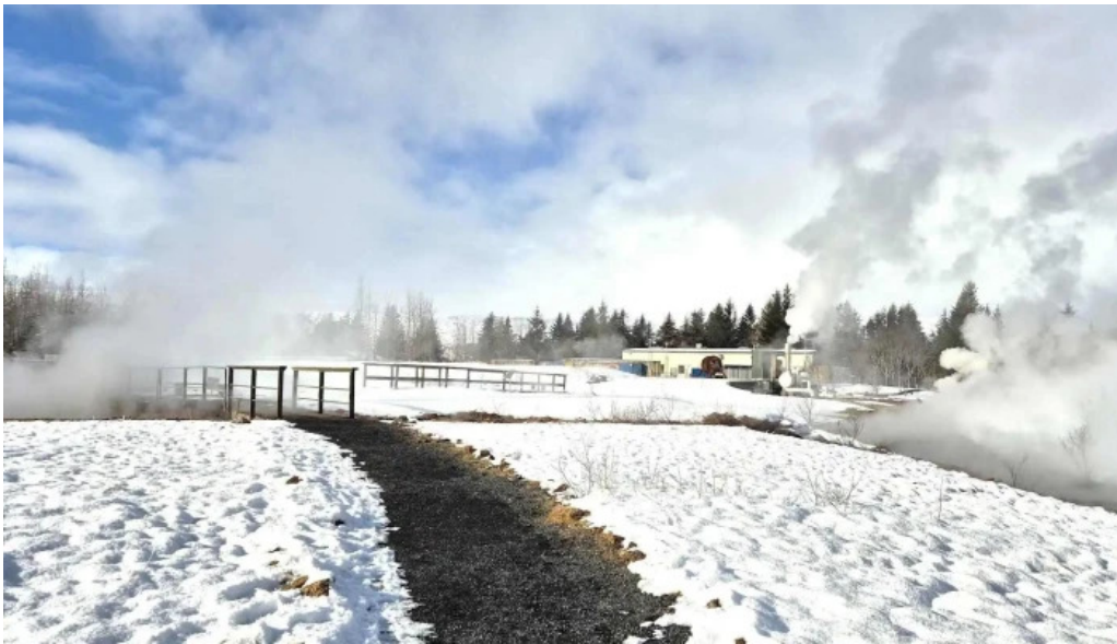
Hveragardurinn i hveragerdi hvernig a að komast þangað