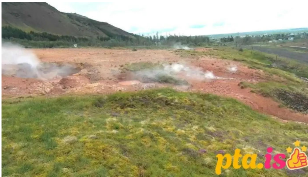
Hveragardurinn i hveragerdi fjall