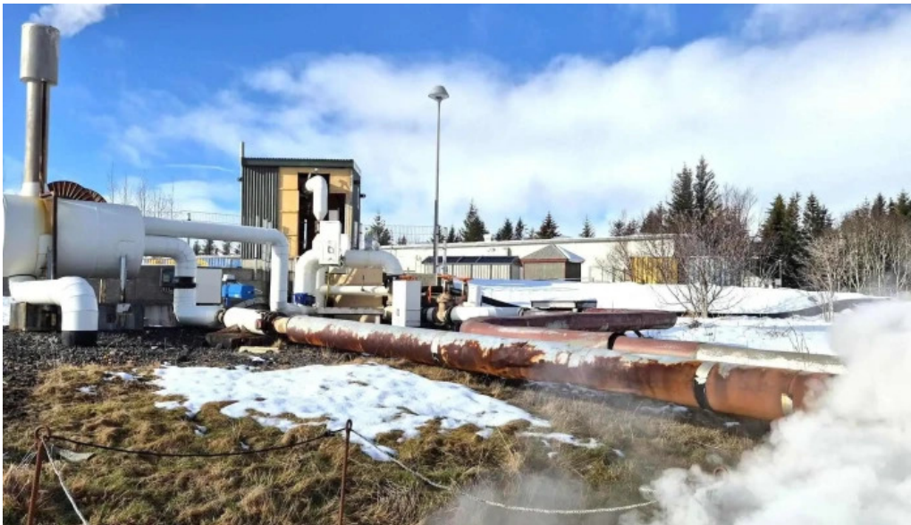
Hveragardurinn i hveragerdi ætlun