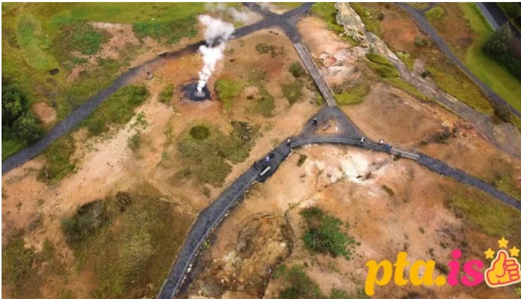
Hveragarðurinn í hveragerði hveragerði