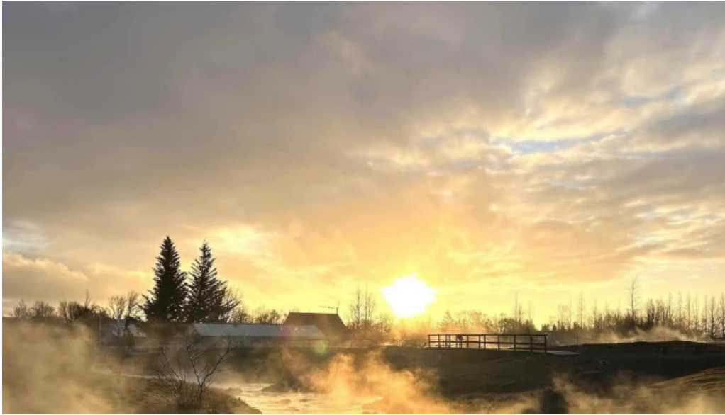
Hveragardurinn i hveragerdi opið nuna