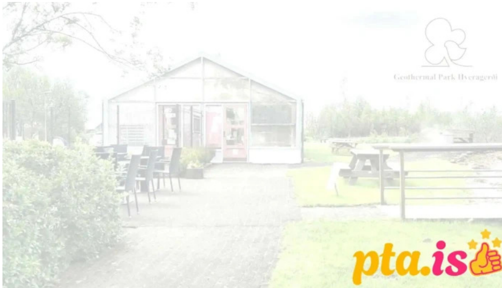
Hveragardurinn i hveragerdi