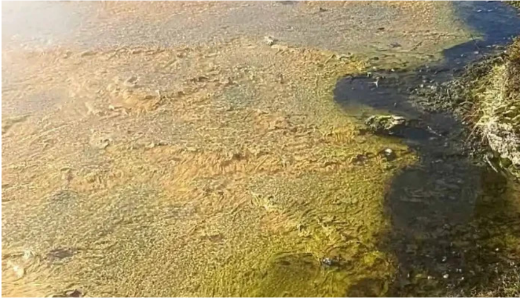
Hveragardurinn i hveragerdi myndскеid