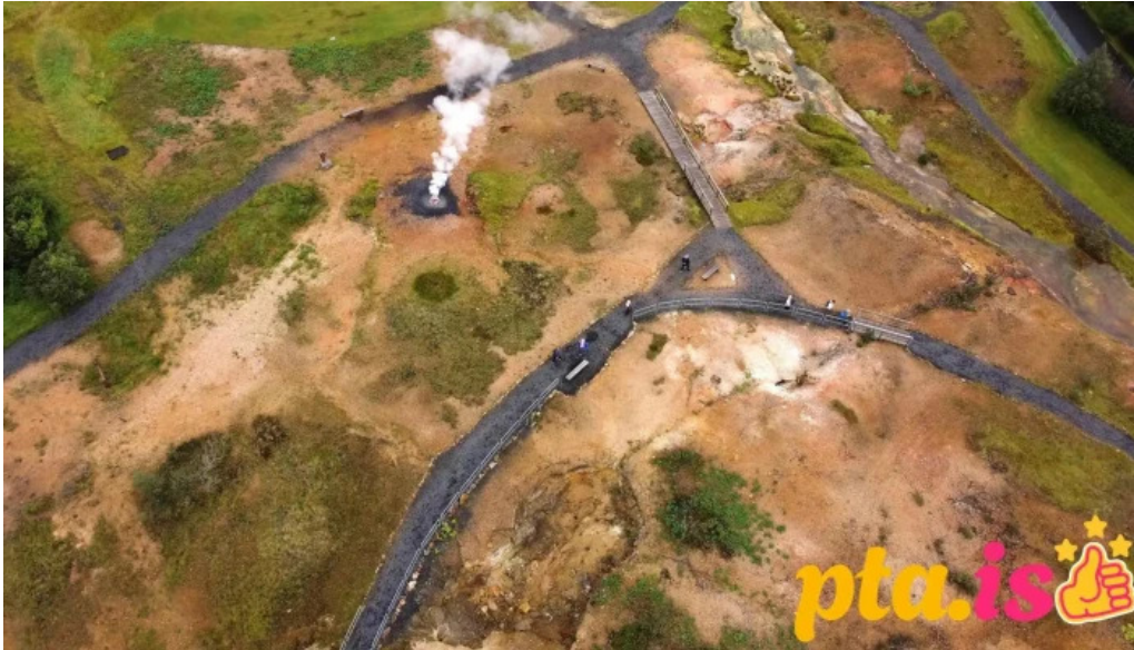
Hveragardurinn i hveragerdi ferðamannastaður