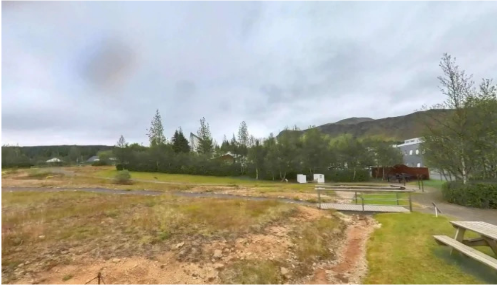
Hveragardurinn i hveragerdi street view 360deg