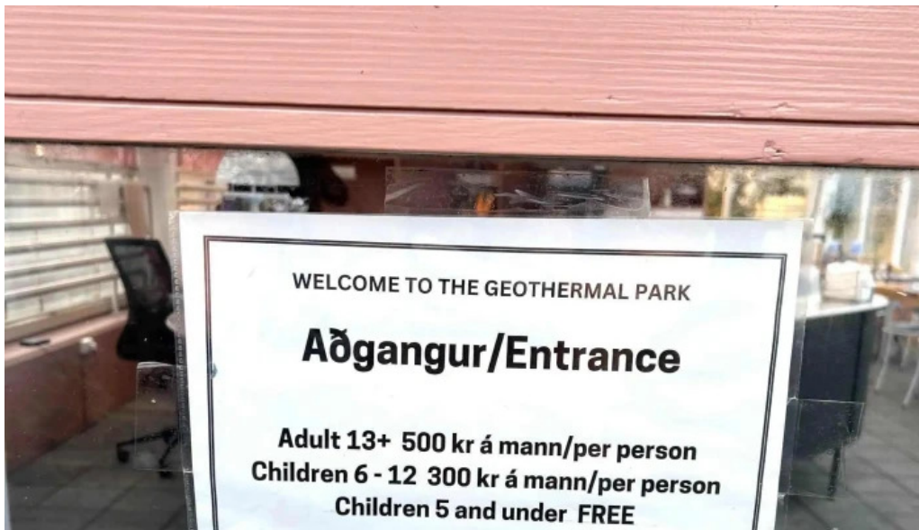
Hveragardurinn i hveragerdi heimilisfang