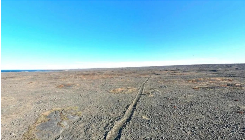
Hafnarberg street view 360deg