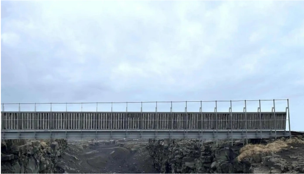
Bru milli heimsalfa hafnir