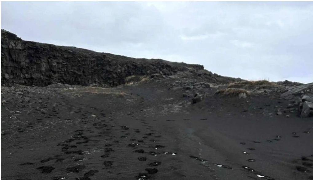
Bru milli heimsalfa myndir