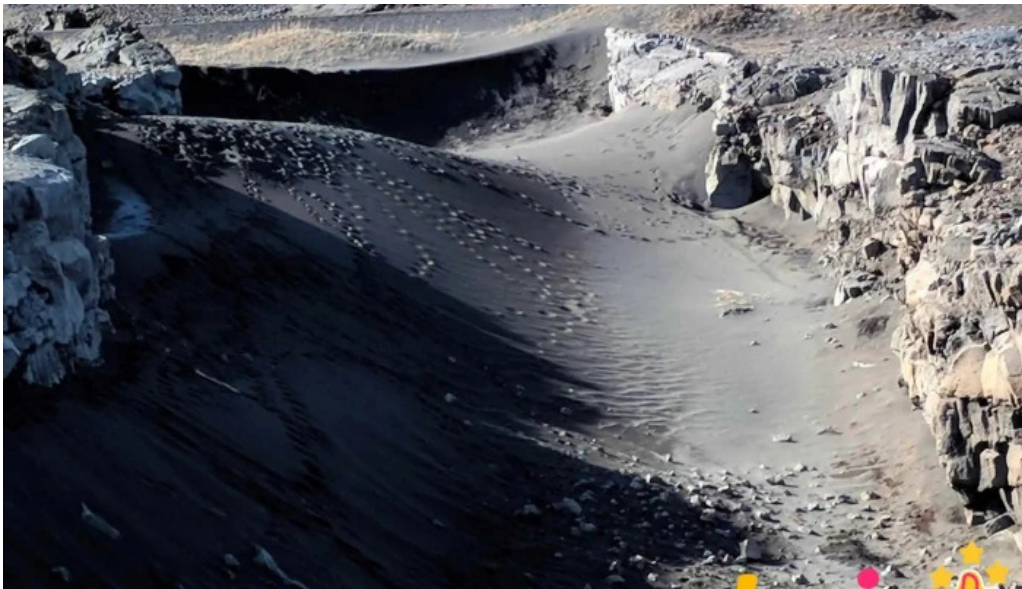
Bru milli heimsalfa fjall