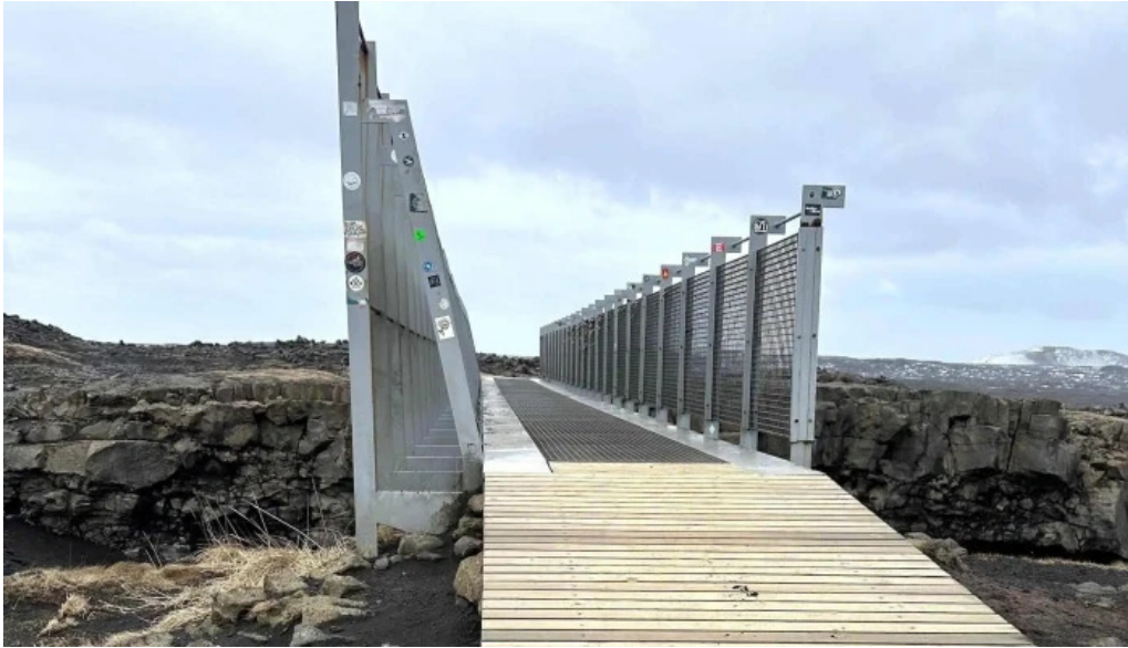
Bru milli heimsalfa myndbond