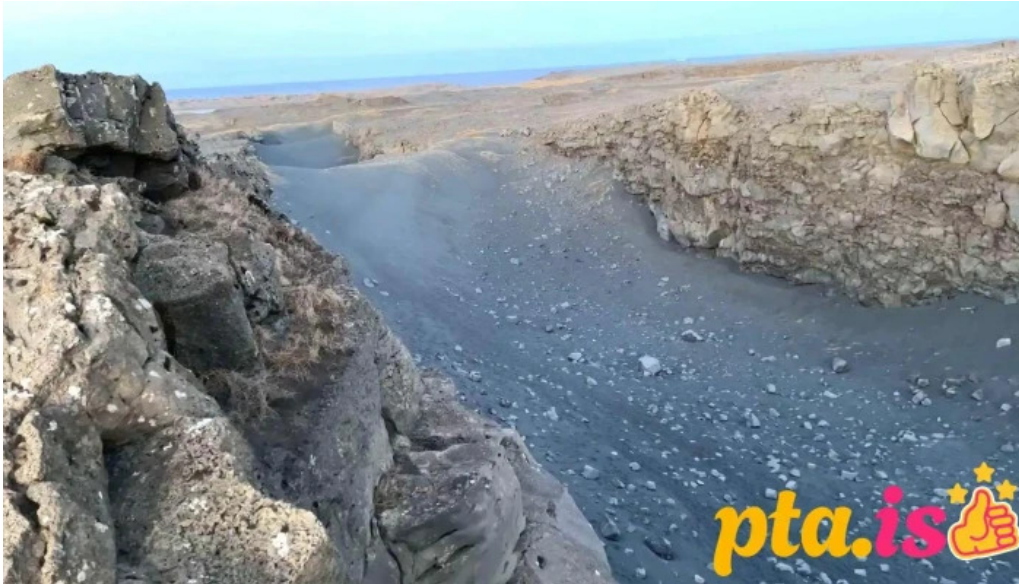
Bru milli heimsalfa myndskeld