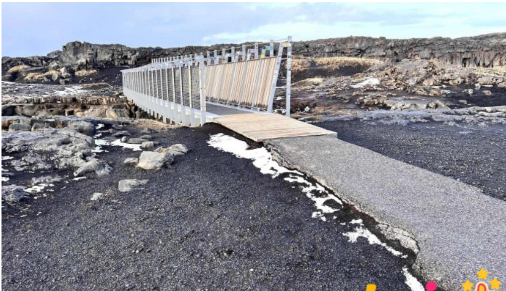
Bru milli heimsalfa nýjast