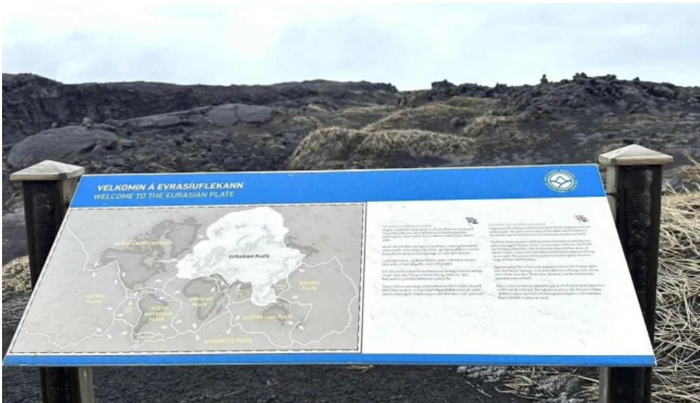
Bru milli heimsalfa nálægt mer