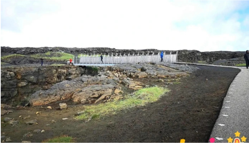
Bru milli heimsalfa ferðamannastaður