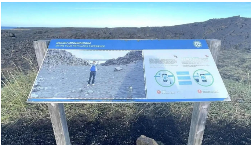
Bru milli heimsalfa vefsíða