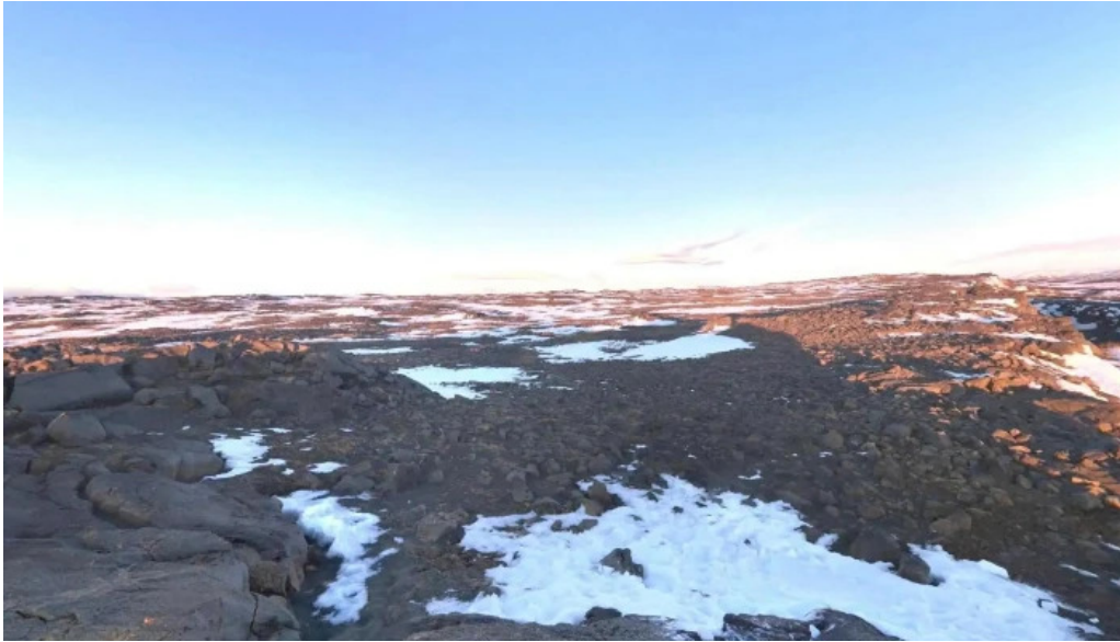
Bru milli heimsalfa street view 360deg