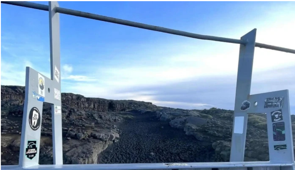
Bru milli heimsalfa opið nuna