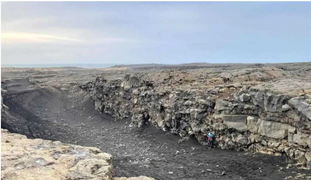
Bru milli heimsalfa heimilisfang