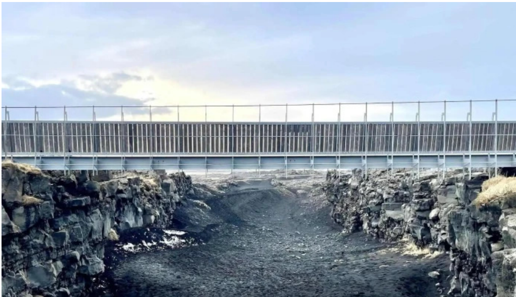
Bru milli heimsalfa einkunn