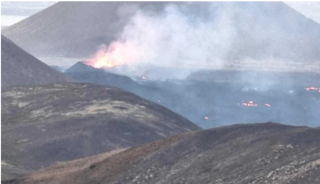
Litli hrutur eruption 2023 verð