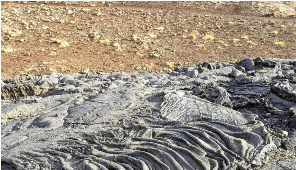
Litli hratur eruption 2023 instagram