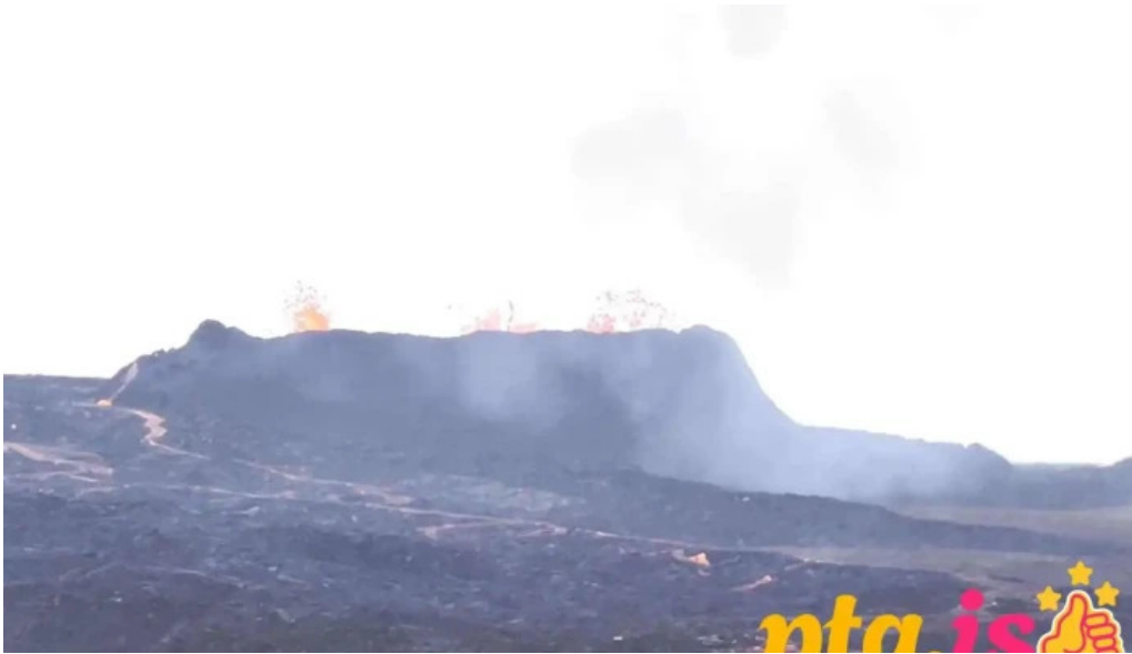
Litli hrutur eruption 2023 fjall