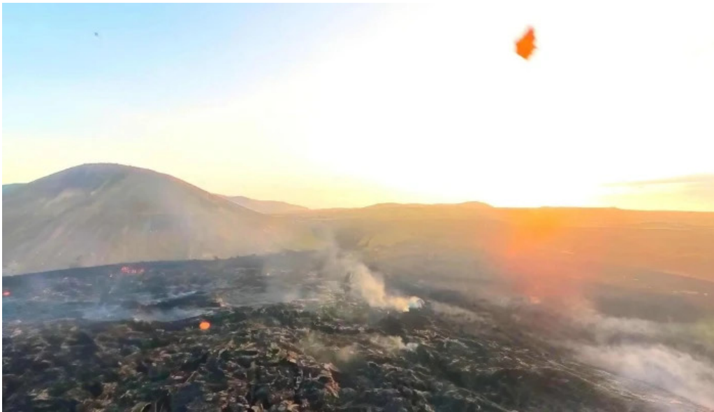
Litli hrutur eruption 2023 street view 360deg