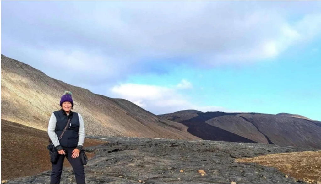
Litli hrutur eruption 2023 umsagnir