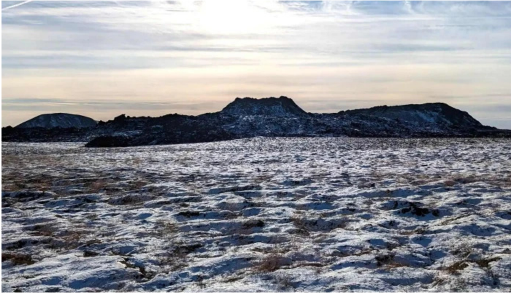
Litli hrutur eruption 2023 nálægt mer