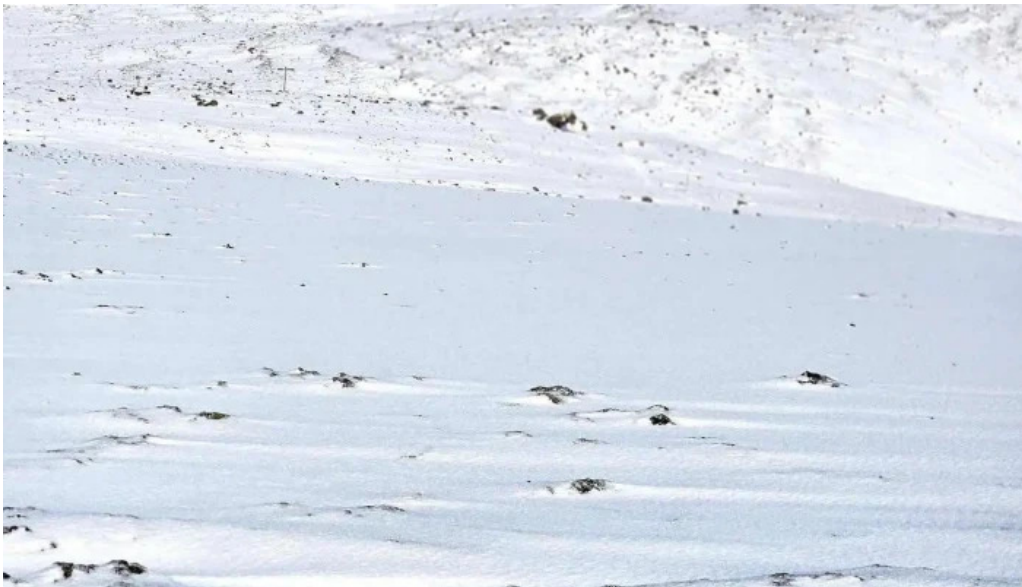
Litli hrutur eruption 2023 nyjast