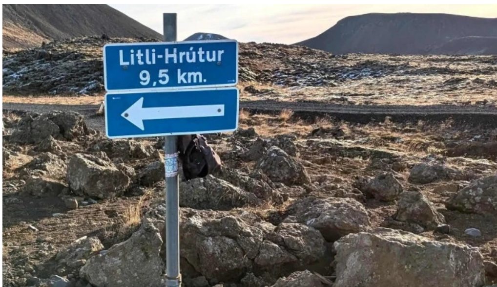
Litli hrutur eruption 2023 afslættir