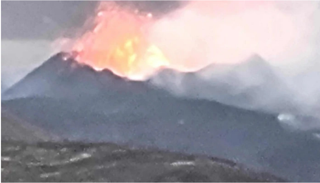
Litli hrutur eruption 2023 simi