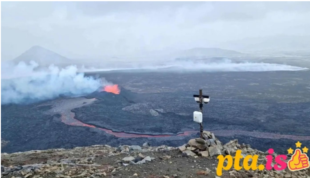
Litli hrutur eruption 2023 myndскеid