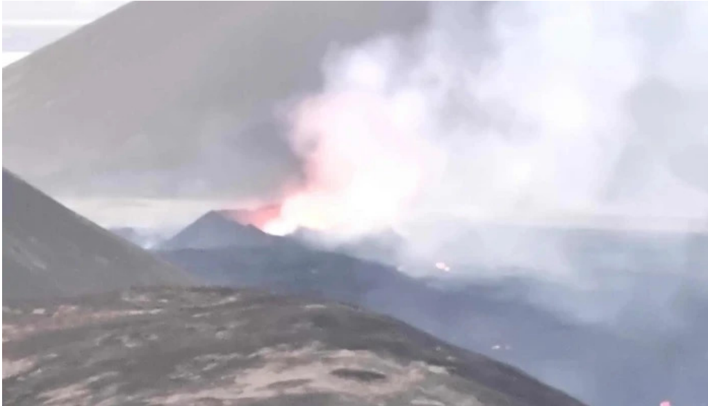
Litli hratur eruption 2023 myndbond