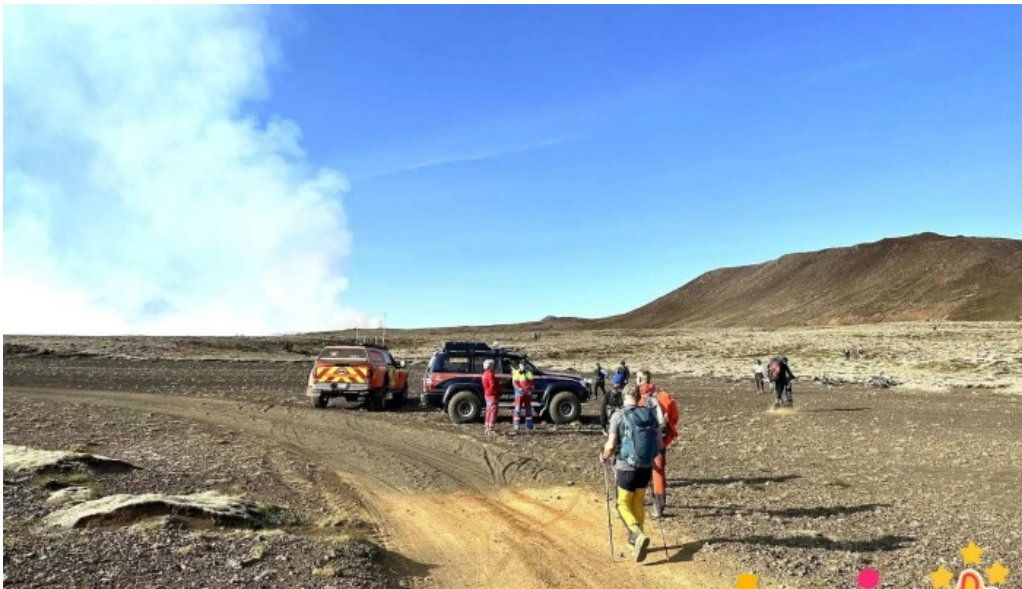
Litli hrutur eruption 2023 fra eiganda