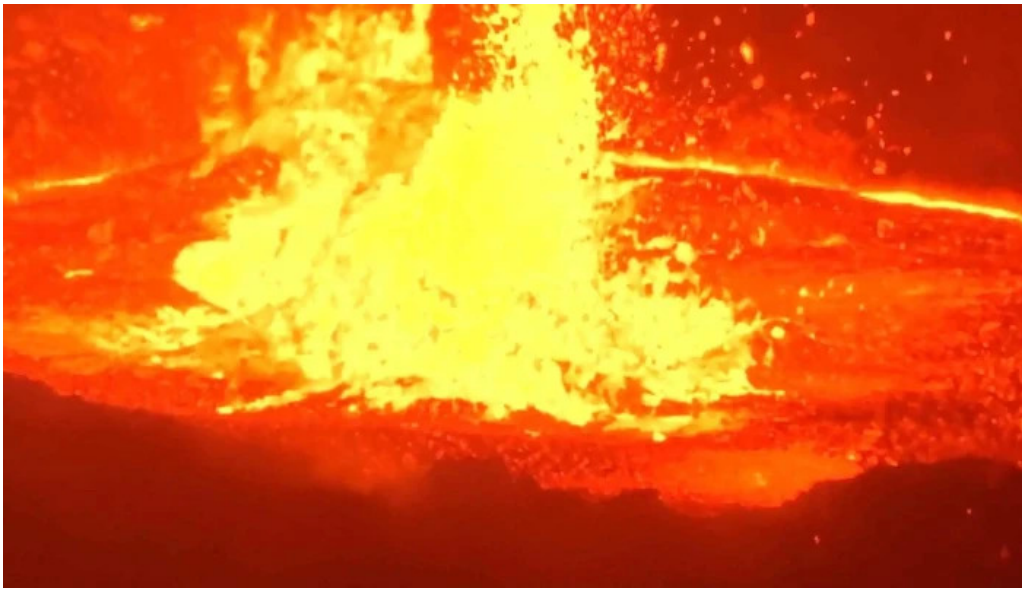
Litli hrutur eruption 2023 grindavik