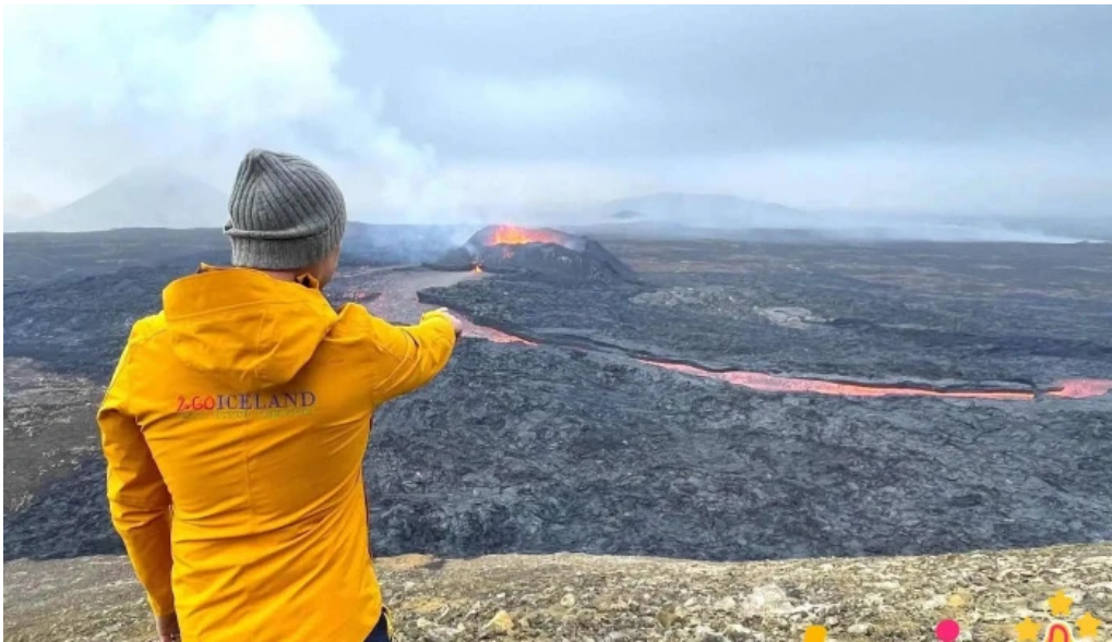
Litli hrutur eruption 2023 ferðamannastaður