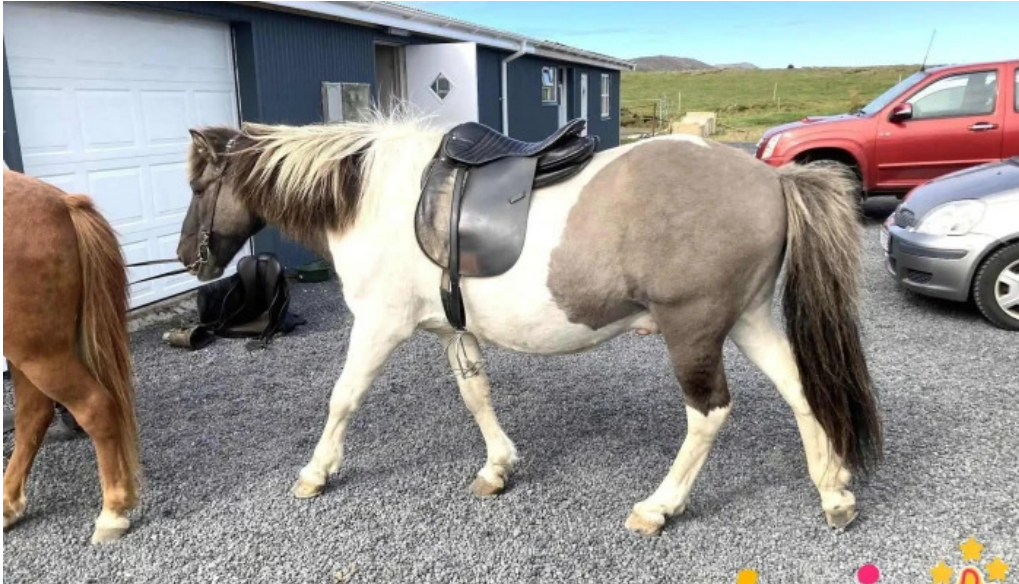
Arctic horses ferðamannastaður