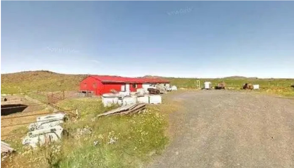
Arctic horses street view 360