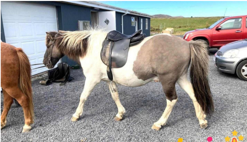
Arctic horses grindavik