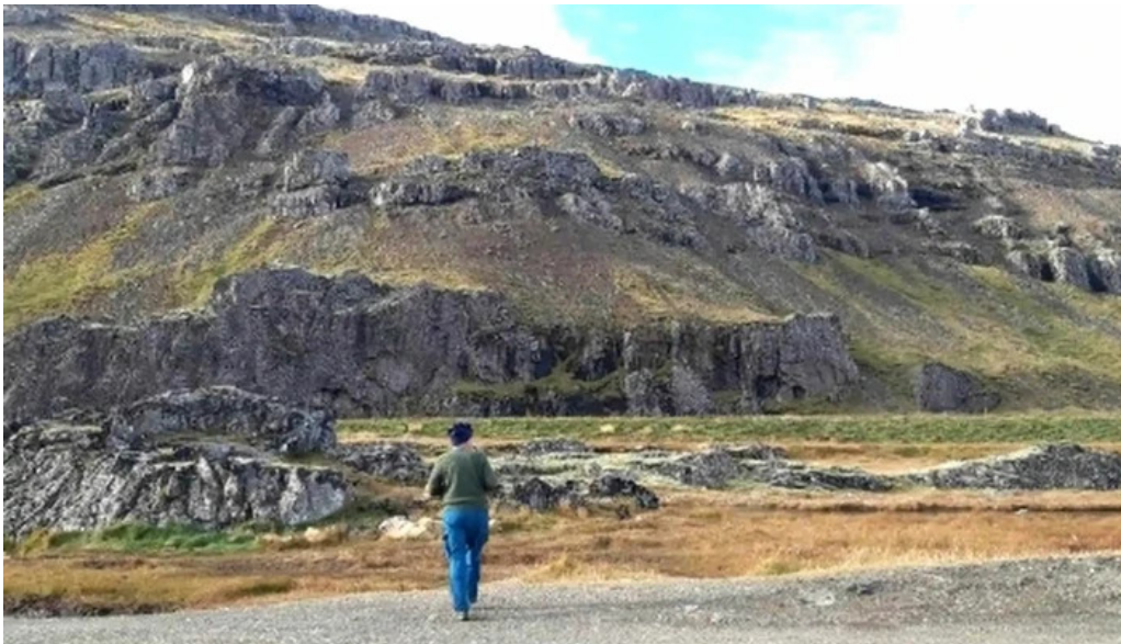
Streitisviti hvernig a að komast þangað