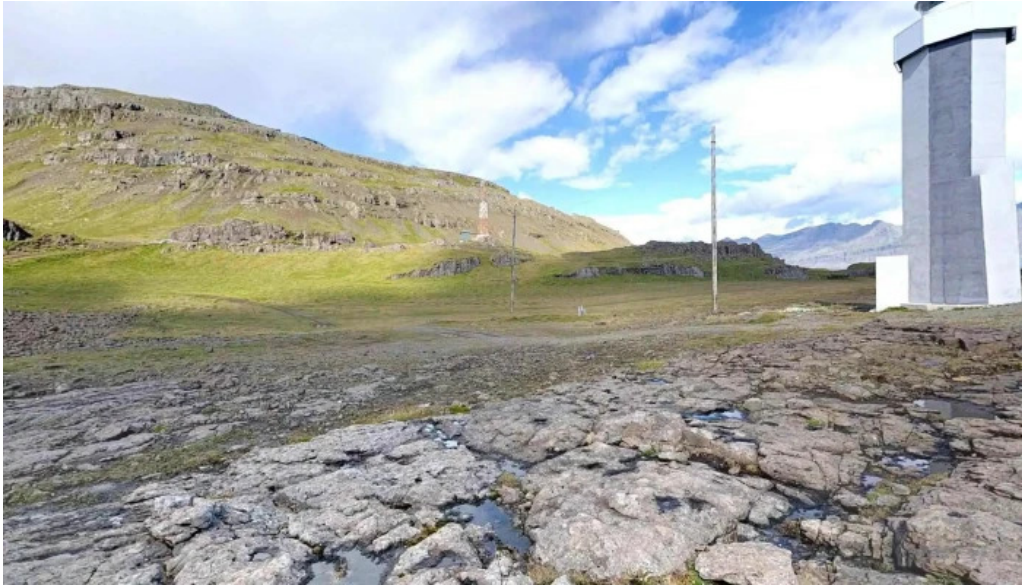
Streitisviti street view 360deg