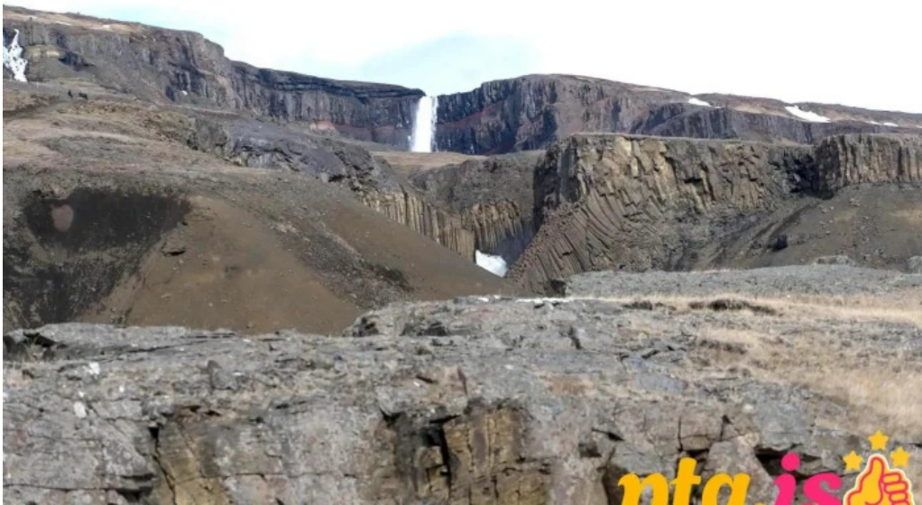
Hengifoss fra eiganda