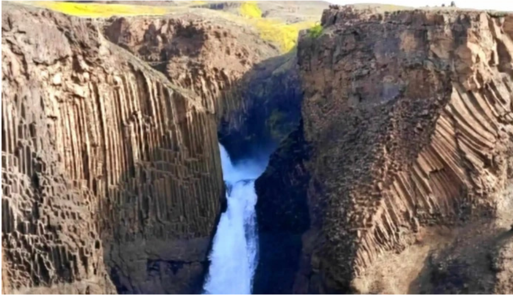
Hengifoss nálægt mer