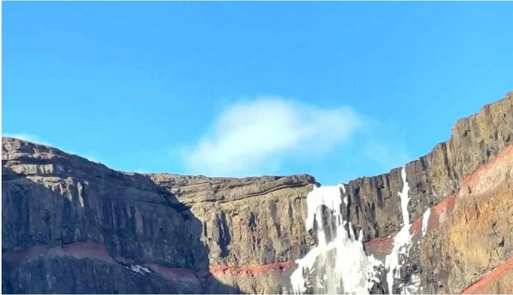
Hengifoss opið nuna