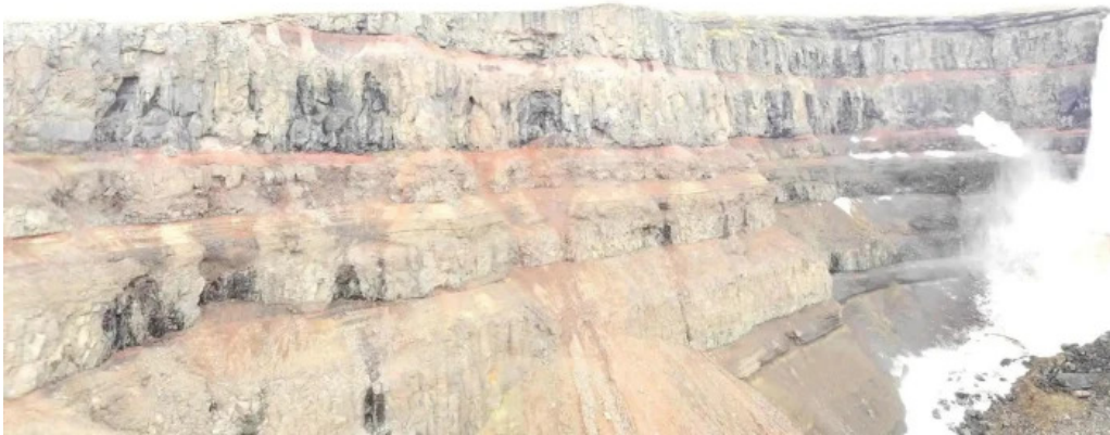
Hengifoss street view 360deg