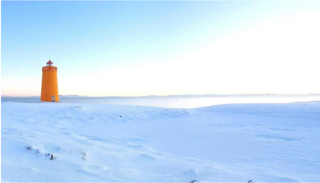
Holmsbergviti opið nuna