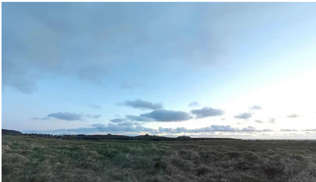
Hólmsbergviti street view 360deg