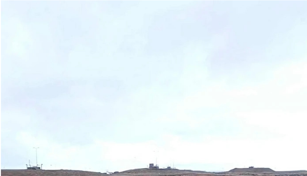
Holmsbergviti 2c/v 55p