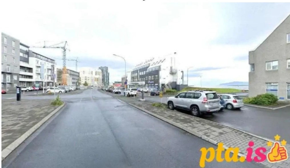
Fib felag islenskra bifreiðaeigenda reykjavik