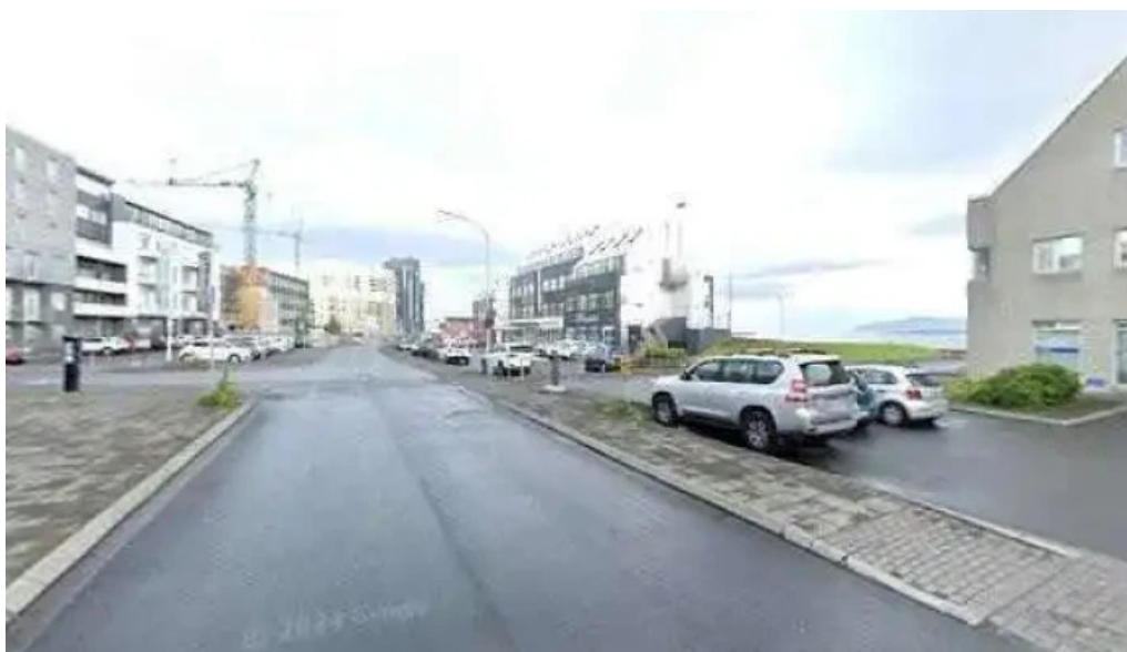
Fib felag islenskra bifreiðaeigenda felag eða stofnun