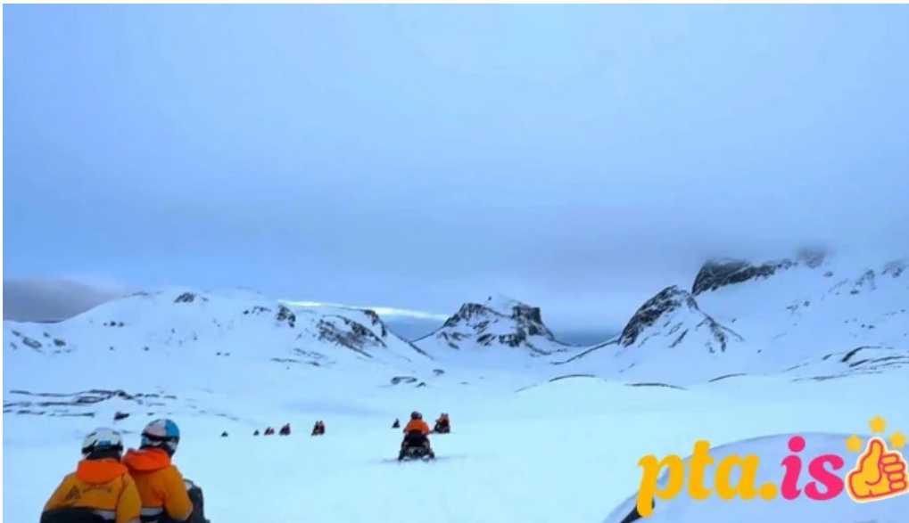
Blaskogabyggd sveitarfelag nyjast