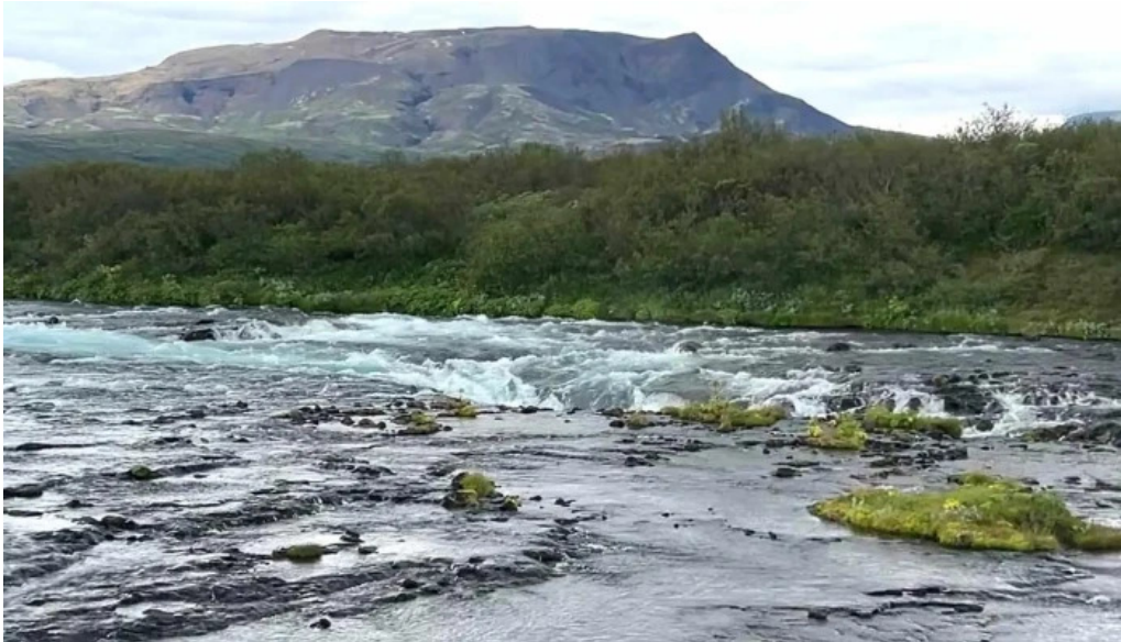
Blaskogabyggd sveitarfelag reykholt