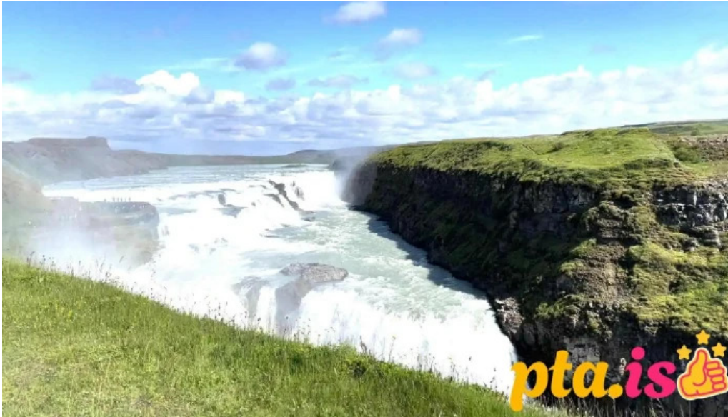
Blaskogabyggd sveitarfelag myndskid