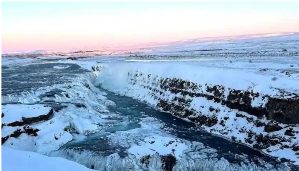
Blaskogabyggð sveitarfélag reykholt