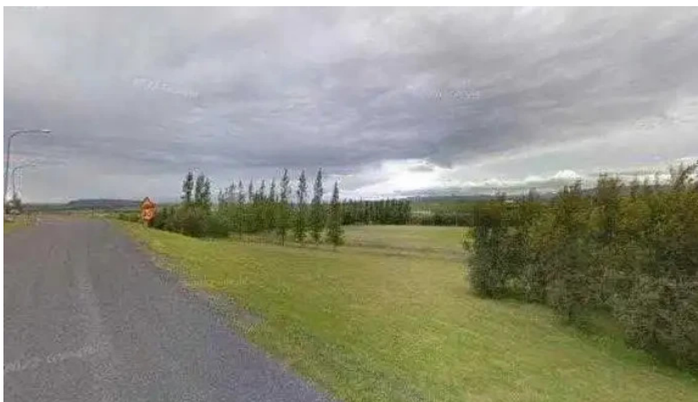
Blaskogabyggð sveitarfélag street view 360deg