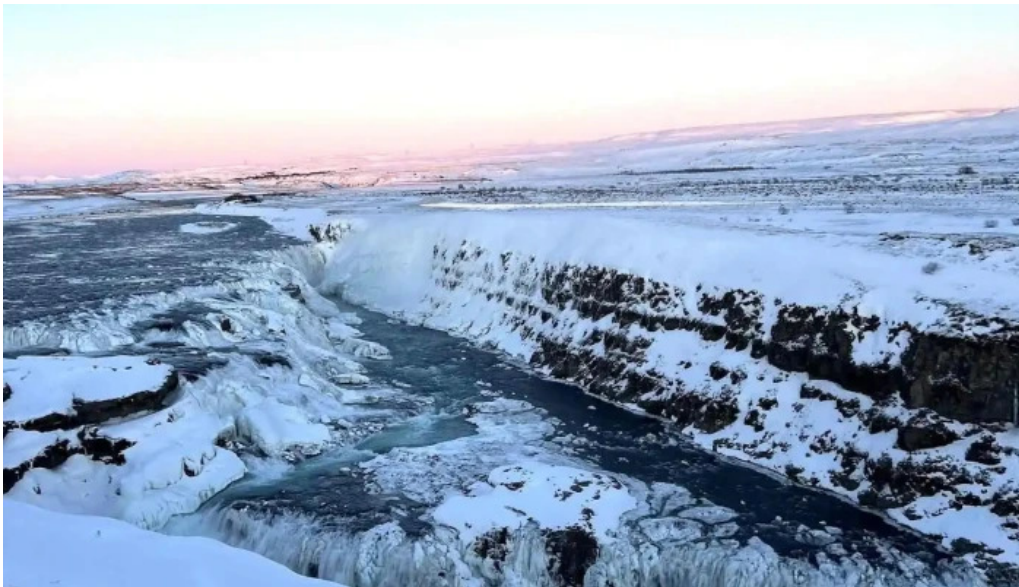
Blaskogabyggd sveitarfelag felag eða stofnun