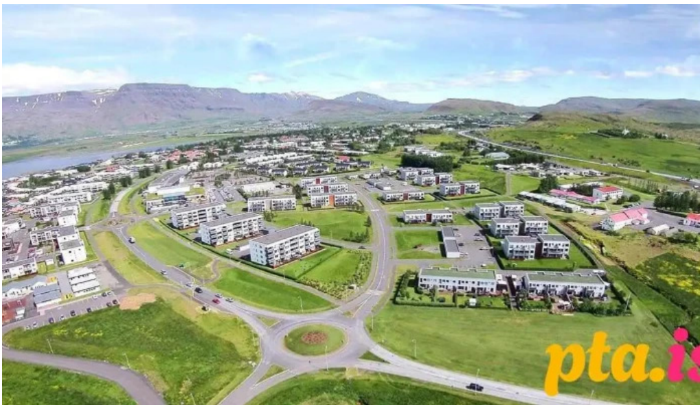
Starfsmannafelag mosfellsbæjar mosfellsbær