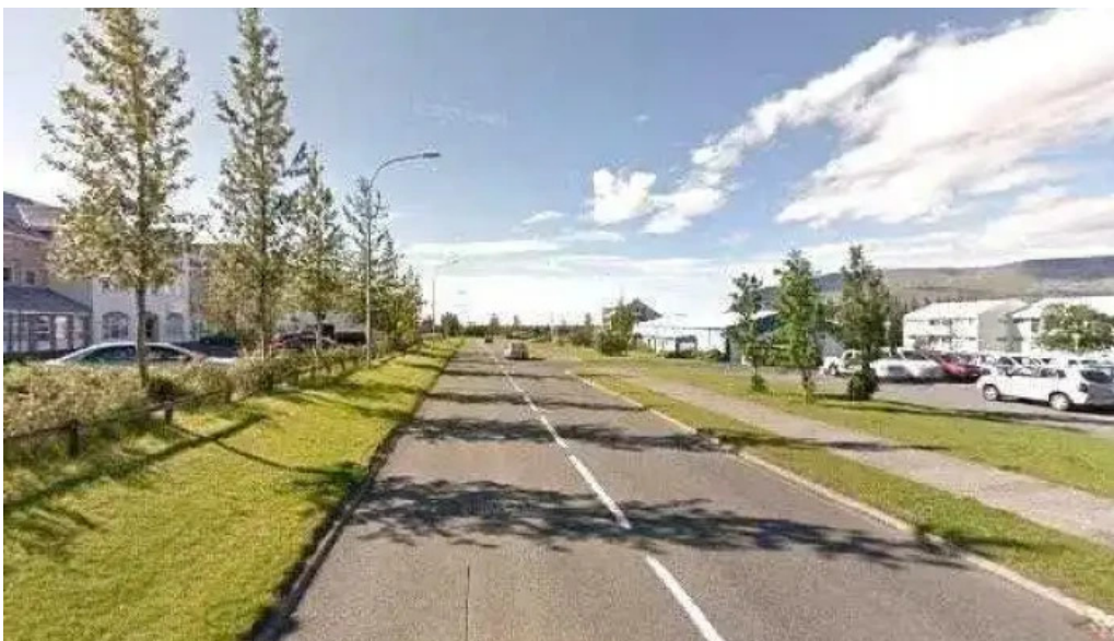
Starfsmannafelag mosfellsbæjar street view 360deg