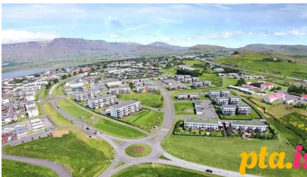
Starfsmannafelag mosfellsbæjar felag eða stofnun