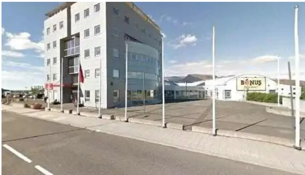
Efnalaugin mosfellsbae street view 360deg