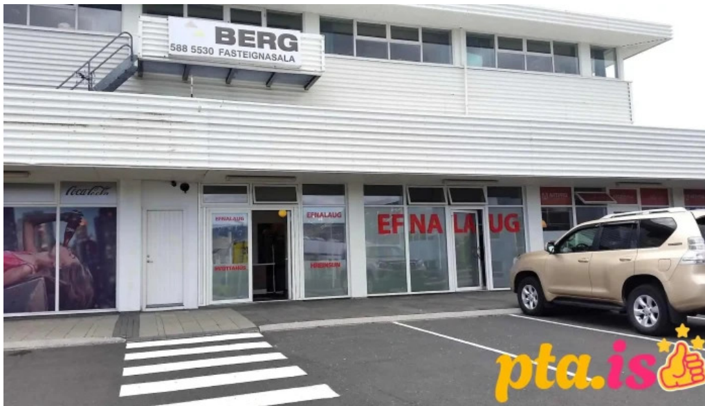
Efnalaugin mosfellsbæ fatahreinsun