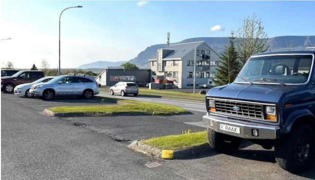
Dýralæknirinn mosfellsbæ mosfellsbær