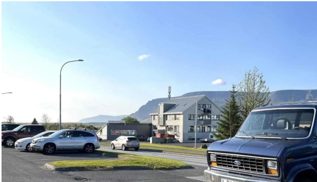
Dyralaeknirinn mosfellsbae mosfellsbaer