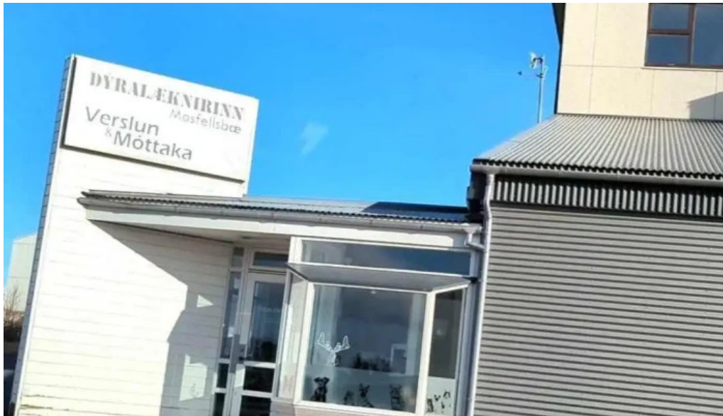
Dyralaeknirinn mosfellsbae myndskaid