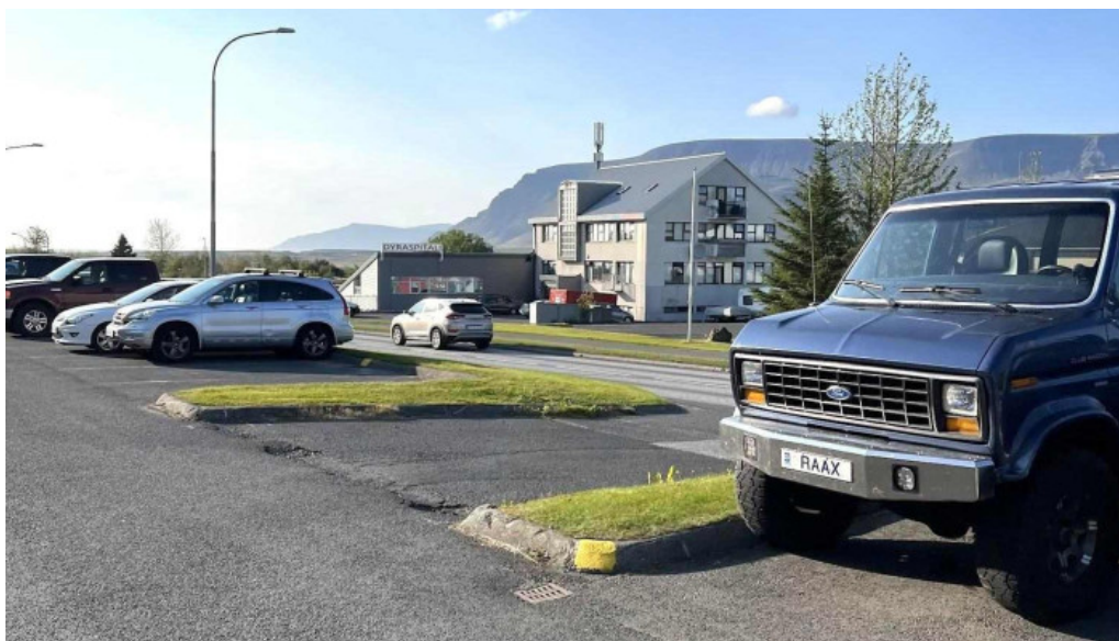
Dyralaeknirinn mosfellsbae dýraspítali