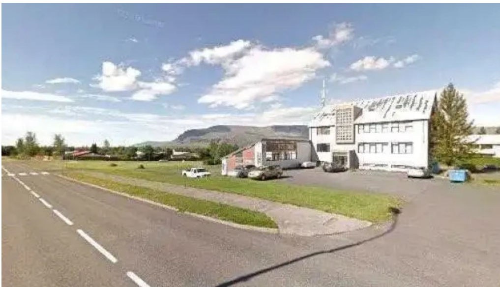
Dýralæknirinn mosfellsbæ street view 360deg