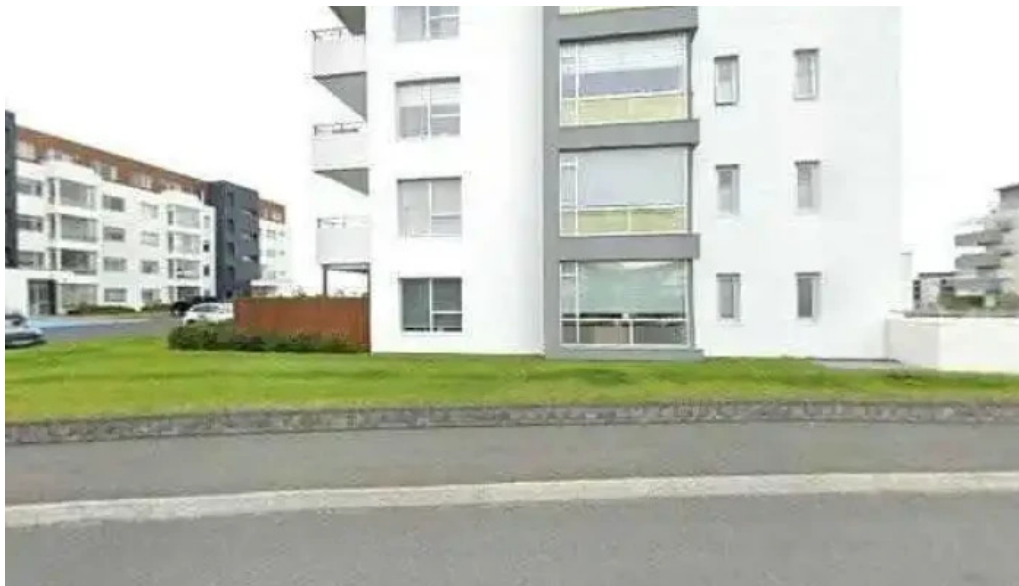
Hrafnista das dvalarheimili aldraðra