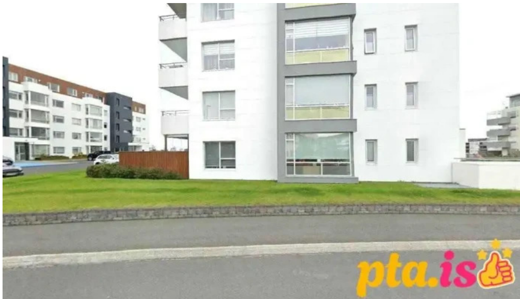
Hrafnista das kopavogur