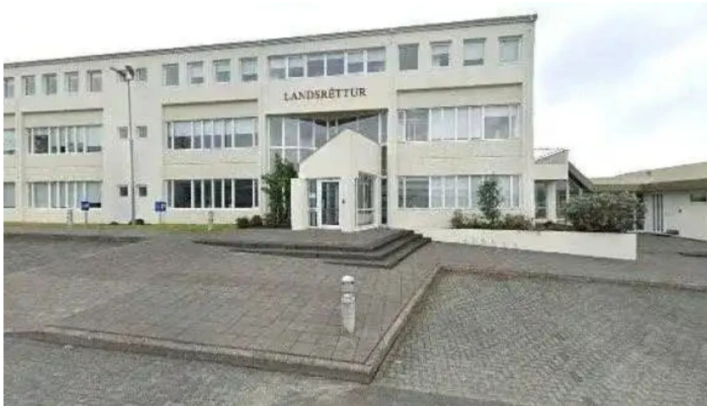
Landsrettur street view 360deg